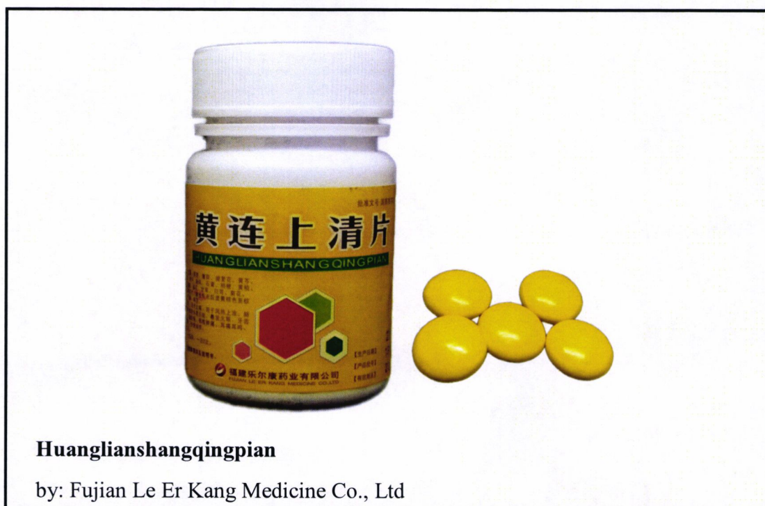
Larawan 5. Hindi rehistradong gamot