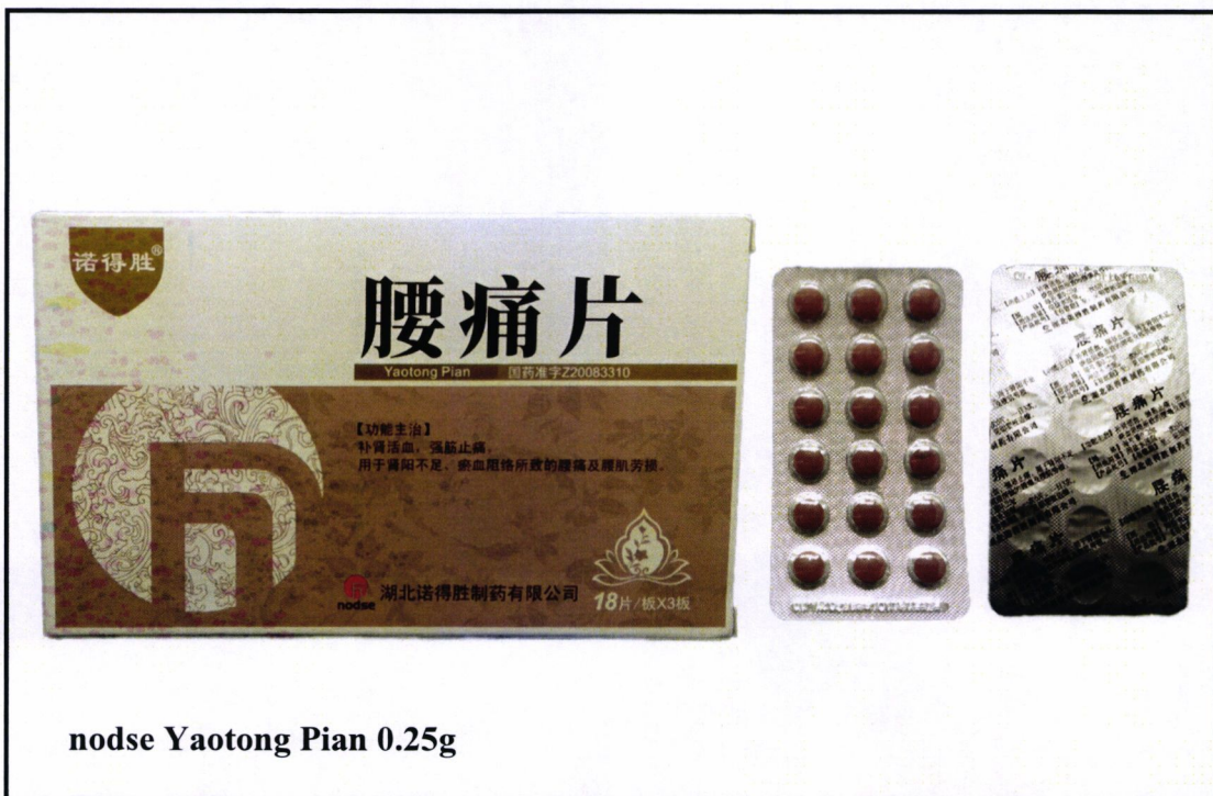
nodse Yaotong Pian 0.25g