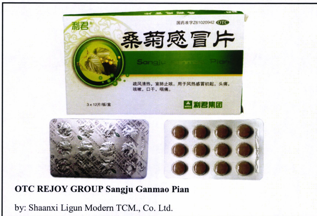
Larawan 4. Hindi rehistradong gamot