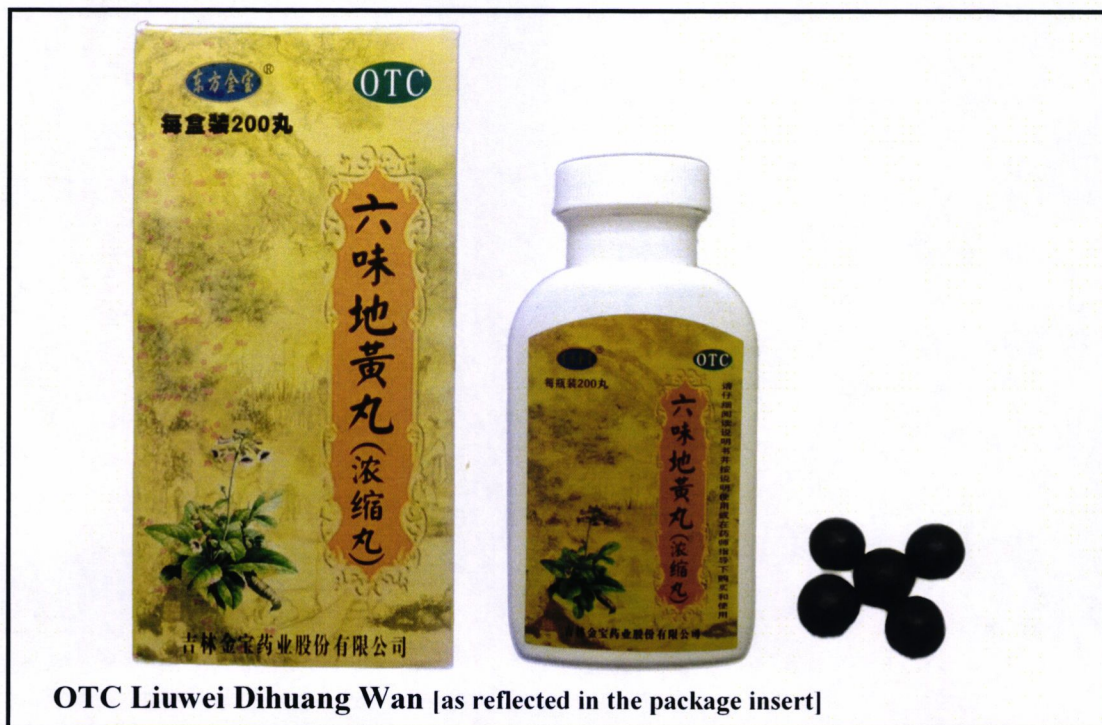
OTC Liuwei Dihuang Wan [as reflected in the package insert]

Pinapayuhan ng Food and Drug Administration (FDA) ang publiko laban sa pagbili at paggamit ng mga hindi rehistradong gamot na: