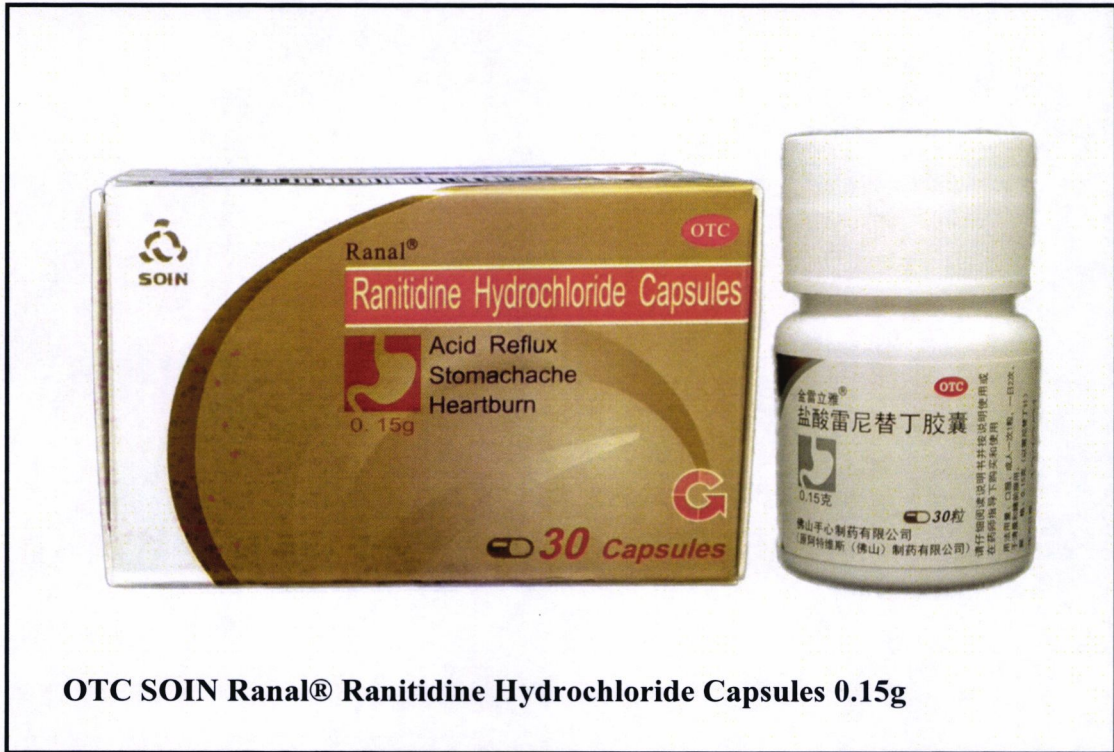
OTC SOIN Ranal® Ranitidine Hydrochloride Capsules 0.15g