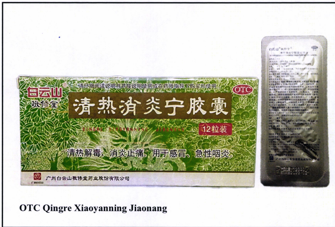
OTC Qingre Xiaoyanning Jiaonang