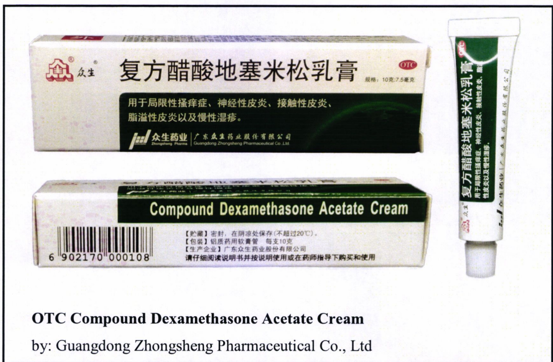
OTC Compound Dexamethasone Acetate Cream

by: Guangdong Zhongsheng Pharmaceutical Co., Ltd