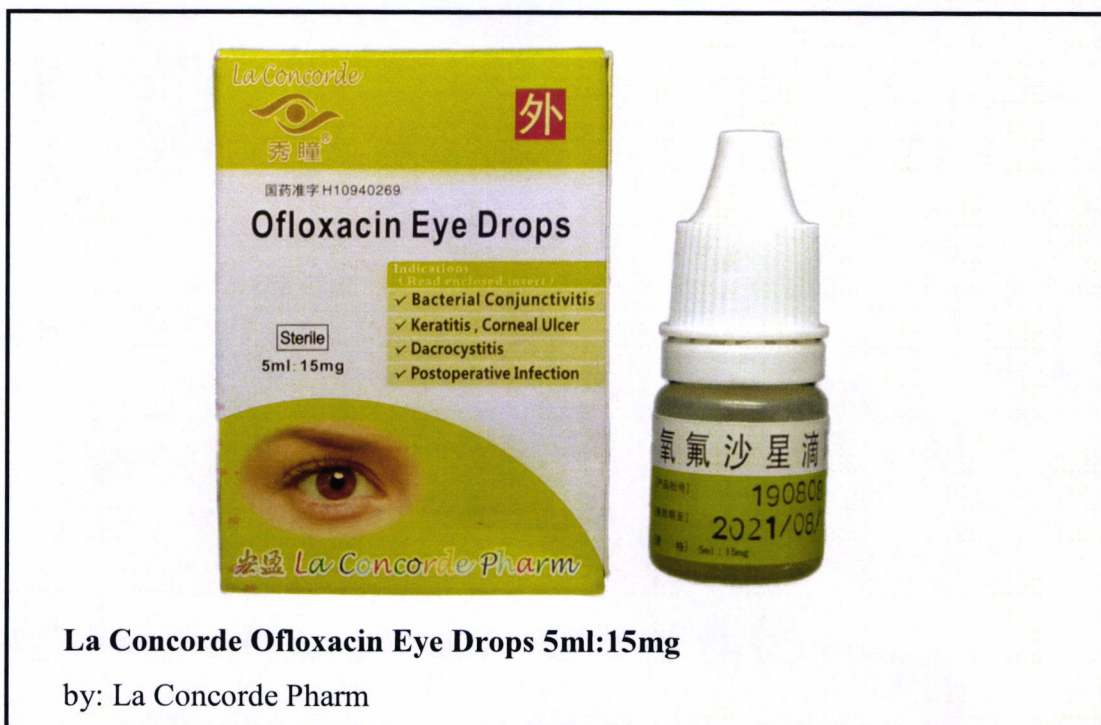
Larawan 3. Hindi rehistradong gamot