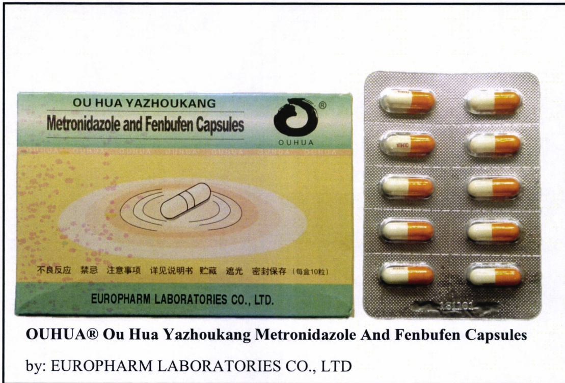
Larawan 4. Hindi rehistradong gamot