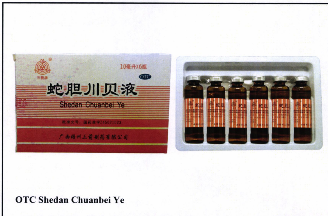
OTC Shedan Chuanbei Ye

Pinapayuhan ng Food and Drug Administration (FDA) ang publiko laban sa pagbili at paggamit ng mga hindi rehistradong gamot na: