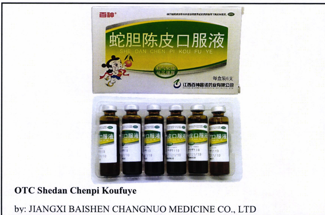
Larawan 5. Hindi rehistradong gamot