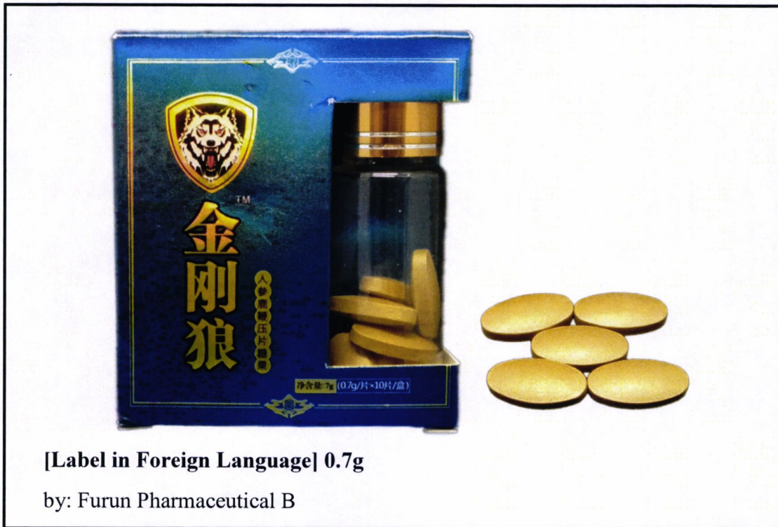
Larawan 2. Hindi rehistradong gamot