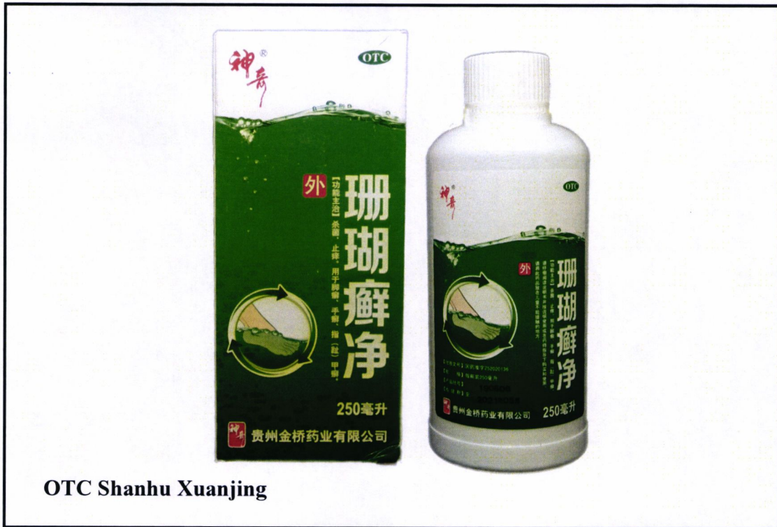
OTC Shanhu Xuanjing