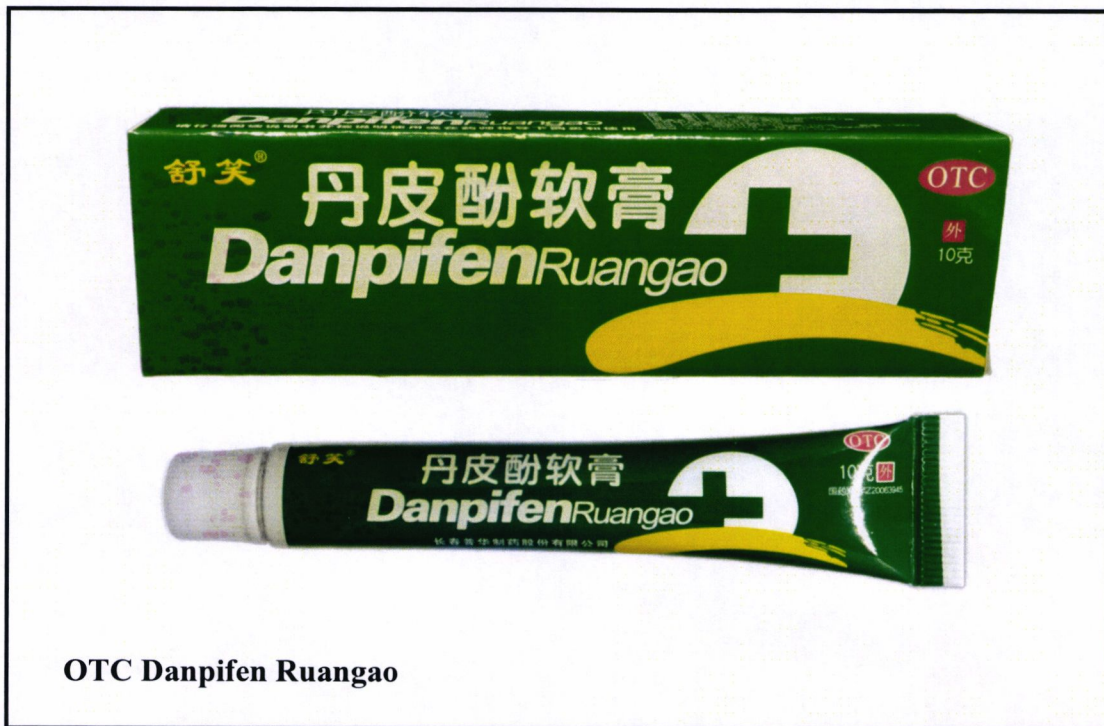
OTC Danpifen Ruangao