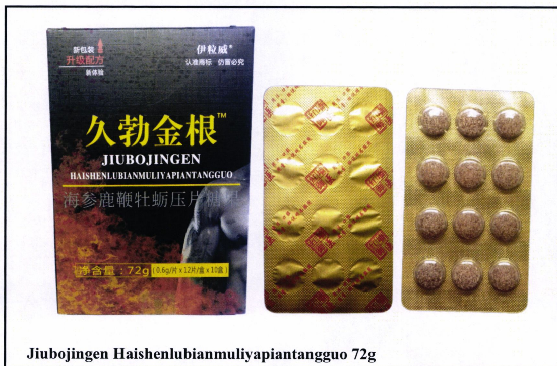
Jiubojingen Haishenlubianmuliypiantangguo 72g

Pinapayuhan ng Food and Drug Administration (FDA) ang publiko laban sa pagbili at paggamit ng mga hindi rehistradong gamot na: