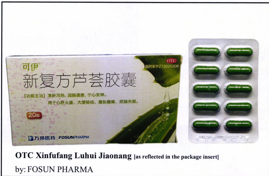
OTC Xinfufang Luhui Jiaonang [as reflected in the package insert] by: FOSUN PHARMA