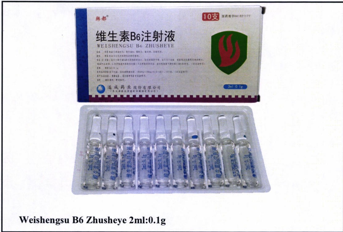
Weishengsu B6 Zhusheye 2ml:0.1g