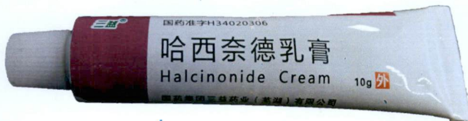
Halcinonide Cream 10g by: Sinopharm Sanyi