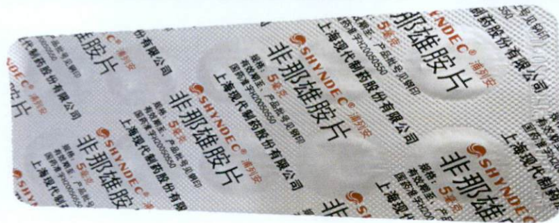
Shyndec® Finasteride Tablets by: Shanghai Shyndec Pharmaceutical Co., Ltd.