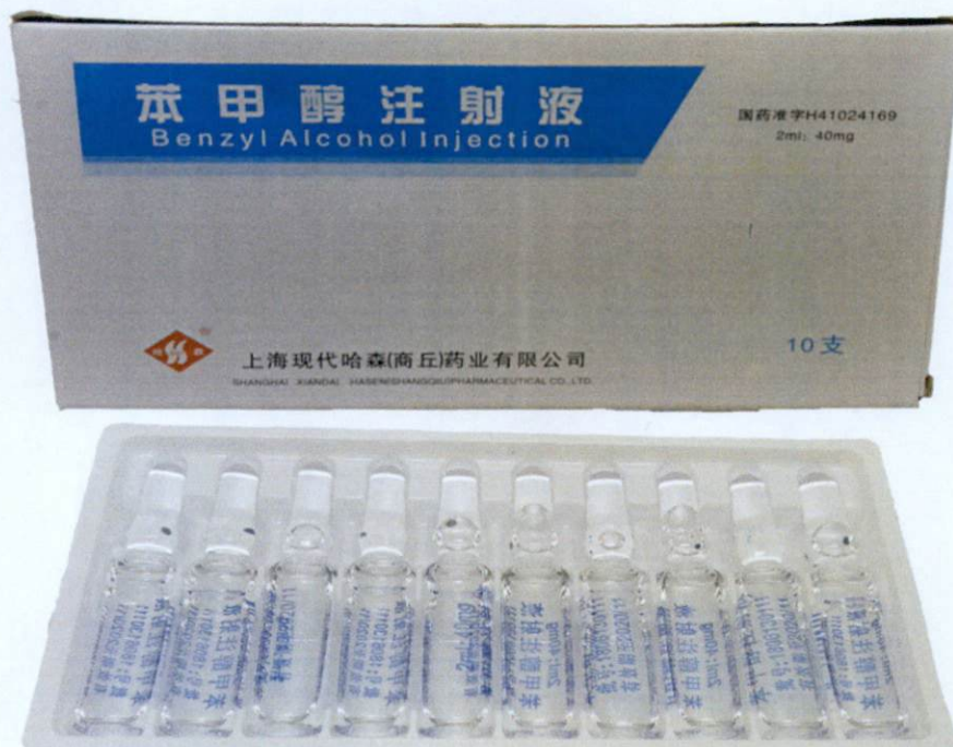
Benzyl Alcohol Injection 2ml:40mg by: Shanghai Xiandai Hasen (Shangqiu) Pharmaceutical Co., Ltd.