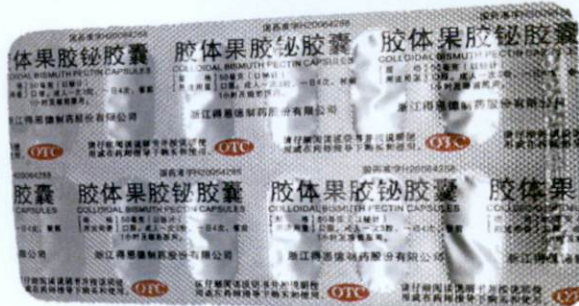
OTC Colloidal Bismuth Pectin Capsule