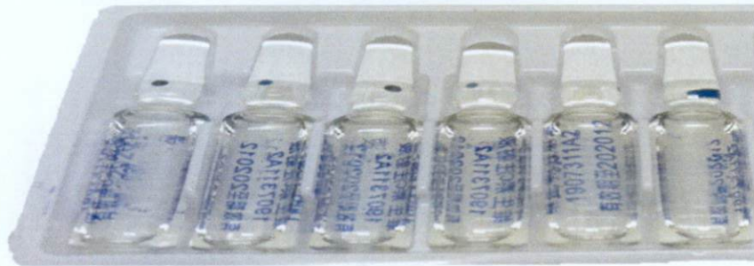
Jucishan ® Vitamin C Injection 2ml:0.5g by: Zhengzhou Zhoufeng Pharmaceutical Co., Ltd.