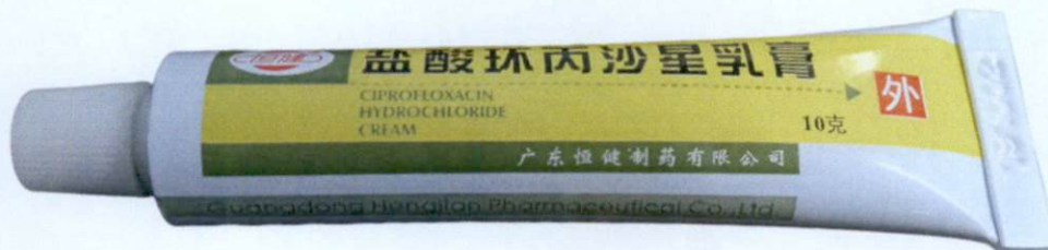
Ciprofloxacin Hydrochloride Cream by: Guangdong Hengjian Pharmaceutical Co., Ltd.