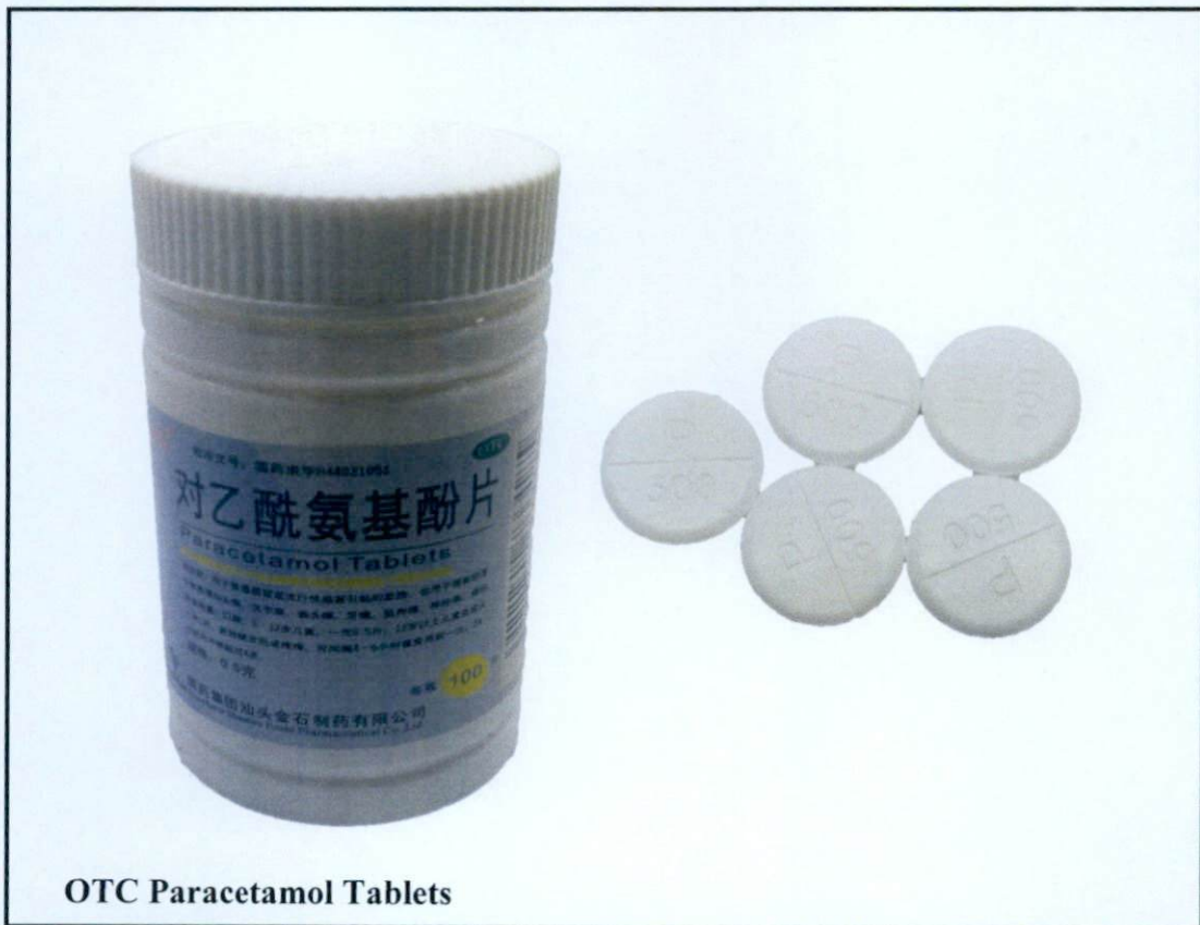
OTC Paracetamol Tablets