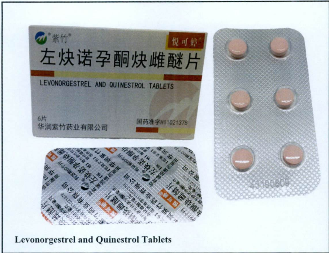
Levonorgestrel and Quinestrol Tablets