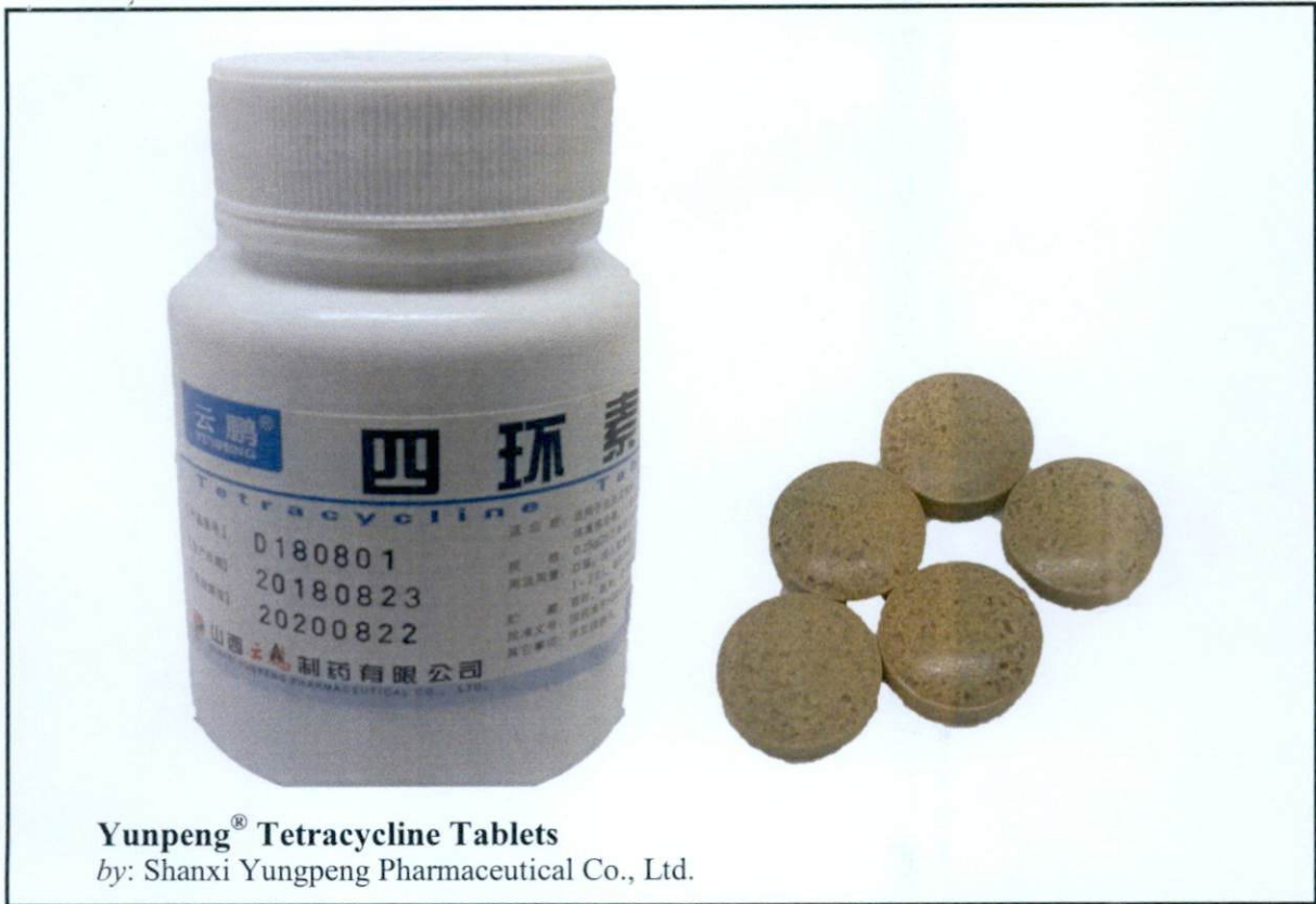
Larawan 2. Hindi rehistradong gamot