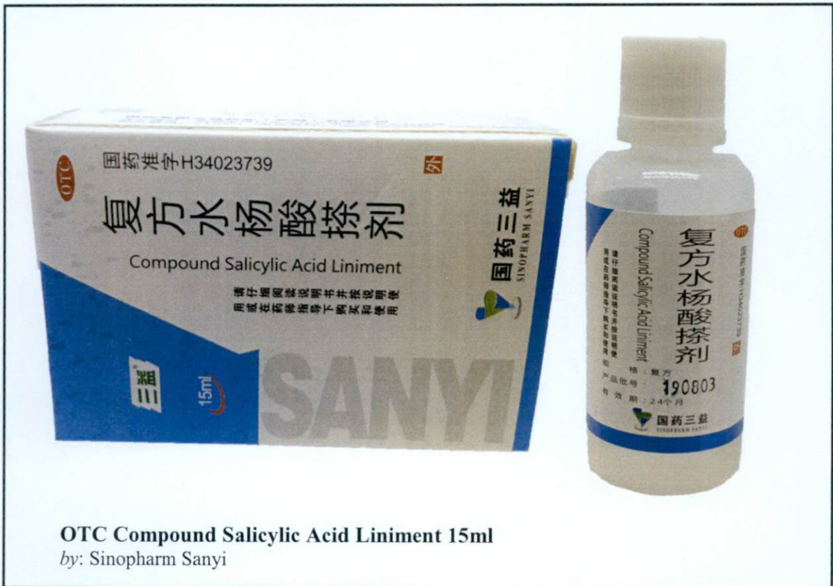
Larawan 3. Hindi rehistradong gamot