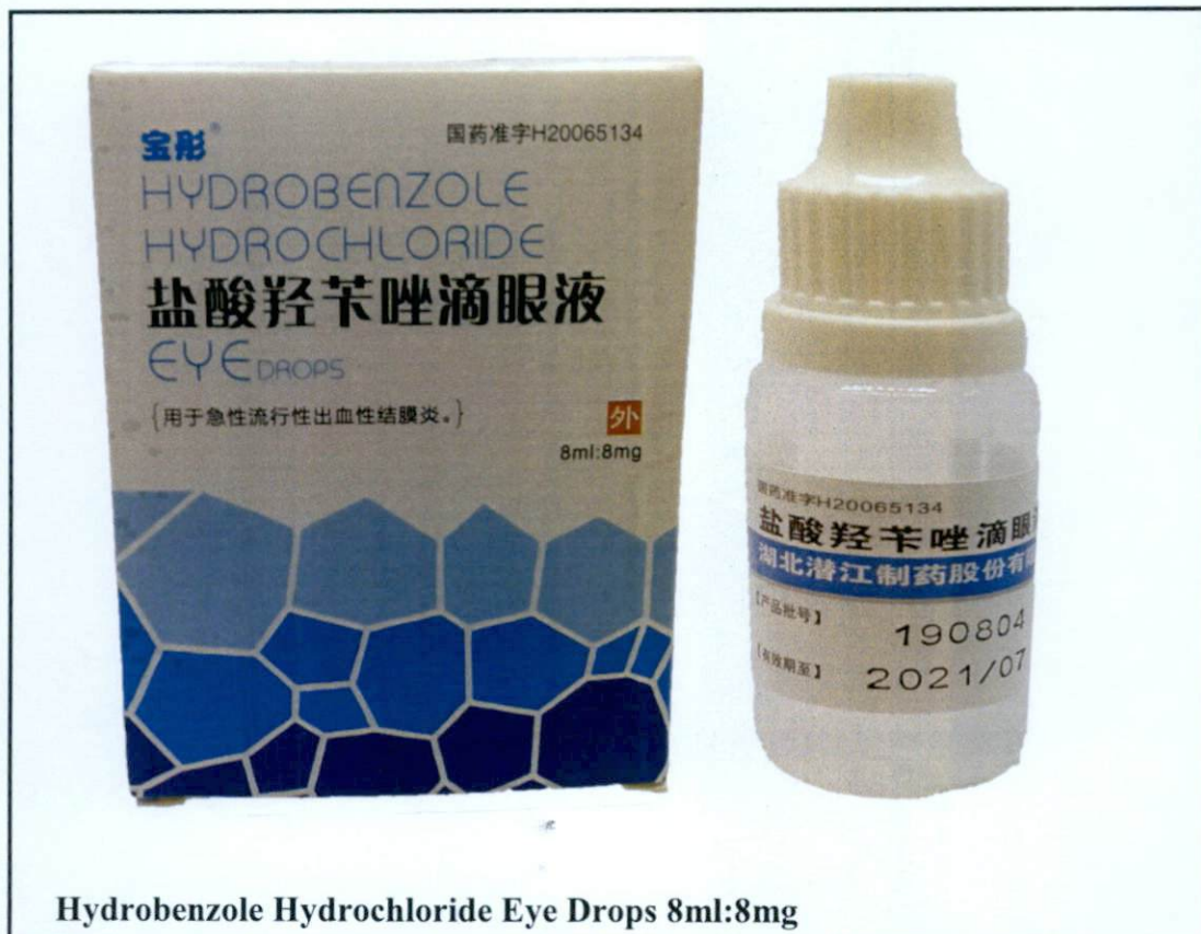
Larawan 1. Hindi rehistradong gamot

Pinapayuhan ng Food and Drug Administration (FDA) ang publiko laban sa pagbili at paggamit ng mga hindi rehistradong gamot na: