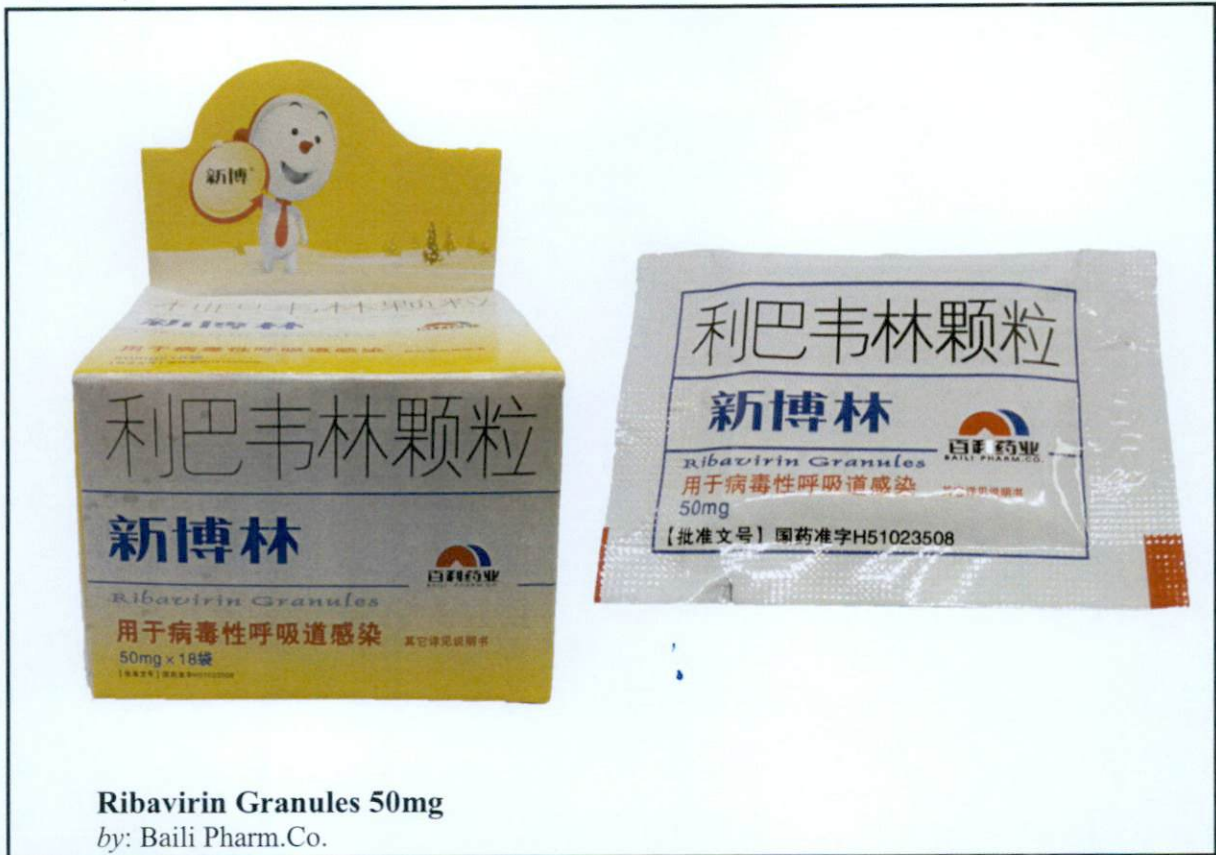
Ribavirin Granules 50mg by: Baili Pharm.Co.