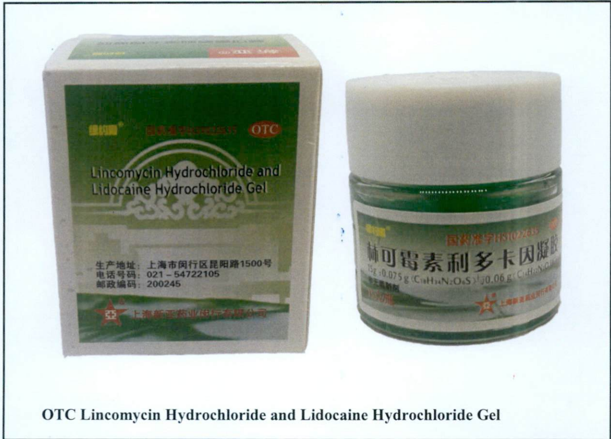
OTC Lincomycin Hydrochloride and Lidocaine Hydrochloride Gel