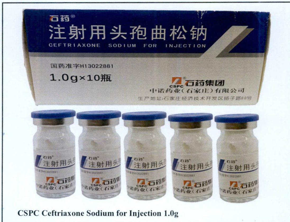
CSPC Ceftriaxone Sodium for Injection 1.0g

Pinapayuhan ng Food and Drug Administration (FDA) ang publiko laban sa pagbili at paggamit ng mga hindi rehistradong gamot na: