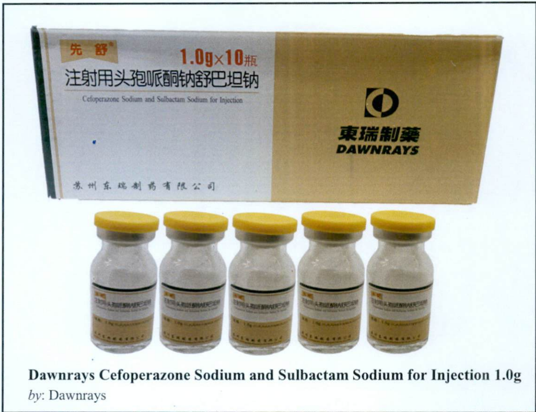
Dawnrays Cefoperazone Sodium and Sulbactam Sodium for Injection 1.0g