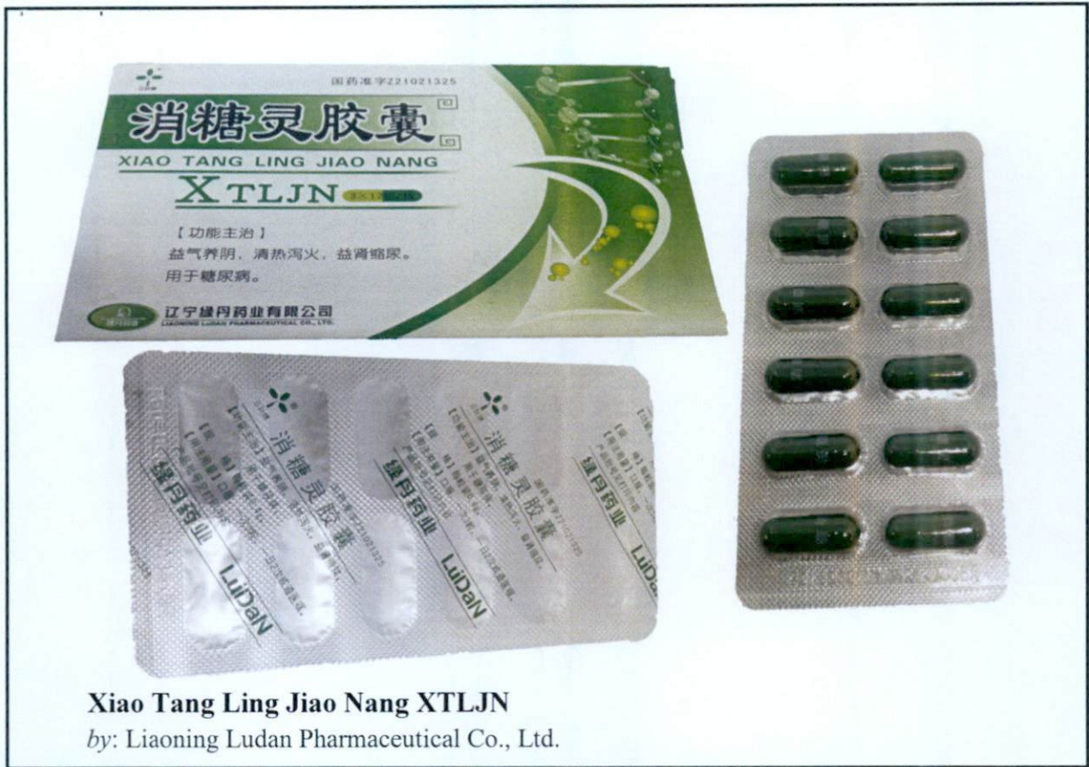
Xiao Tang Ling Jiao Nang XTLJN by: Liaoning Ludan Pharmaceutical Co., Ltd.