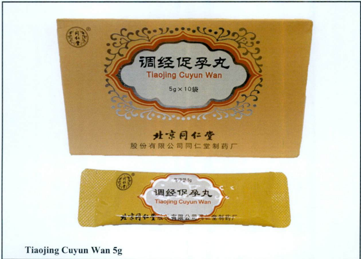
Tiaojing Cuyun Wan 5g