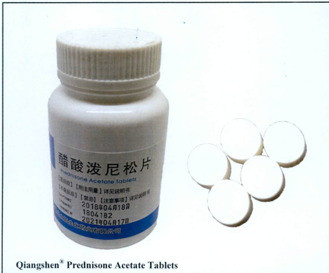
Qiangshen® Prednisone Acetate Tablets

Pinapayuhan ng Food and Drug Administration (FDA) ang publiko laban sa pagbili at paggamit ng mga hindi rehistradong gamot na: