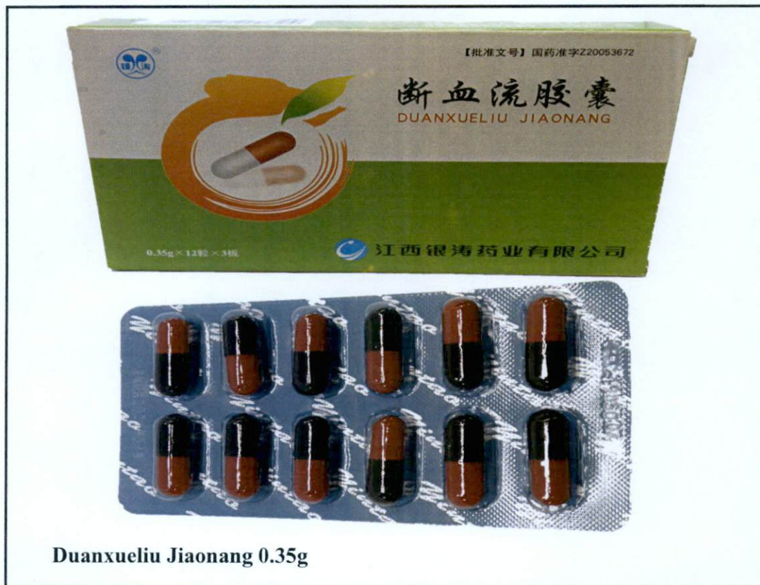
Duanxueliu Jiaonang 0.35g

Pinapayuhan ng Food and Drug Administration (FDA) ang publiko laban sa pagbili at paggamit ng mga hindi rehistradong gamot na: