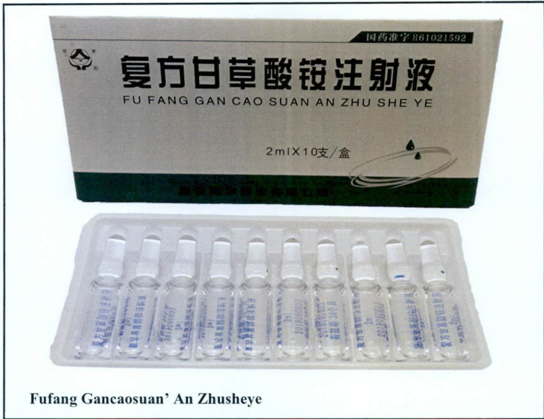
Fufang Gancaosuan' An Zhusheye