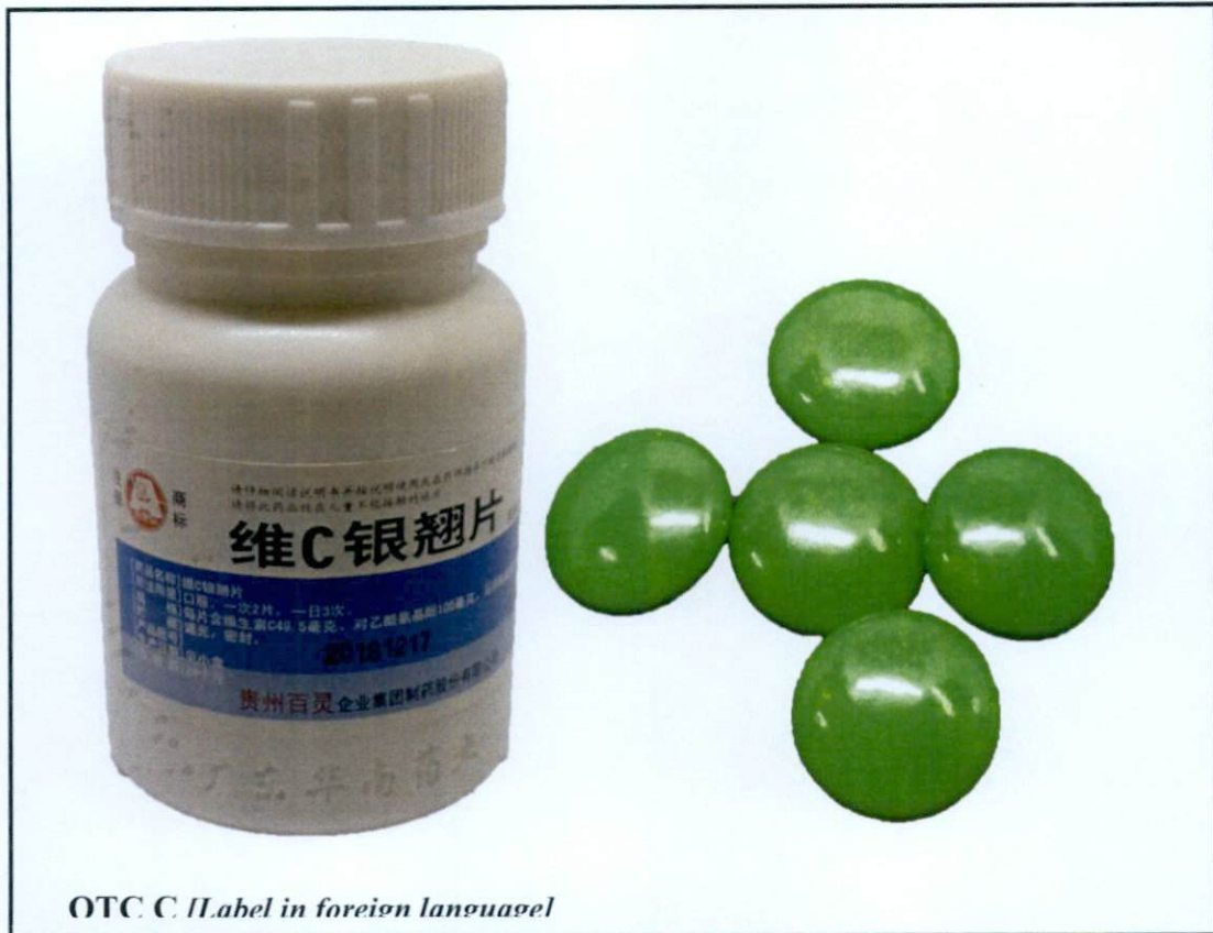
Larawan 4. Hindi rehistradong gamot

Napatunayan sa pamamagitan ng isinagawang Post-Marketing Surveillance (PMS) ng FDA na ang mga nasabing gamot ay hindi dumaaan sa proseso ng rehistrasyon ng Ahensya at hindi nabigyan ng kaukulang awtorisasyon tulad ng Certificate of Product Registration (CPR). Dahil dito, hindi masisiguro ng Ahensya ang kalidad, kaligtasan at bisa nito. Samakatuwid, ang paggamit ng nasabing mga ilegal na produkto ay maaaring magdulot ng panganib sa kalusugan.