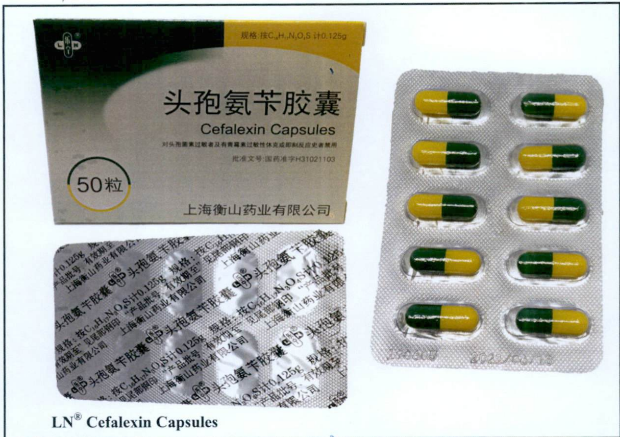
Larawan 2. Hindi rehistradong gamot