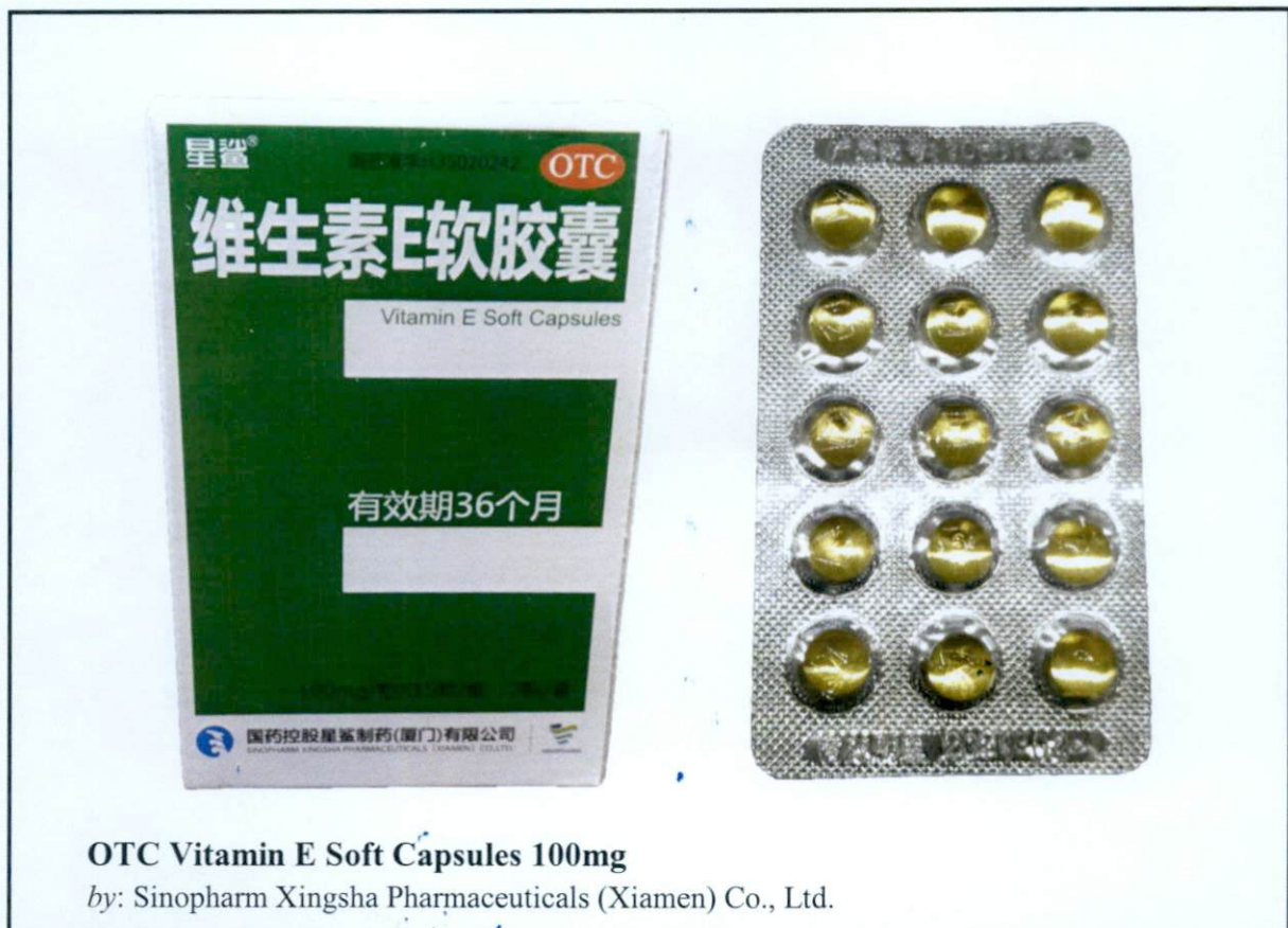
Larawan 3. Hindi rehistradong gamot