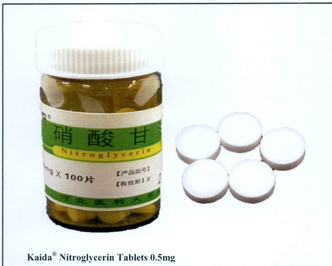
Kaida® Nitroglycerin Tablets 0.5mg

Pinapayuhan ng Food and Drug Administration (FDA) ang publiko laban sa pagbili at paggamit ng mga hindi rehistradong gamot na: