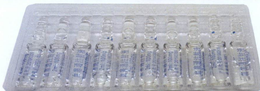
Xuesaitong Zhusheye 2ml:100mg

by: Yunnan Phyto Pharmaceutical Co., Ltd.