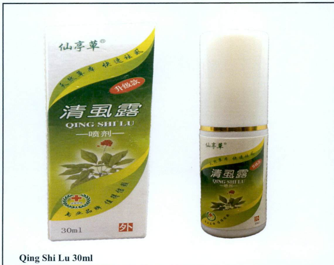
Qing Shi Lu 30ml

Pinapayuhan ng Food and Drug Administration (FDA) ang publiko laban sa pagbili at paggamit ng mga hindi rehistradong gamot na: