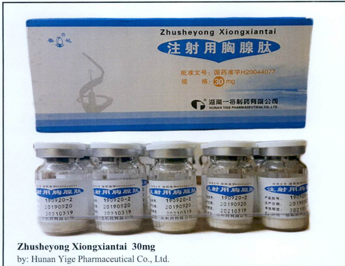
Larawan 4. Hindi rehistradong gamot

Napatunayan sa pamamagitan ng isinagawang Post-Marketing Surveillance (PMS) ng FDA na ang mga nasabing gamot ay hindi dumaan sa proseso ng rehistrasyon ng Ahensya at hindi nabigyan ng kaukulang awtorisasyon tulad ng Certificate of Product Registration (CPR). Dahil dito, hindi masisiguro ng Ahensya ang kalidad, kaligtasan at bisa nito. Samakatuwid, ang paggamit ng nasabing mga iligal na produkto ay maaaring magdulot ng panganib sa kalusugan.