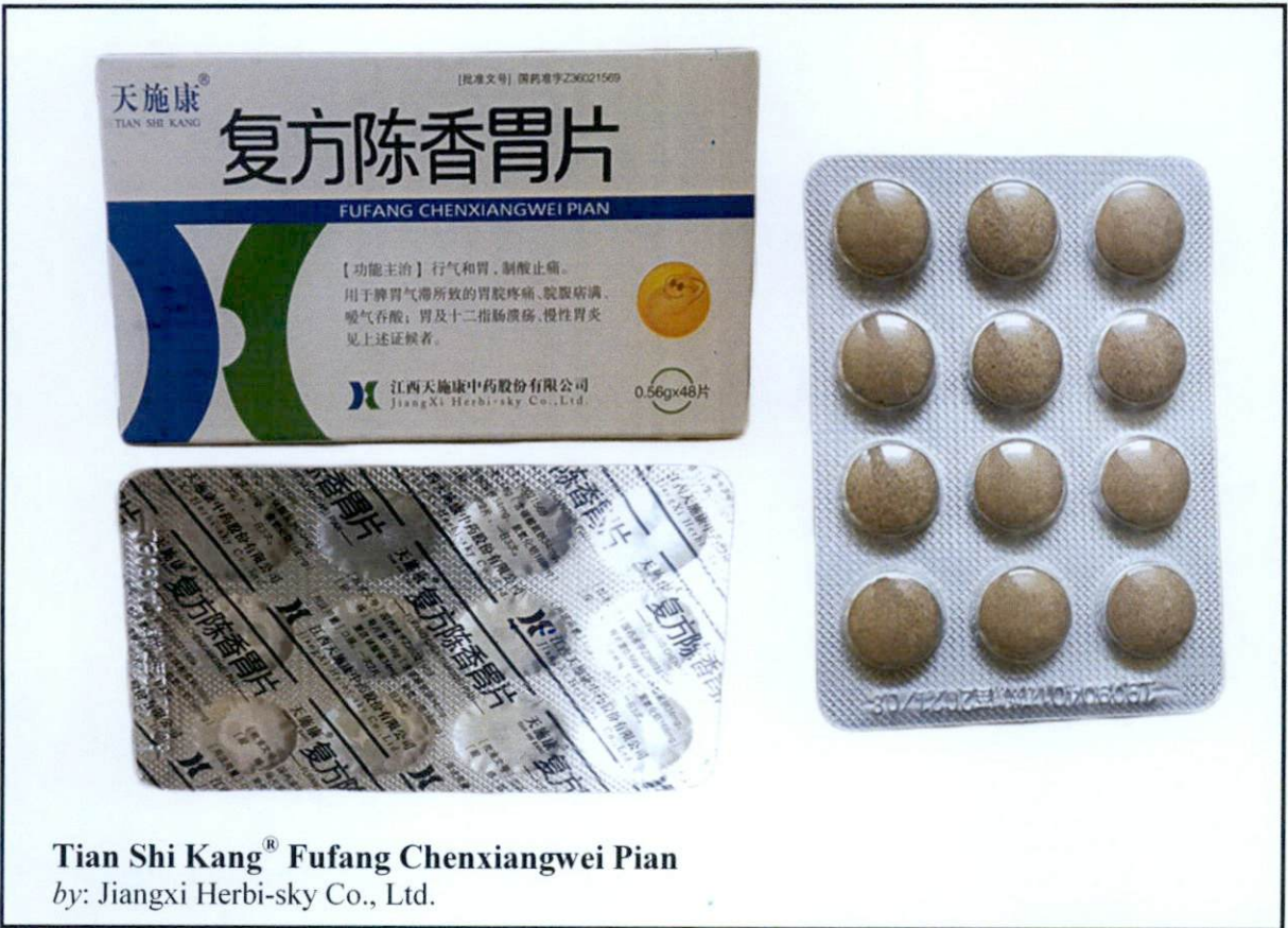
Tian Shi Kang® Fufang Chenxiangwei Pian by: Jiangxi Herbi-sky Co., Ltd.