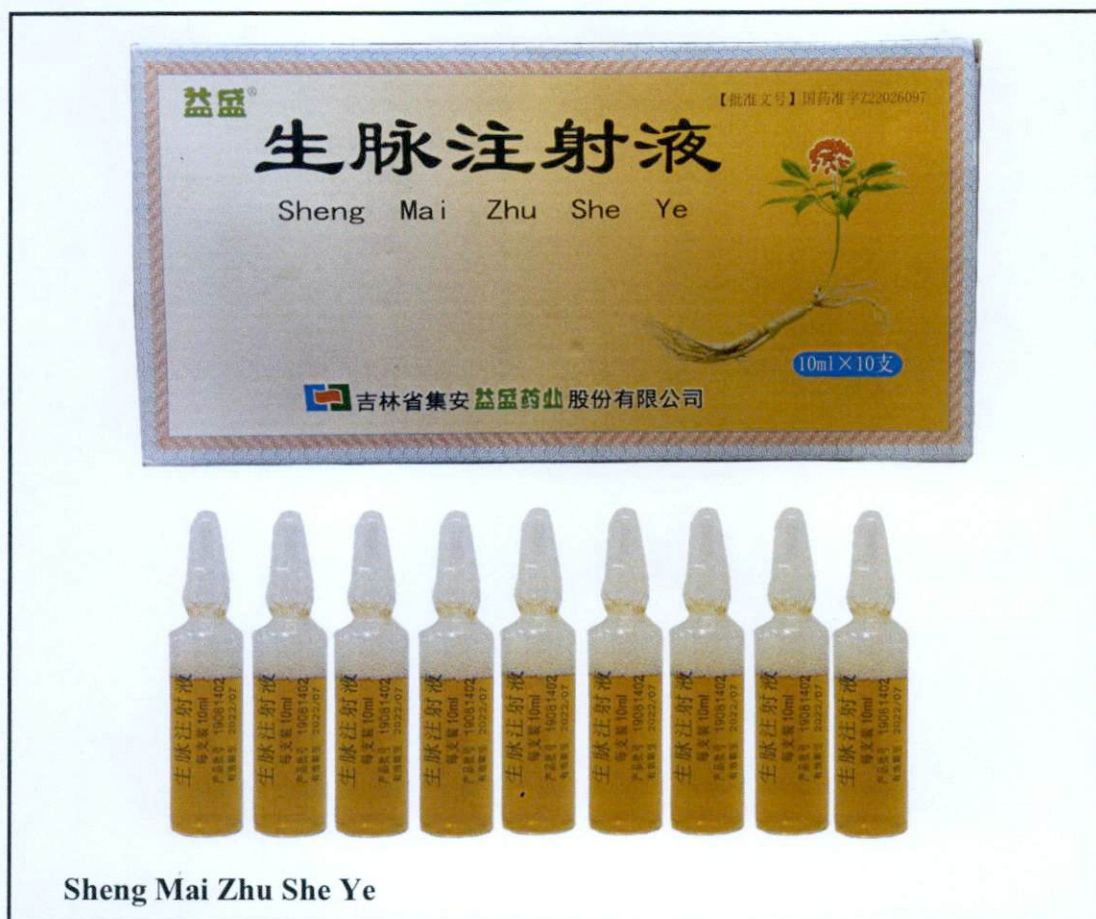
Sheng Mai Zhu She Ye

Pinapayuhan ng Food and Drug Administration (FDA) ang publiko laban sa pagbili at paggamit ng mga hindi rehistradong gamot na: