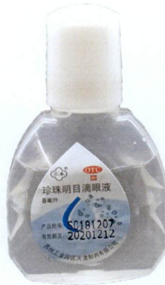
OTC Zhenzhu Mingmu Diyanye (as reflected in the package insert)