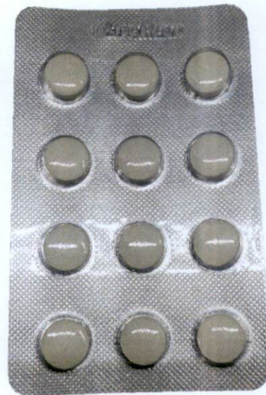
Flavoxate Hydrochloride Tablets 0.2g by: Neptunus