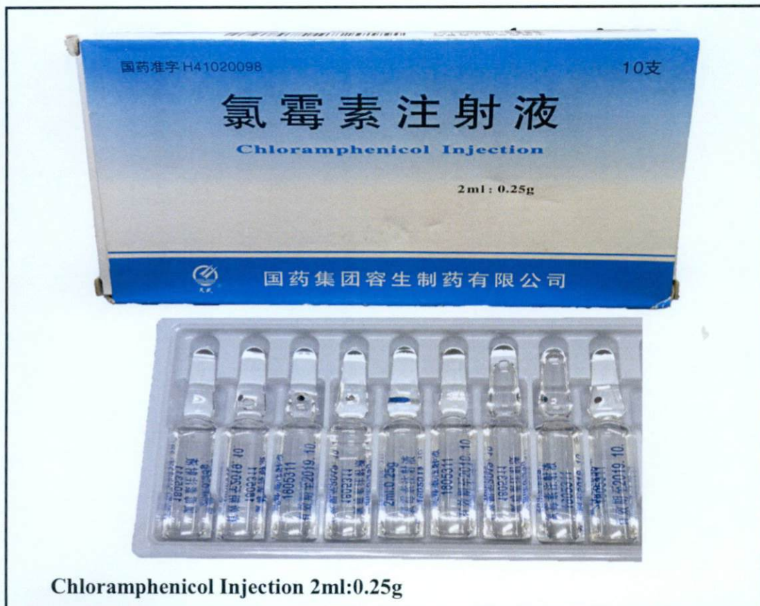
Chloramphenicol Injection 2ml:0.25g

Pinapayuhan ng Food and Drug Administration (FDA) ang publiko laban sa pagbili at paggamit ng mga hindi rehistradong gamot na: