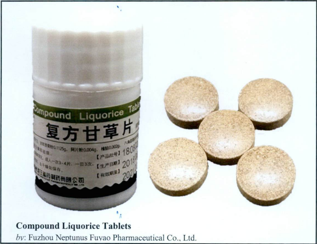
Larawan 5. Hindi rehistradong gamot