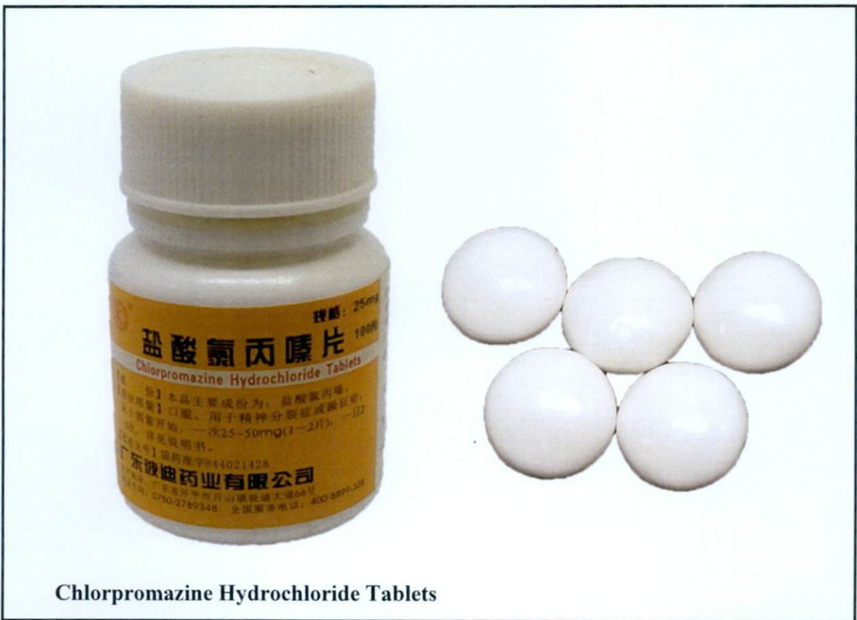
Chlorpromazine Hydrochloride Tablets