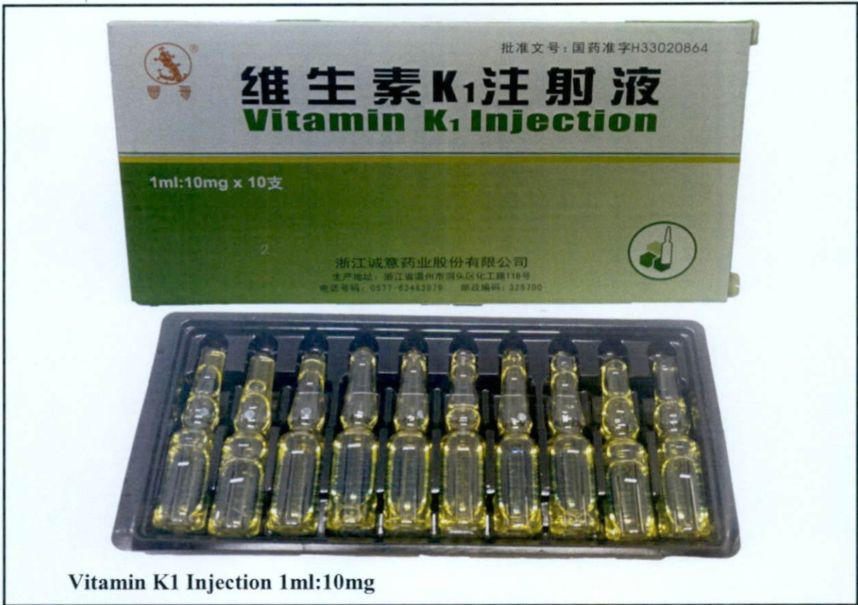
Vitamin K1 Injection 1ml:10mg