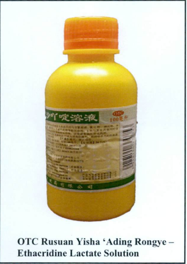
OTC Rusuan Yisha 'Ading Rongye – Ethacridine Lactate Solution