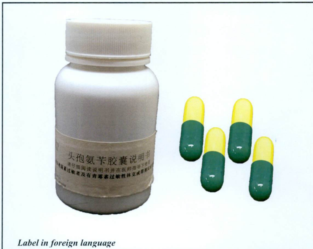
Label in foreign language

Pinapayuhan ng Food and Drug Administration (FDA) ang publiko laban sa pagbili at paggamit ng mga hindi rehistradong gamot na: