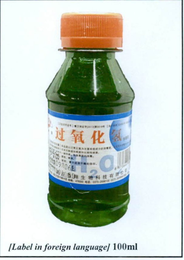
[Label in foreign language] 100ml