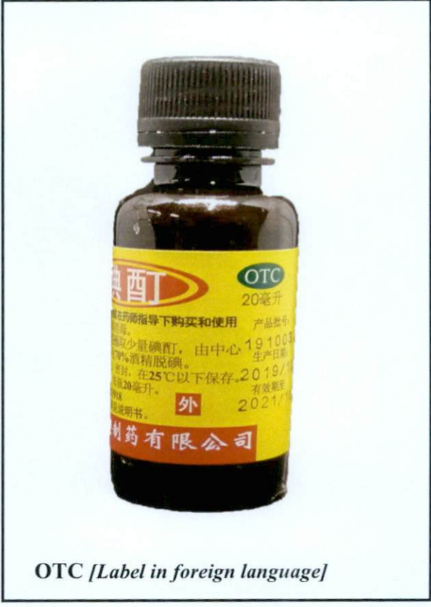
OTC [Label in foreign language]