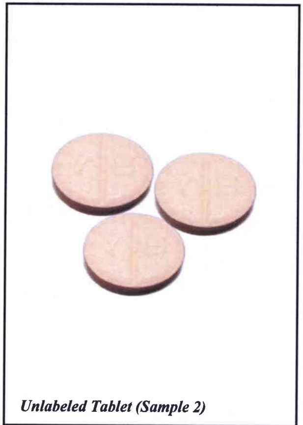
Unlabeled Tablet (Sample 2)