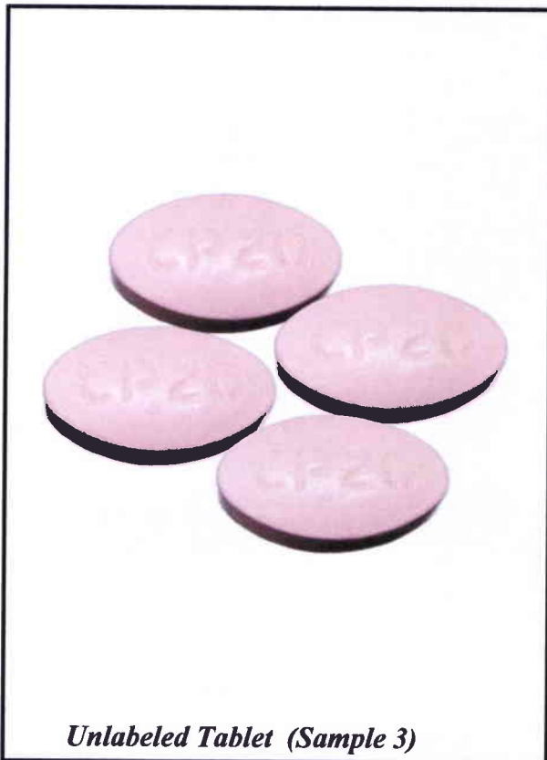
Unlabeled Tablet (Sample 3)