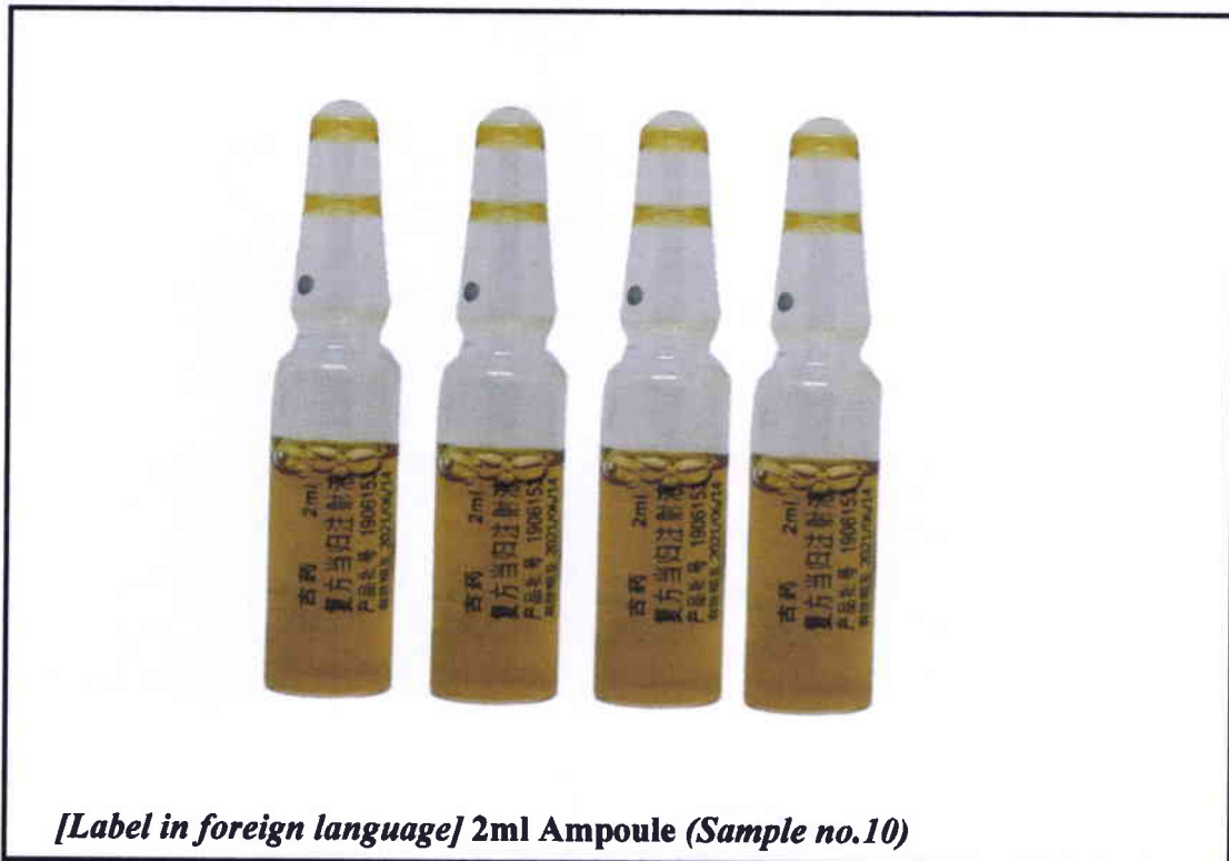
[Label in foreign language] 2ml Ampoule (Sample no.10)

Pinapayuhan ng Food and Drug Administration (FDA) ang publiko laban sa pagbili at paggamit ng mga hindi rehistradong gamot na: