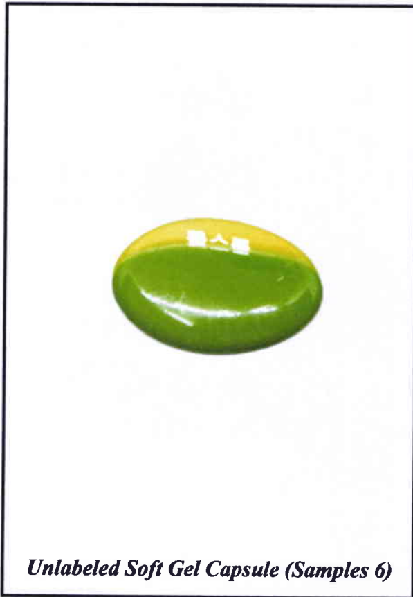
Larawan 2. Hindi rehiistradong gamot