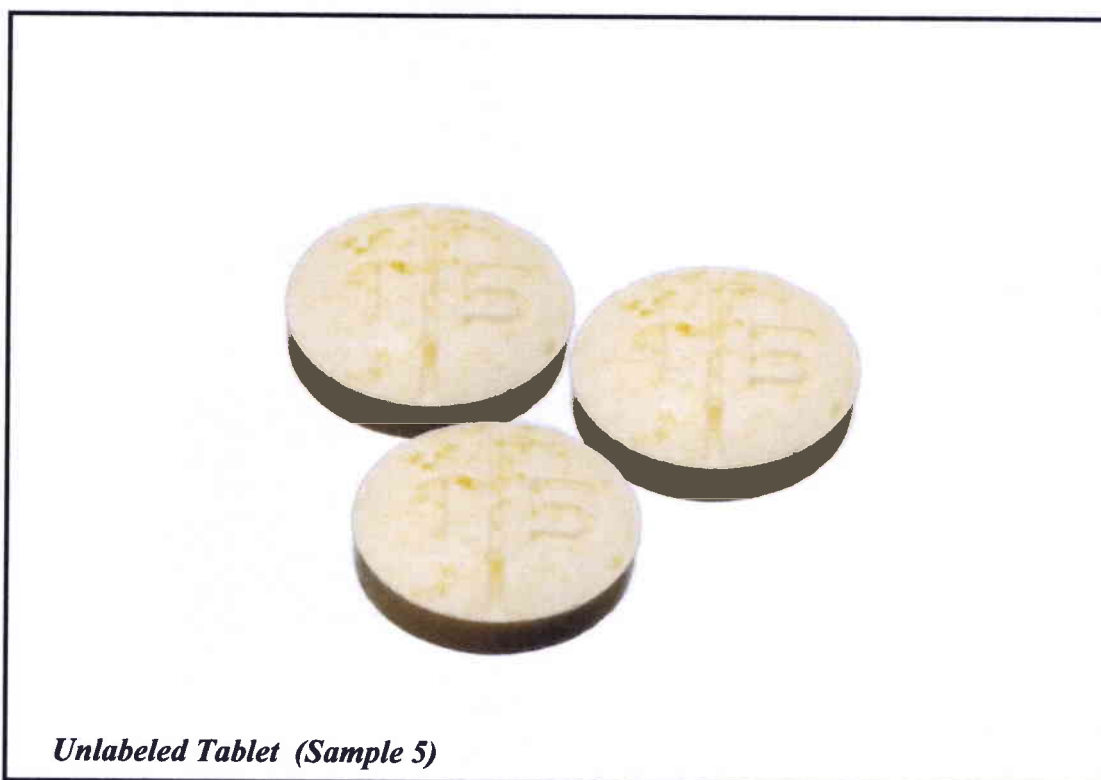
Unlabeled Tablet (Sample 5)

Pinapayuhan ng Food and Drug Administration (FDA) ang publiko laban sa pagbili at paggamit ng mga hindi rehistradong gamot na