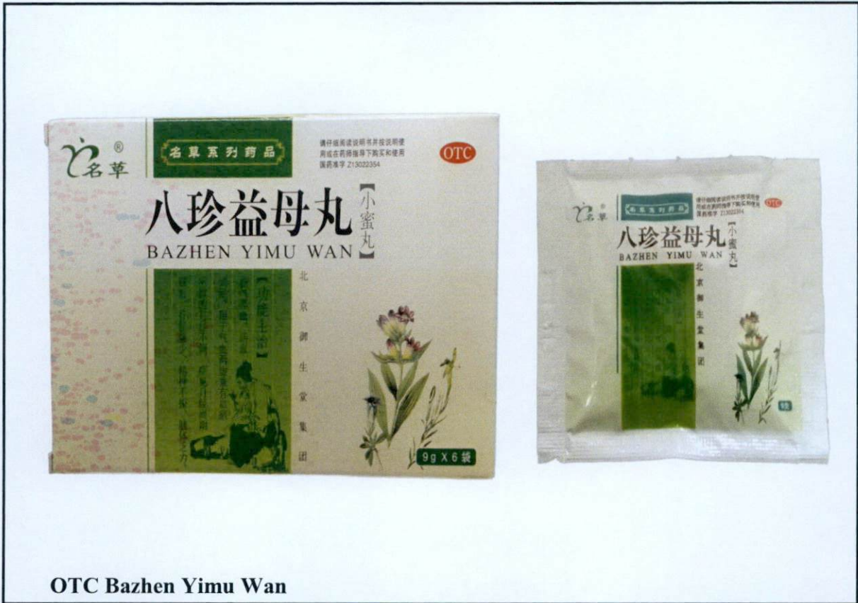
OTC Bazhen Yimu Wan