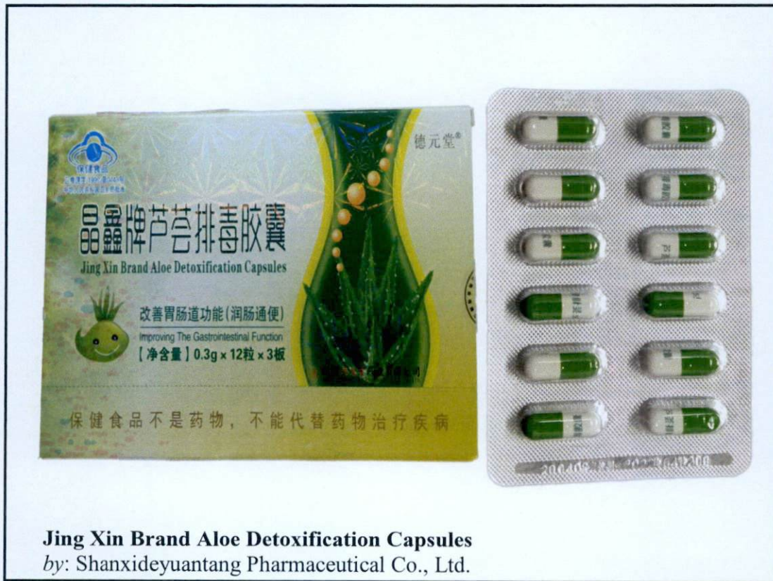
Jing Xin Brand Aloe Detoxification Capsules by: Shanxideyuantang Pharmaceutical Co., Ltd.

Pinapayuhan ng Food and Drug Administration (FDA) ang publiko laban sa pagbili at paggamit ng mga hindi rehistradong gamot na: