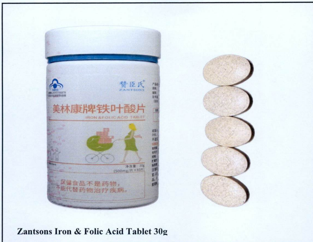
Zantsons Iron & Folic Acid Tablet 30g