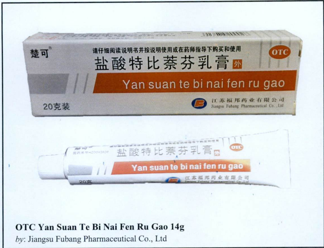
OTC Yan Suan Te Bi Nai Fen Ru Gao 14g by: Jiangsu Fubang Pharmaceutical Co., Ltd