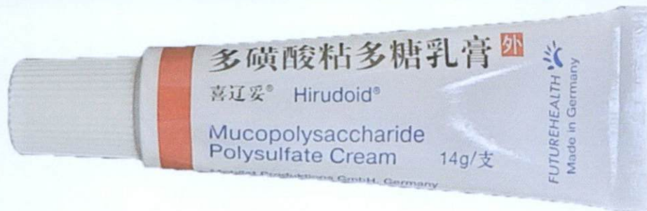
Futurehealth Hirudoid® Mucopolysaccharide Polysulfate Cream 14g by: Mobilat Produktions GmbH - Luitpoldstraße 1 85276 Pfaffenhofen/Ilm Germany