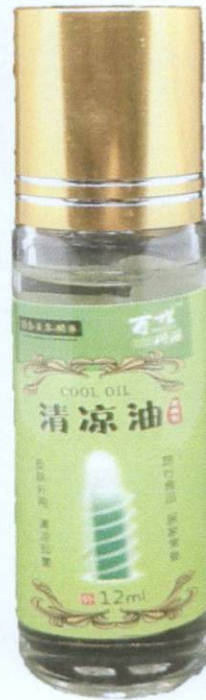
Baishi Tong Yuan Cool Oil 12mL by: Jiangxi Jieyuan Industrial Co., Ltd.