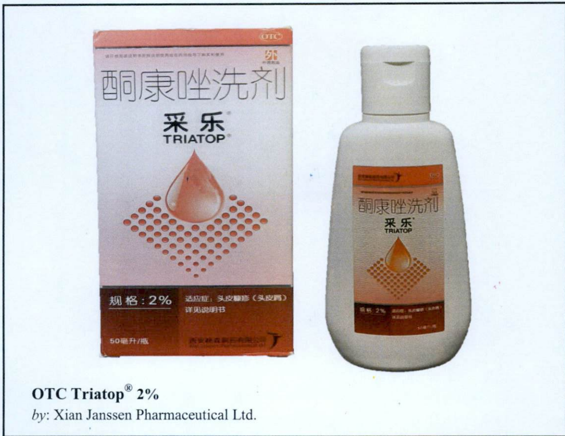
OTC Triatop ® 2% by: Xian Janssen Pharmaceutical Ltd.