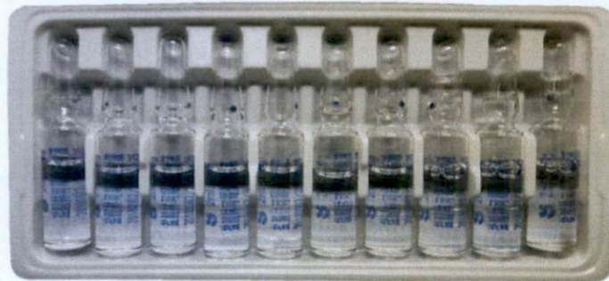
Succhi® Lincomycin Hydrochloride Injection 2ml:0.6g by: Succhi Shiqi Pharmaceutical Co., Ltd.