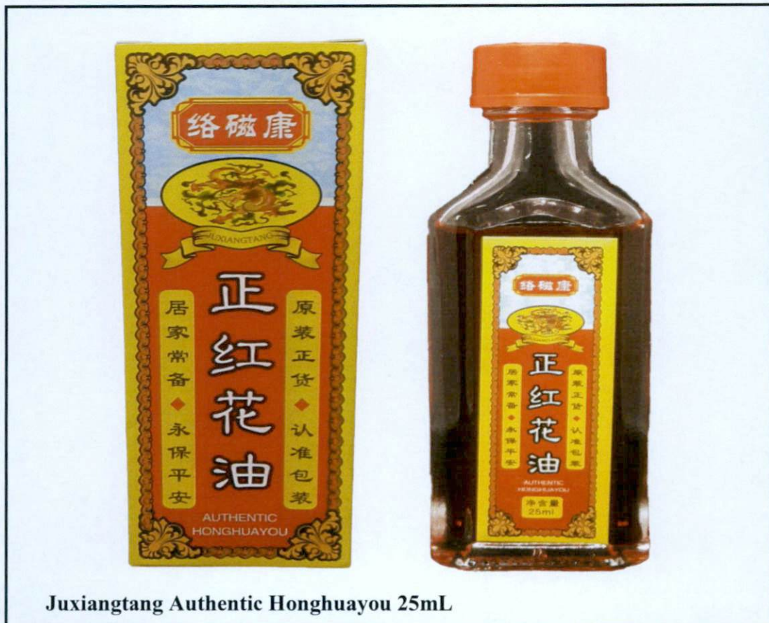
Juxiangtang Authentic Honghuayou 25mL

Pinapayuhan ng Food and Drug Administration (FDA) ang publiko laban sa pagbili at paggamit ng mga hindi rehistradong gamot na: