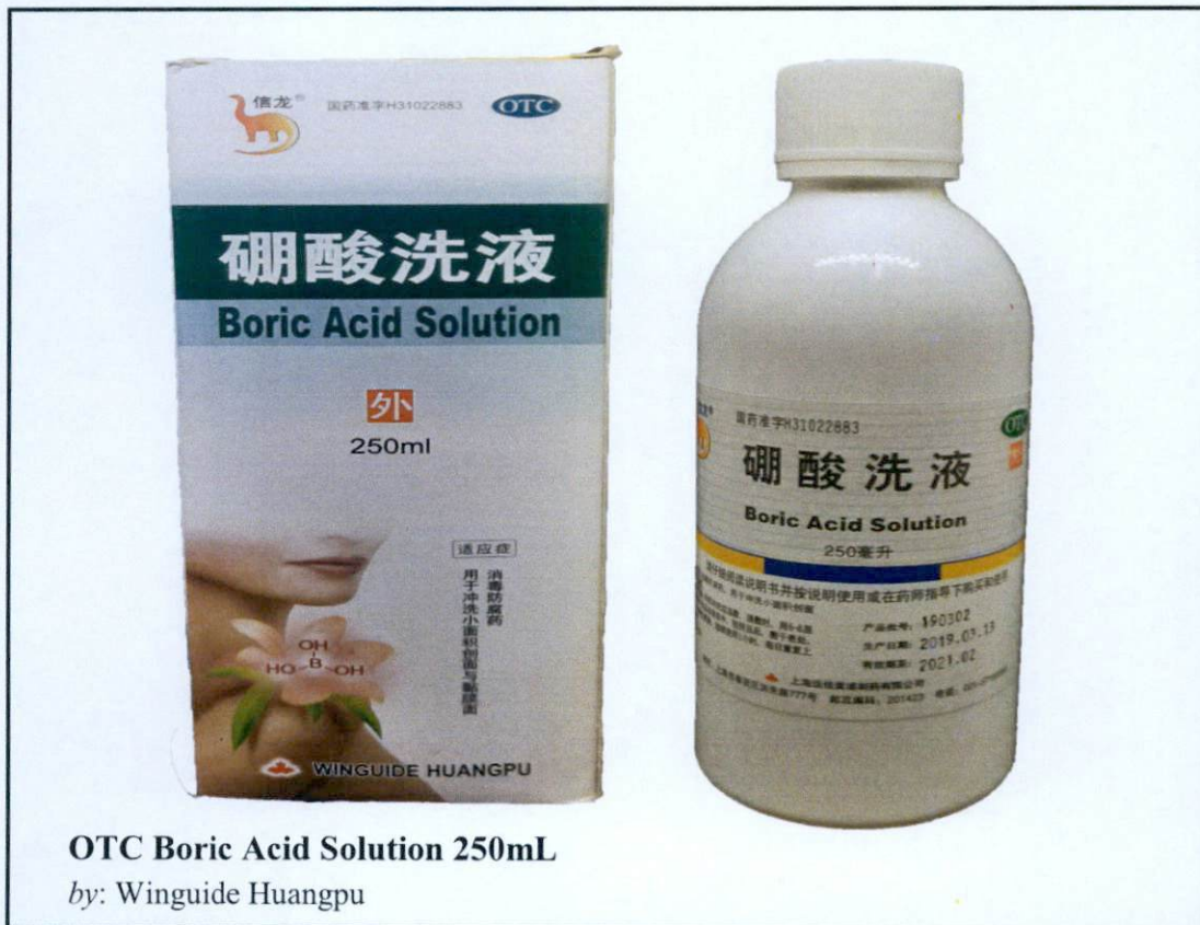
OTC Boric Acid Solution 250mL