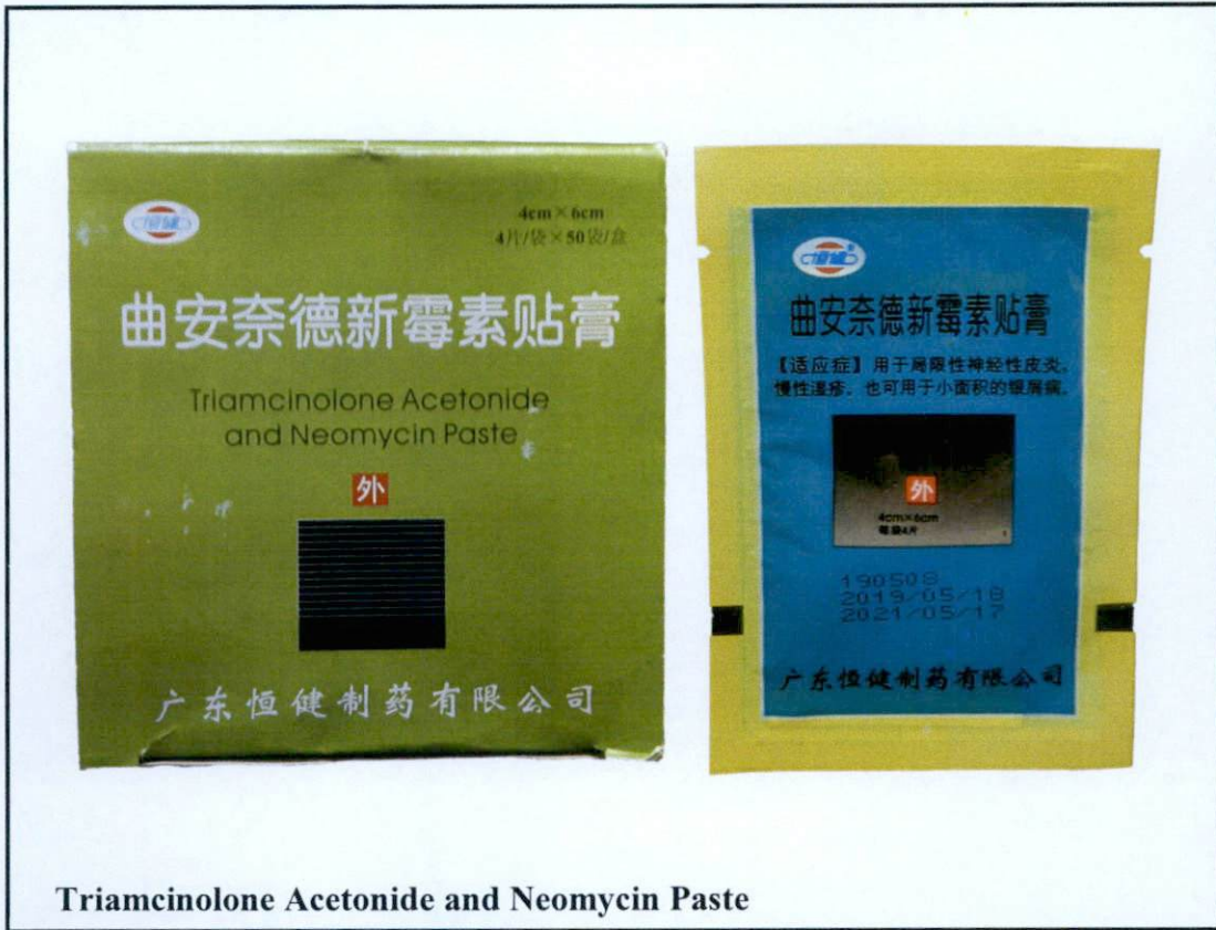
Triamcinolone Acetonide and Neomycin Paste