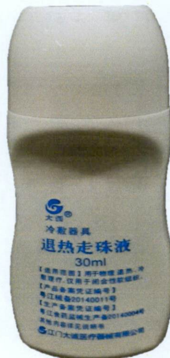
Tui Re Zou Zhu Ye 30mL by: Jiangmen Dacheng Medical Equipment Co., Ltd.