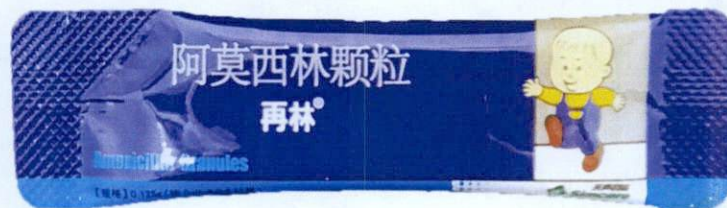
Sincere Amoxicillin Granules 0.125g