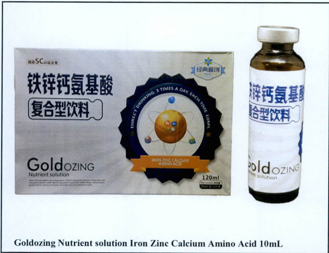
Goldozing Nutrient solution Iron Zinc Calcium Amino Acid 10mL