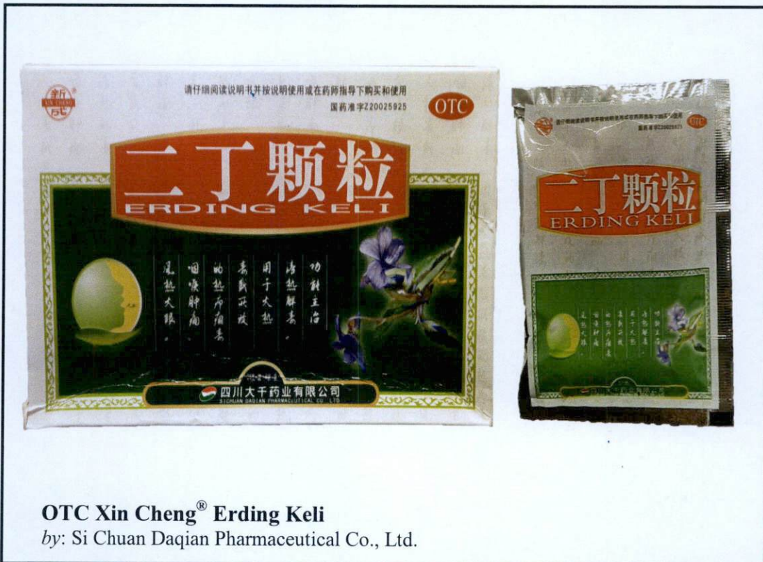
OTC Xin Cheng® Erding Keli by: Si Chuan Daqian Pharmaceutical Co., Ltd.

Pinapayuhan ng Food and Drug Administration (FDA) ang publiko laban sa pagbili at paggamit ng mga hindi rehistradong gamot na: