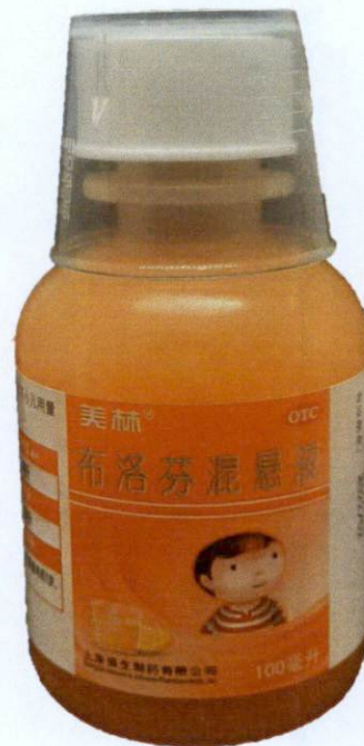
OTC Motrin® Ibuprofen Suspension 100mL- Buluofen Hunxuanye [as reflected in the package insert]