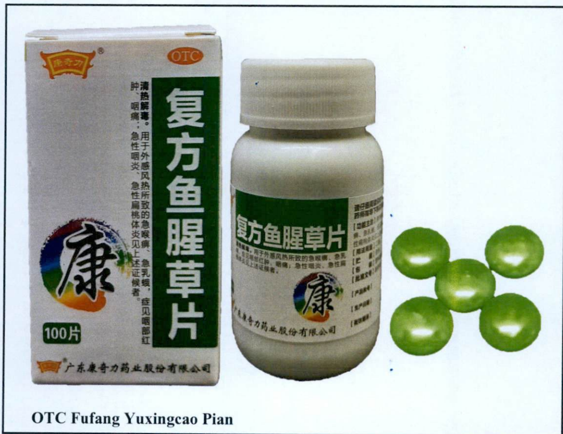
OTC Fufang Yuxingcao Pian