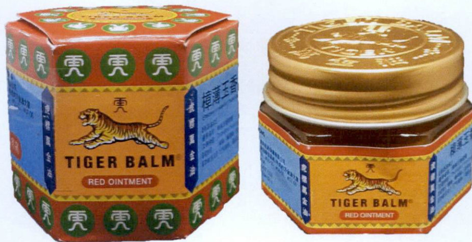
Tiger Balm® Red Ointment