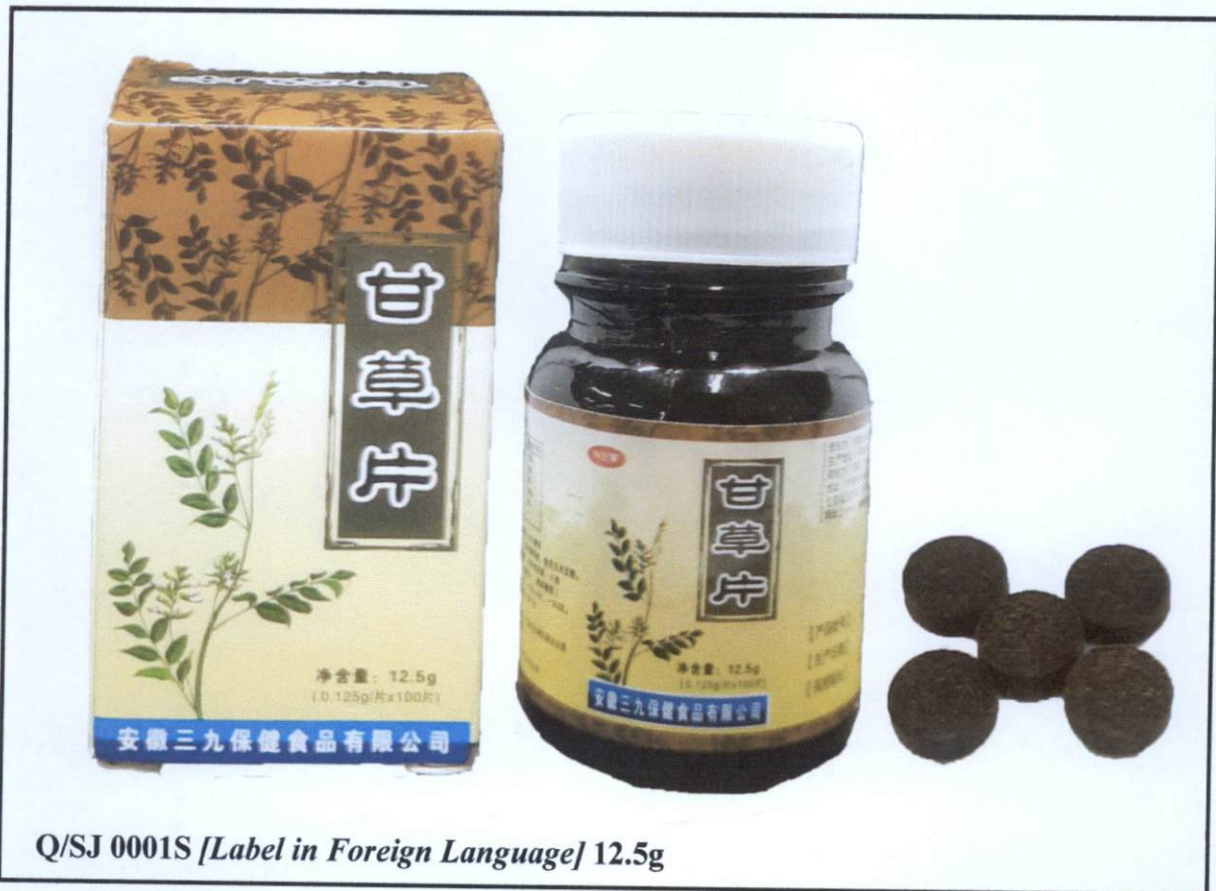
Larawan 3. Hindi rehistradong gamot