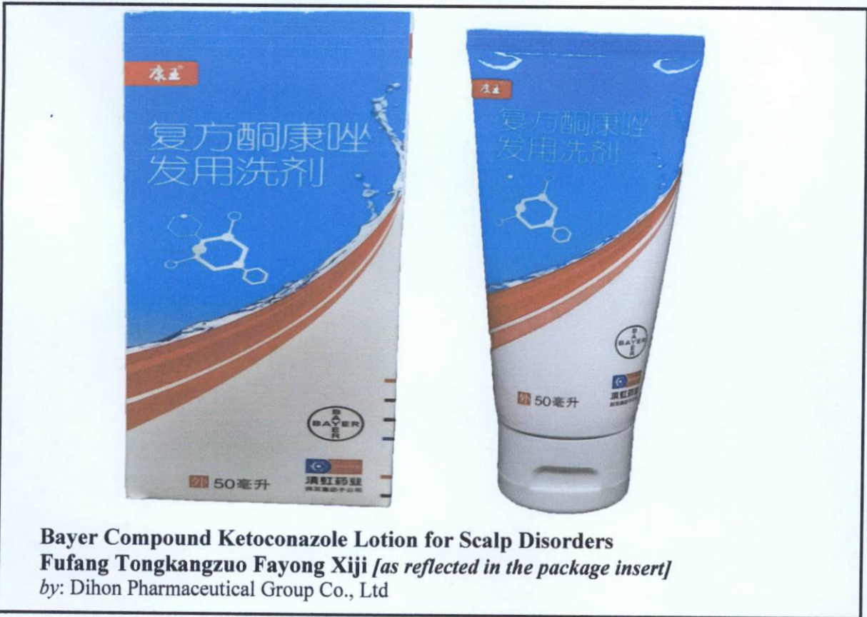
Larawan 2. Hindi rehistradong gamot