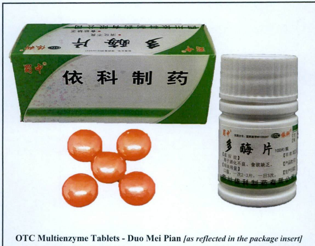
OTC Multienzyme Tablets - Duo Mei Pian [as reflected in the package insert]

Pinapayuhan ng Food and Drug Administration (FDA) ang publiko laban sa pagbili at paggamit ng mga hindi rehistradong gamot na: