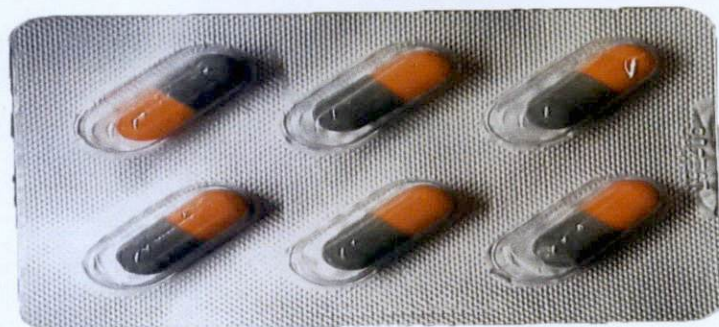
Luo Hong Mei Su Jiao Nang 150mg by: Jiangsu Fubang Pharmaceutical Co., Ltd