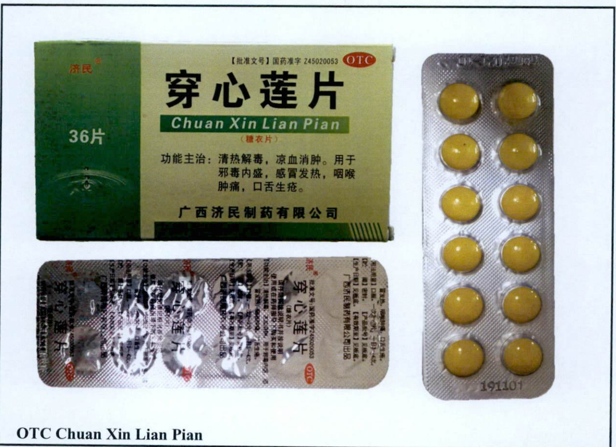
Larawan 3. Hindi rehistradong gamot