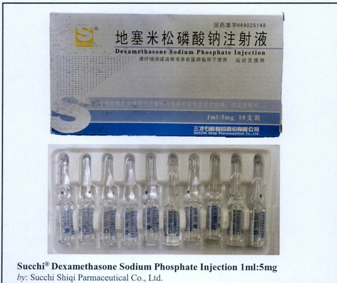
Succhi ® Dexamethasone Sodium Phosphate Injection 1ml:5mg by: Succhi Shiqi Parmaceutical Co., Ltd.

Pinapayuhan ng Food and Drug Administration (FDA) ang publiko laban sa pagbili at paggamit ng mga hindi rehistradong gamot na: