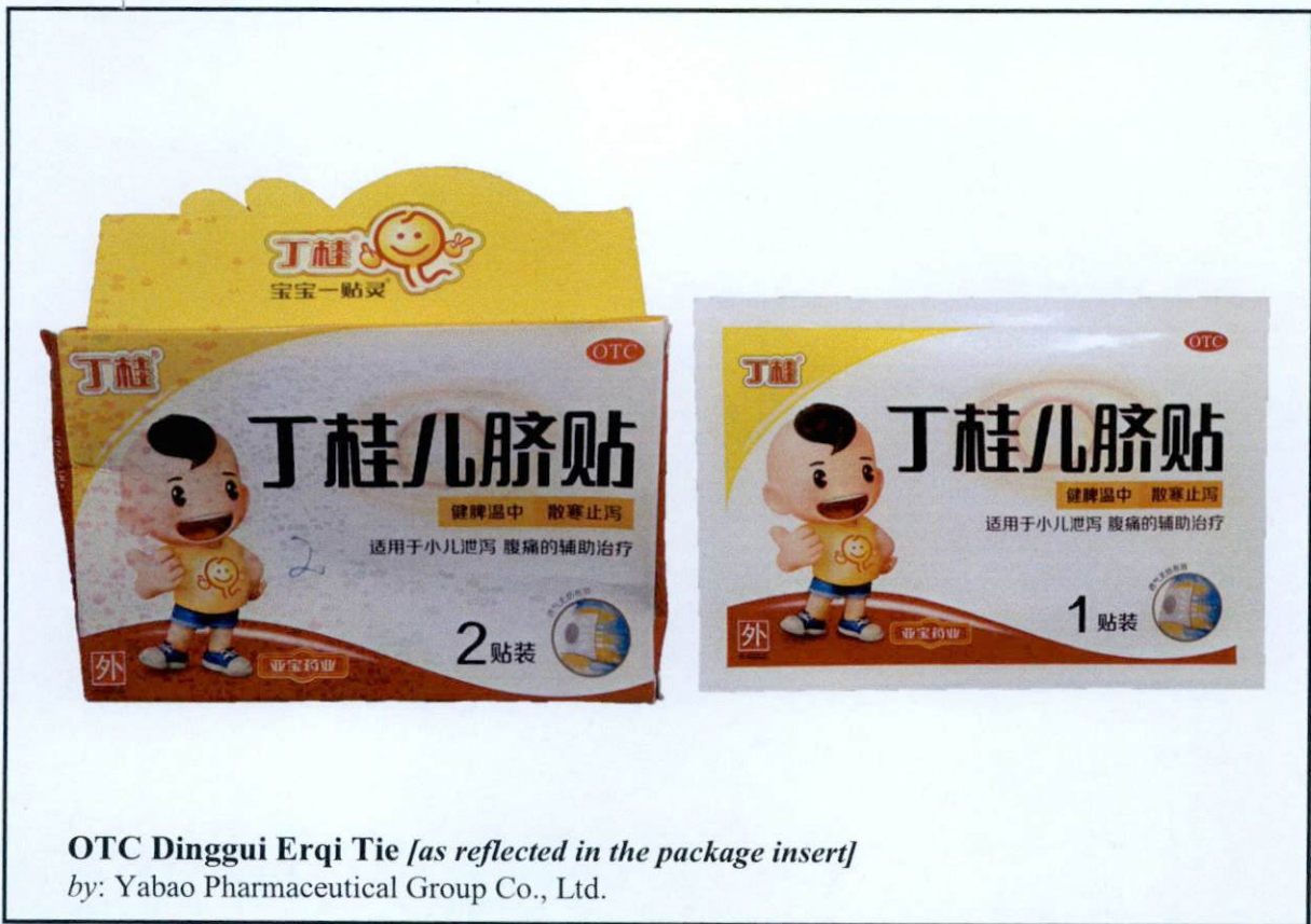
Larawan 2. Hindi rehistradong gamot