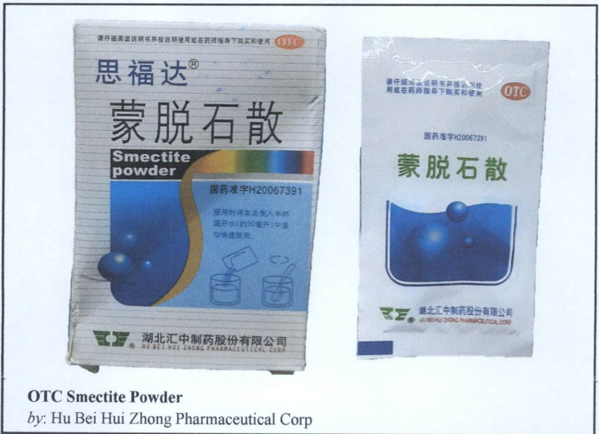
OTC Smectite Powder

by: Hu Bei Hui Zhong Pharmaceutical Corp