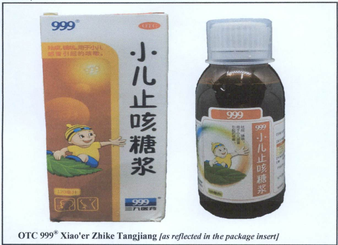
OTC 999 ® Xiao'er Zhike Tangjiang [as reflected in the package insert]