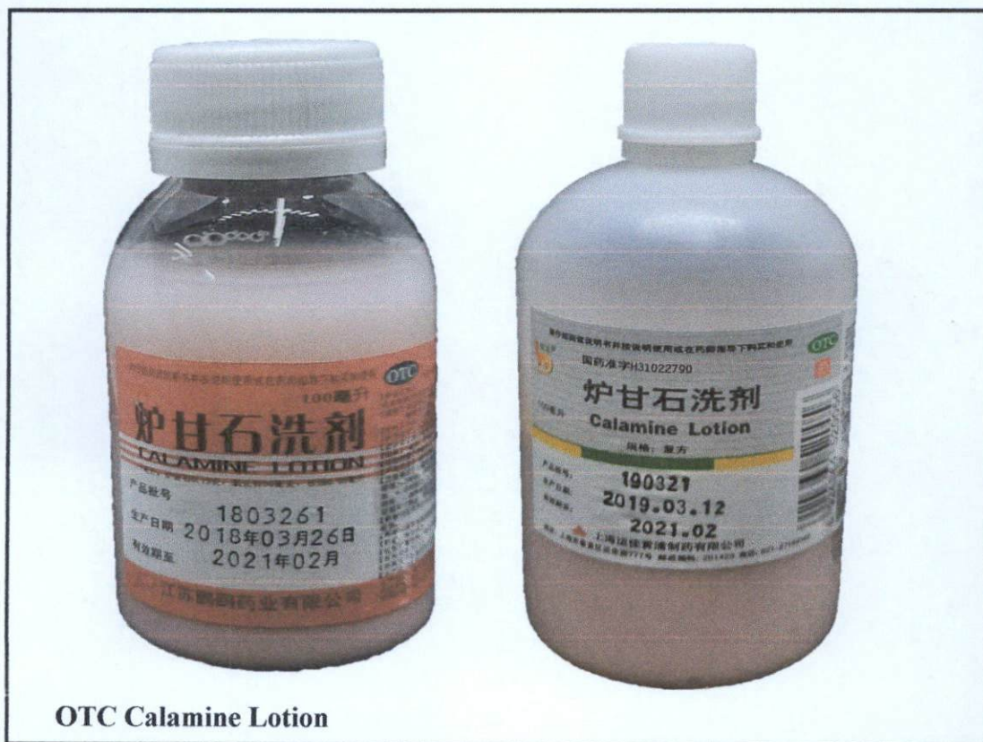
OTC Calamine Lotion

Pinapayuhan ng Food and Drug Administration (FDA) ang publiko laban sa pagbili at paggamit ng mga hindi rehistradong gamot na: