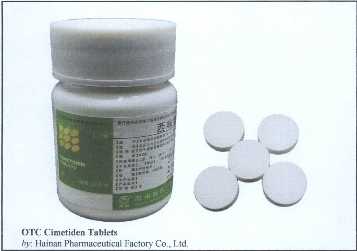
OTC Cimetiden Tablets by: Hainan Pharmaceutical Factory Co., Ltd.