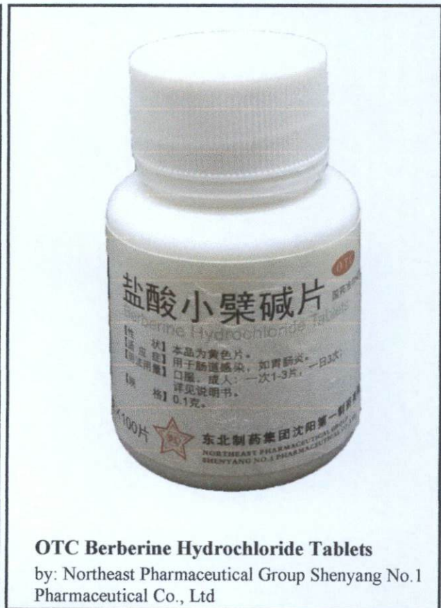
OTC Berberine Hydrochloride Tablets by: Northeast Pharmaceutical Group Shenyang No.1 Pharmaceutical Co., Ltd