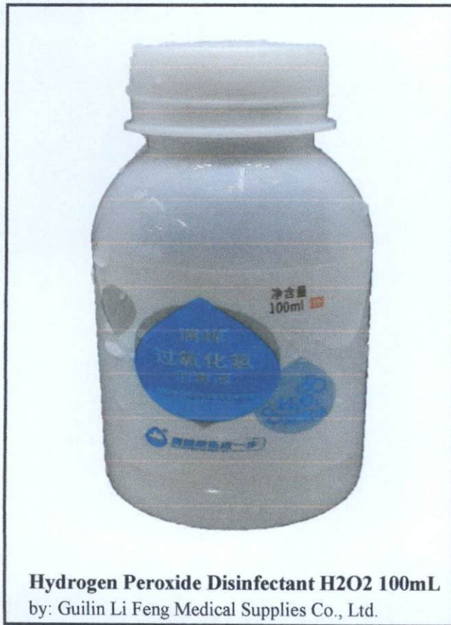
Hydrogen Peroxide Disinfectant H2O2 100mL by: Guilin Li Feng Medical Supplies Co., Ltd.