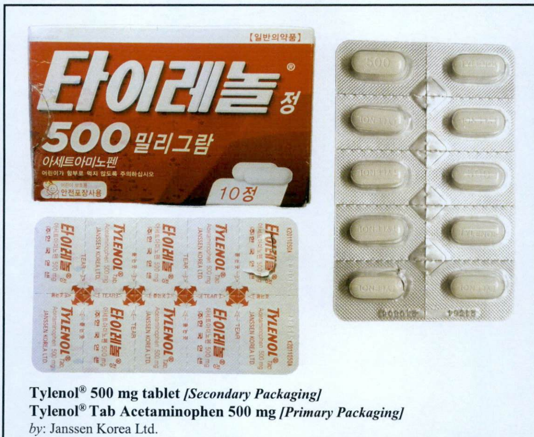
Tylenol® 500 mg tablet [Secondary Packaging] Tylenol® Tab Acetaminophen 500 mg [Primary Packaging] by: Janssen Korea Ltd.

Pinapayuhan ng Food and Drug Administration (FDA) ang publiko laban sa pagbili at paggamit ng mga hindi rehistradong gamot na: