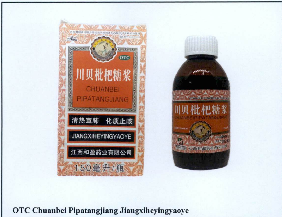
Larawan 4. Hindi rehistradong gamot

Napatunayan sa pamamagitan ng isinagawang Post-Marketing Surveillance (PMS) ng FDA na ang mga nasabing gamot ay hindi dumaaan sa proseso ng rehistrasyon ng Ahensya at hindi nabigyan ng kaukulang awtorisasyon tulad ng Certificate of Product Registration (CPR). Dahil dito, hindi masisiguro ng Ahensya ang kalidad, kaligtasan at bisa nito. Samakatuwid, ang paggamit ng nasabing mga ilegal na produkto ay maaaring magdulot ng panganib sa kalusugan.