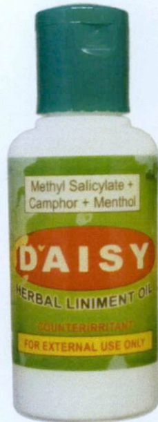
Methyl Salicylate + Camphor+Menthol (Daisy) Herbal Liniment Oil 60ml Manufactured by: AG Ansijar Marketing-Davao City