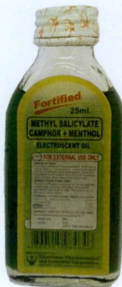
Fortified Methyl Salicylate+Camphor+Menthol (Electruscent) Oil 25ml Manufactured by:Ellestreque Pharmaceutical and Industrial Corporation Purok 9 Upper Catitipan, Communal, Buhangin, Davao City