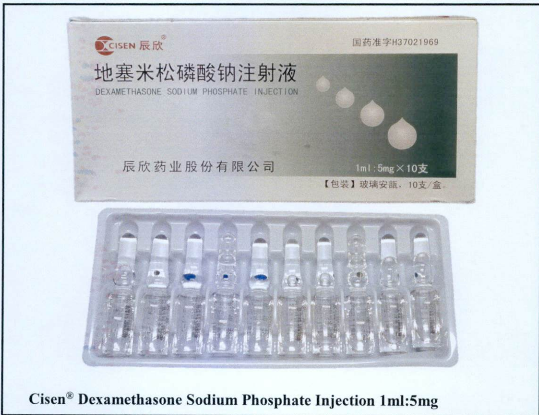
Cisen® Dexamethasone Sodium Phosphate Injection 1ml:5mg