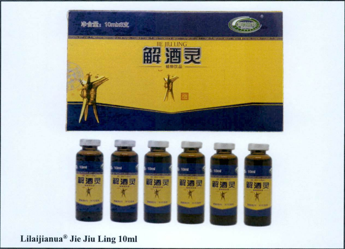
Lilaijianua® Jie Jiu Ling 10ml