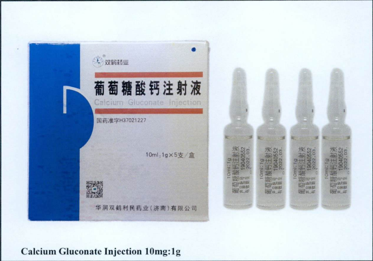
Calcium Gluconate Injection 10mg:1g