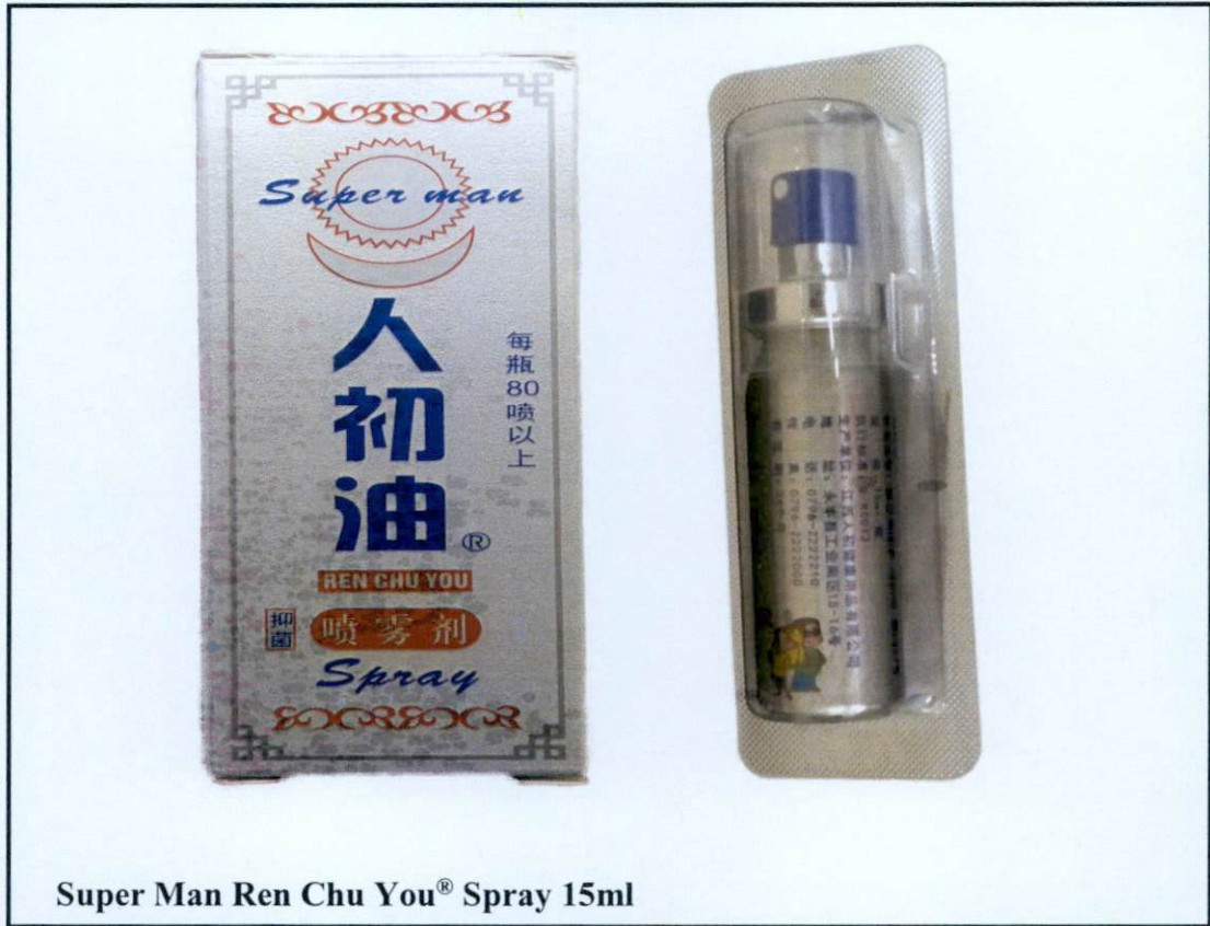
Super Man Ren Chu You® Spray 15ml