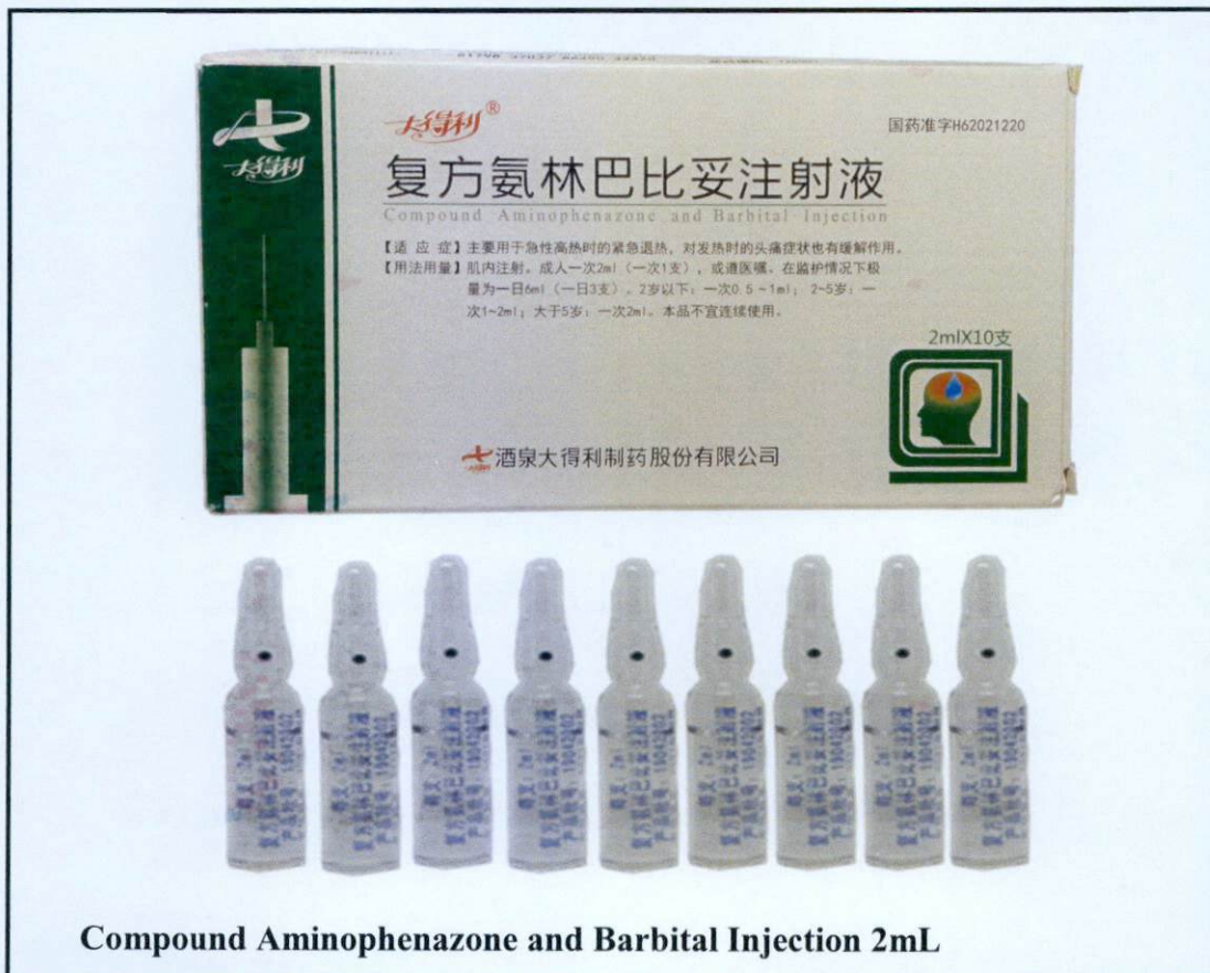
Compound Aminophenazone and Barbitol Injection 2mL

Pinapayuhan ng Food and Drug Administration (FDA) ang publiko laban sa pagbili at paggamit ng mga hindi rehiistradong gamot na: