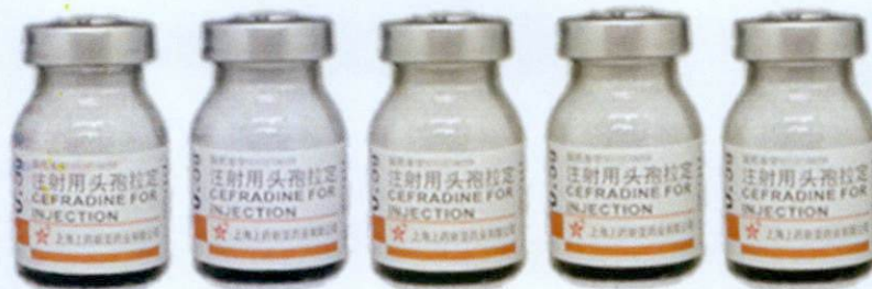
Cefradine For Injection 0.5g

by: Shanghai SPH NewAsia Pharmaceutical Co., Ltd.-No.978 Chuansha Road Pudong, Shanghai, China