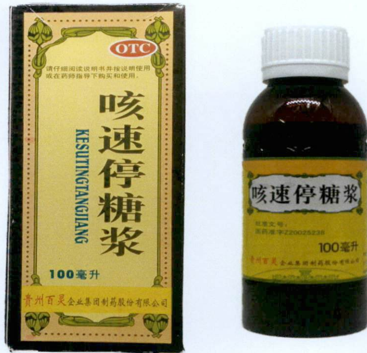
OTC Kesutingtangjiang 100ml