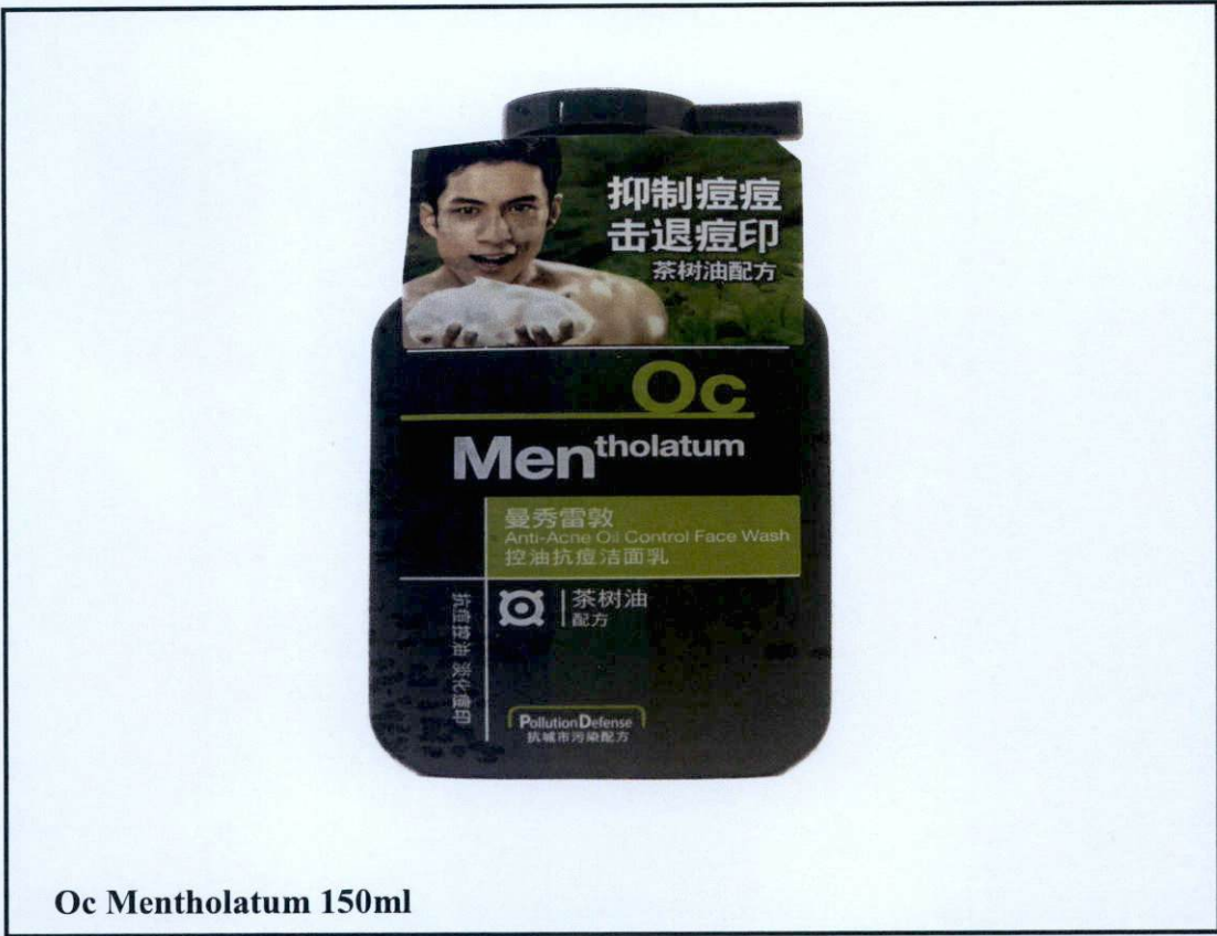
Oc Mentholatum 150ml