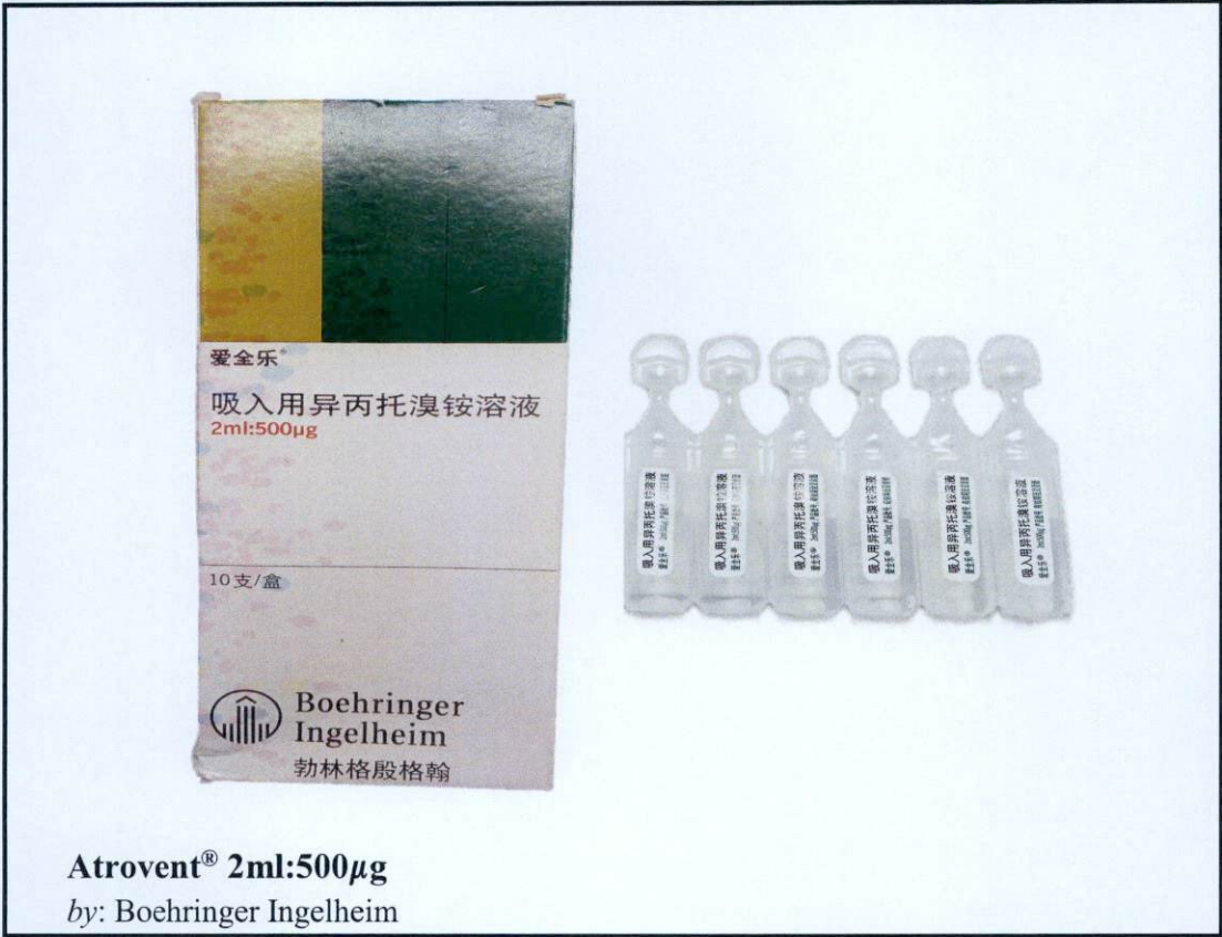
Atrovent® 2ml:500µg by: Boehringer Ingelheim