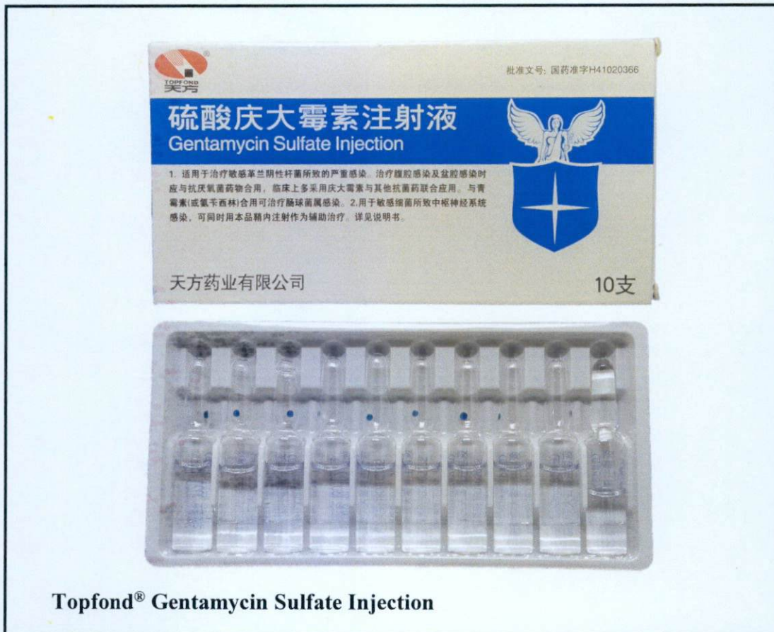
Topfond® Gentamycin Sulfate Injection

Pinapayuhan ng Food and Drug Administration (FDA) ang publiko laban sa pagbili at paggamit ng mga hindi rehistradong gamot na: