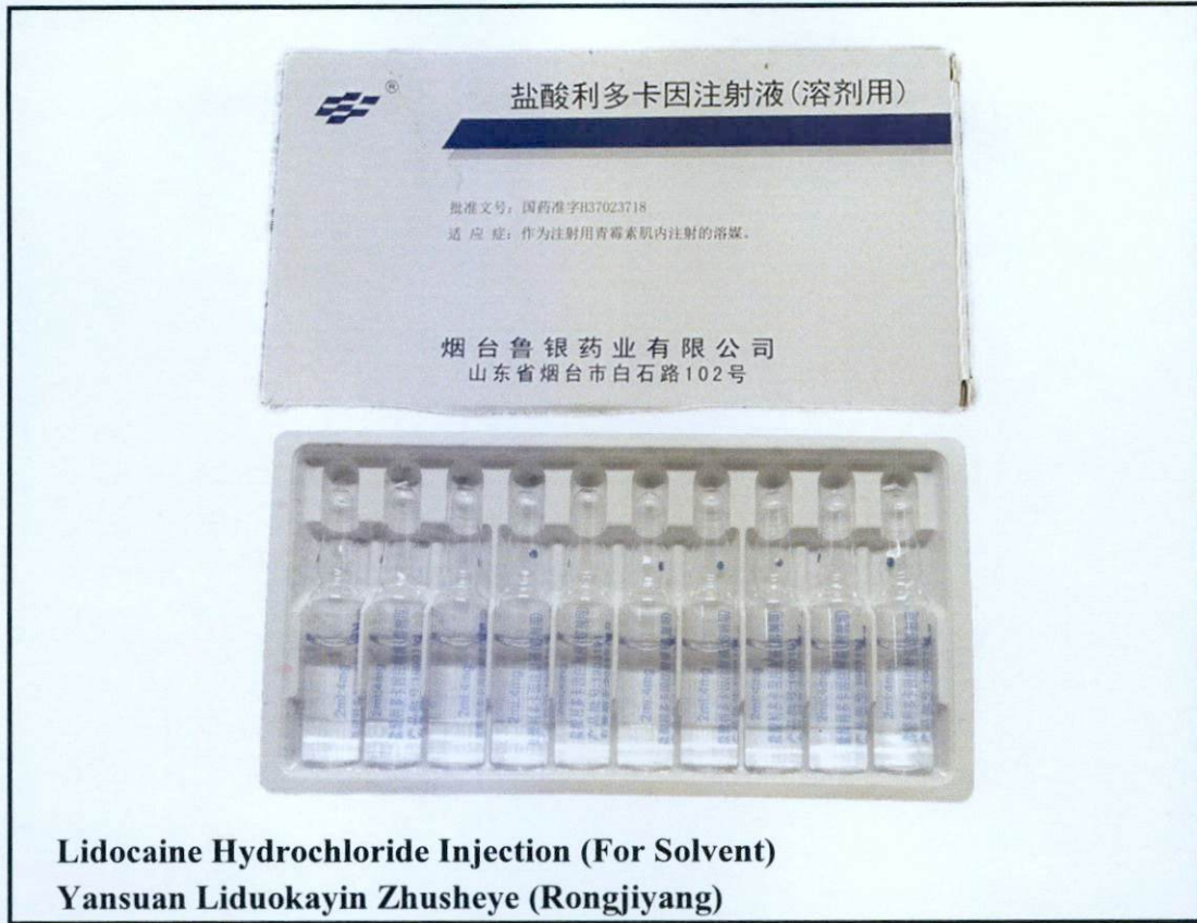
Larawan 4. Hindi rehistradong gamot