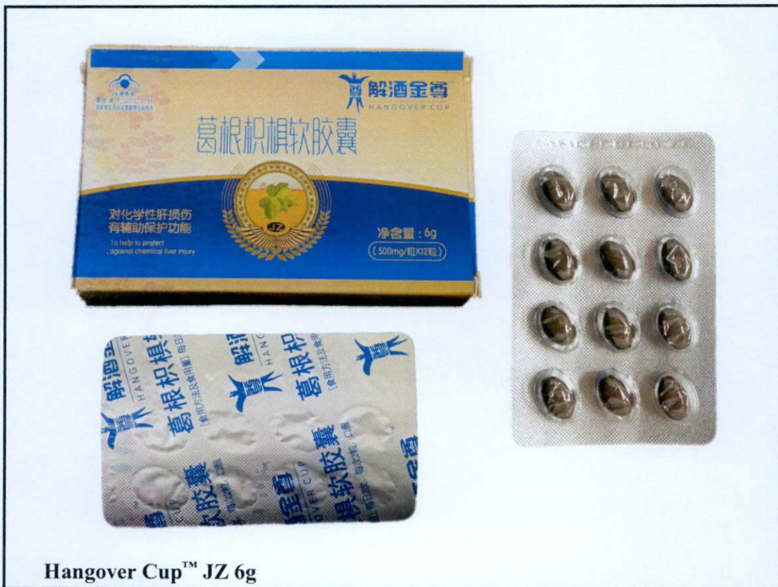
Larawan 5. Hindi rehistradong gamot