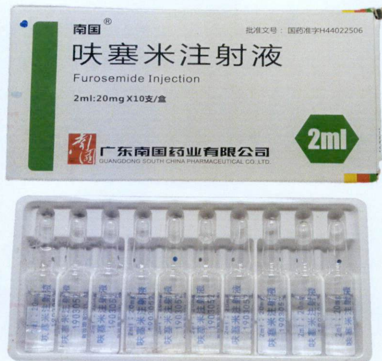
Furosemide Injection 2ml: 20mg by: Guangdong South China Pharmaceutical Co., Ltd.