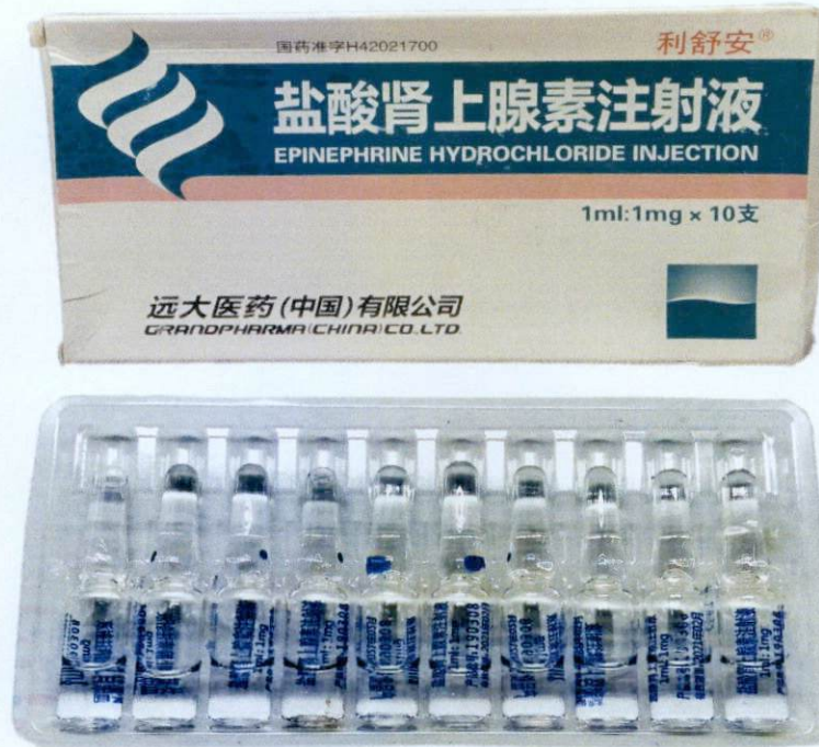
Epinephrine Hydrochloride Injection 1ml: 1mg by: GrandPharma (China) Co., Ltd.