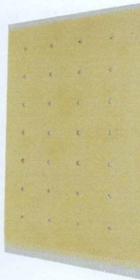
1-Ostealgia Plaster Far-Infrared Anti-inflammatory Analgesic Paste by: Anhui Province Dejitang Pharmaceutical Co., Ltd.