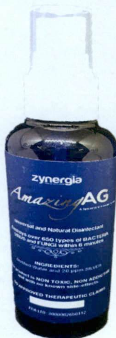
Larawan 2. Hindi rehistradong gamot

Distributed by: Zynergia Health and Wellness Corporation – No. 91 West Avenue, Brgy. Bungad, Quezon City, Philippines 1105