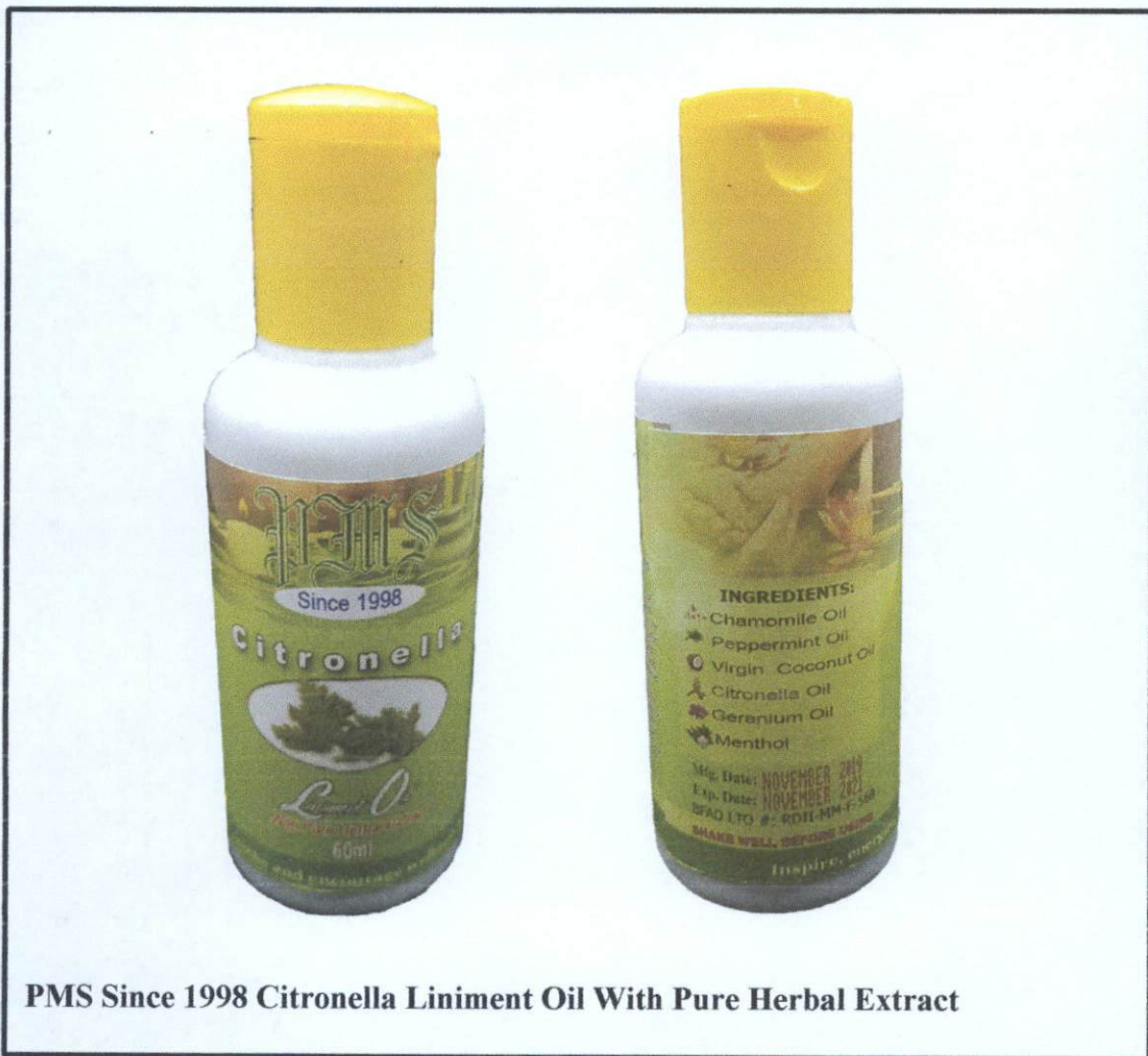
PMS Since 1998 Citronella Liniment Oil With Pure Herbal Extract