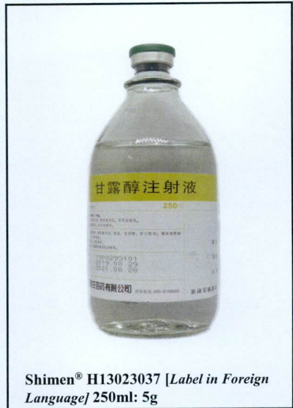
Shimen® H13023037 [Label in Foreign Language] 250ml: 5g