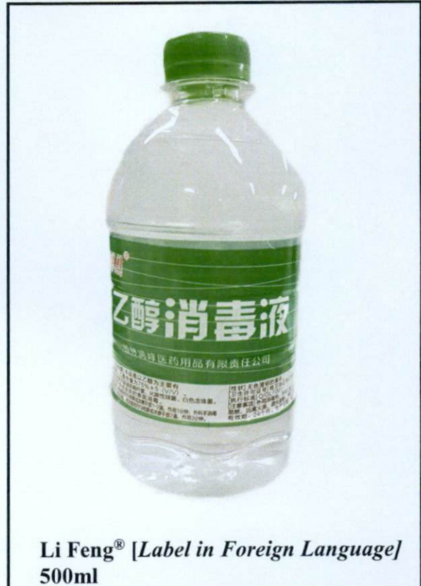
Li Feng® [Label in Foreign Language] 500ml