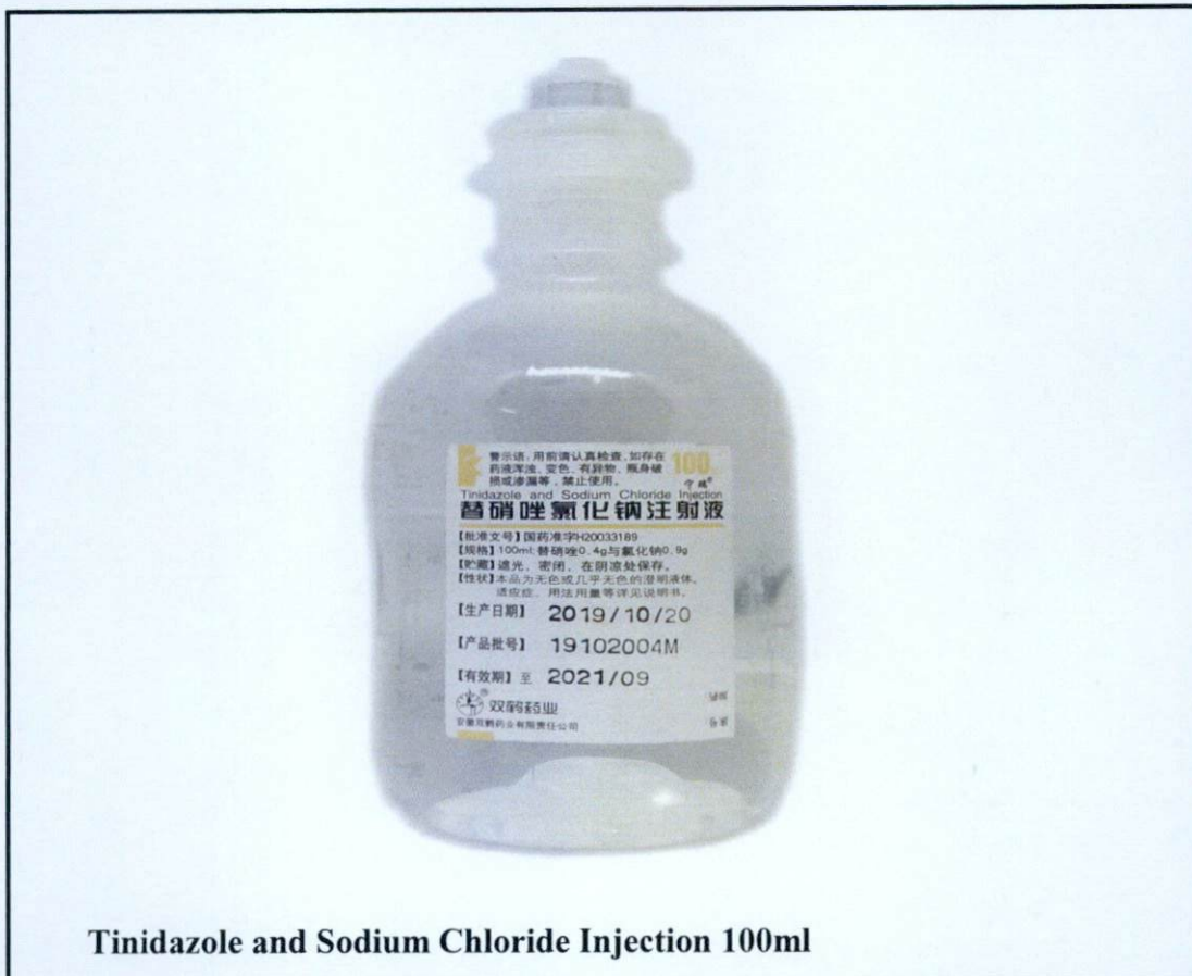
Tinidazole and Sodium Chloride Injection 100ml

Pinapayuhan ng Food and Drug Administration (FDA) ang publiko laban sa pagbili at paggamit ng mga hindi rehistradong gamot na: