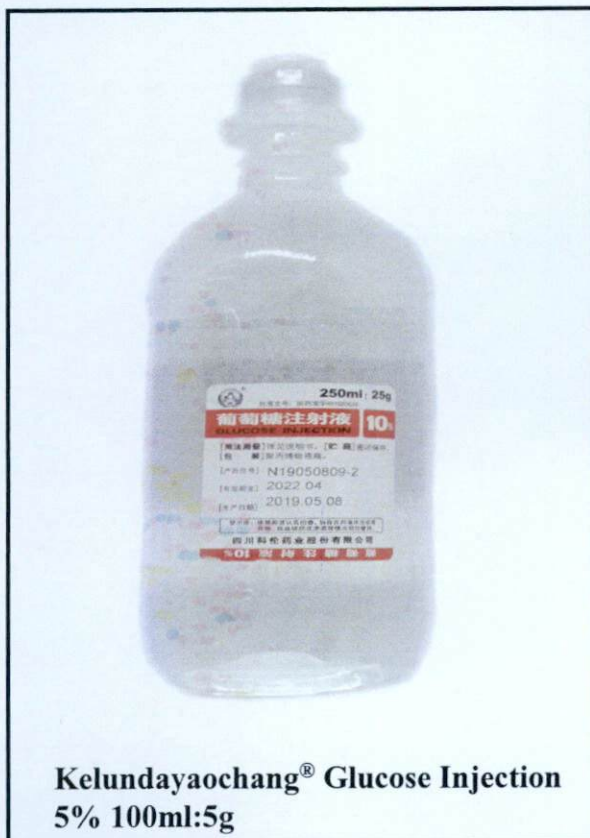
Kelundayaochang® Glucose Injection 5% 100ml:5g