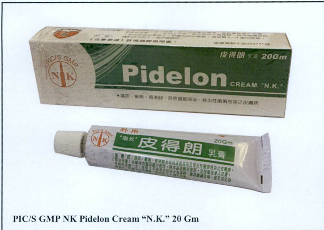
PIC/S GMP NK Pidelon Cream "N.K." 20 Gm