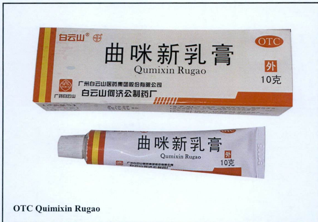
OTC Quimixin Rugao

Pinapayuhan ng Food and Drug Administration (FDA) ang publiko laban sa pagbili at paggamit ng mga hindi rehistradong gamot na: