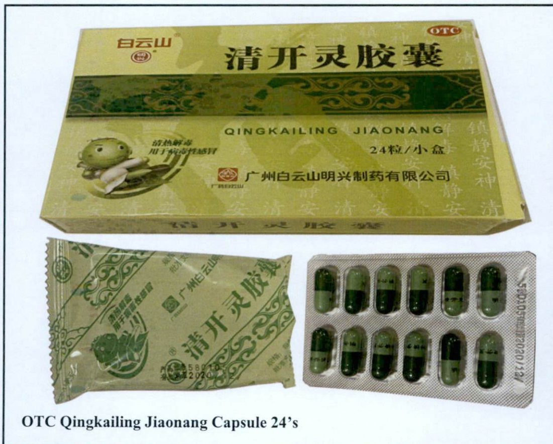
OTC Qingkailing Jiaonang Capsule 24's