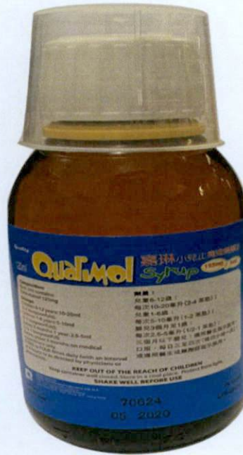
GMP Qualimol 125mg / 5 ml Syrup 120 ml

Manufactured by: Quality Pharmaceutical Laboratory Ltd. H.K.