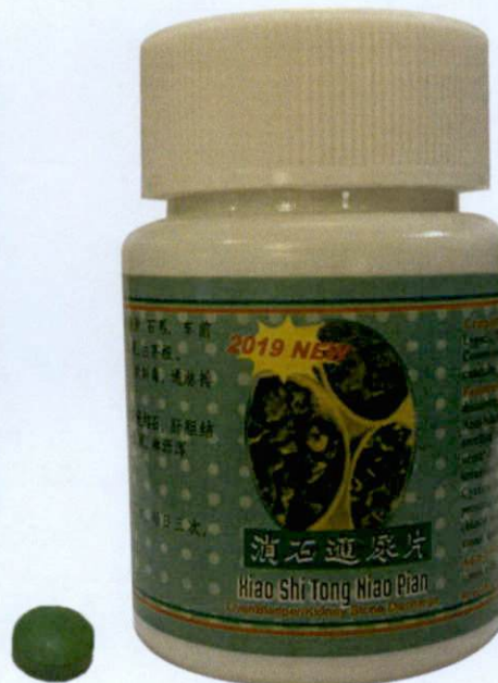
2019 NEW Xiao Shi Tong Niao Pian Tablets 100's

by: Hongkong An Kang Pharmaceutical Co., Ltd