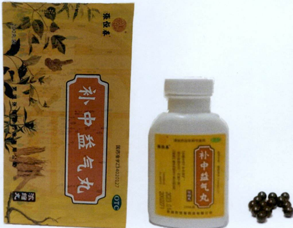
OTC Z34020127 [Label in Foreign Language]