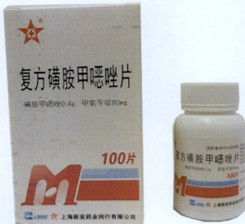
SPH H31020387 [Label in Foreign Language]