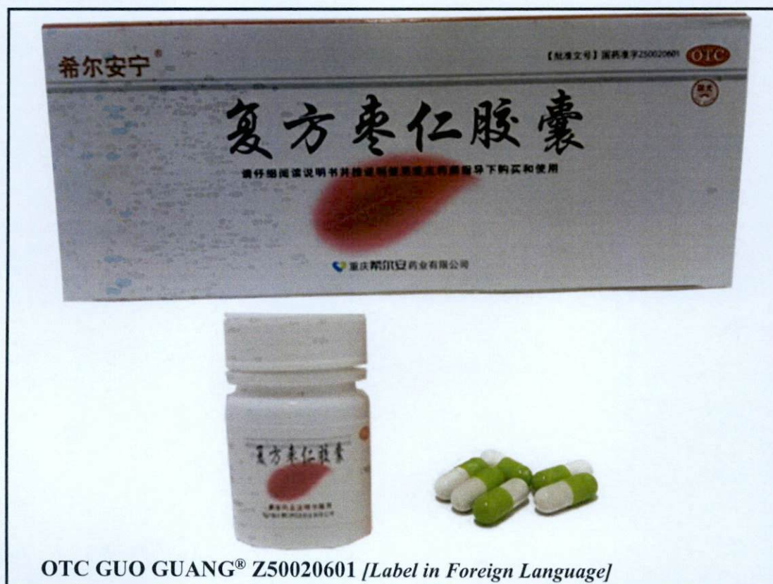
OTC GUO GUANG® Z50020601 [Label in Foreign Language]

Pinapayuhan ng Food and Drug Administration (FDA) ang publiko laban sa pagbili at paggamit ng mga hindi rehistradong gamot na: