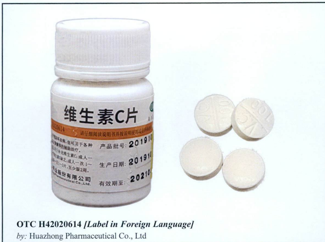
Larawan 4. Hindi rehistradong gamot

Napatunayan sa pamamagitan ng isinagawang Post-Marketing Surveillance (PMS) ng FDA na ang mga nasabing gamot ay hindi dumaan sa proseso ng rehistrasyon ng Ahensya at hindi nabigyan ng kaukulang awtorisasyon tulad ng Certificate of Product Registration (CPR). Dahil dito, hindi masisiguro ng Ahensya ang kalidad, kaligtasan at bisa nito. Samakatuwid, ang paggamit ng nasabing mga ilegal na produkto ay maaaring magdulot ng panganib sa kalusugan.