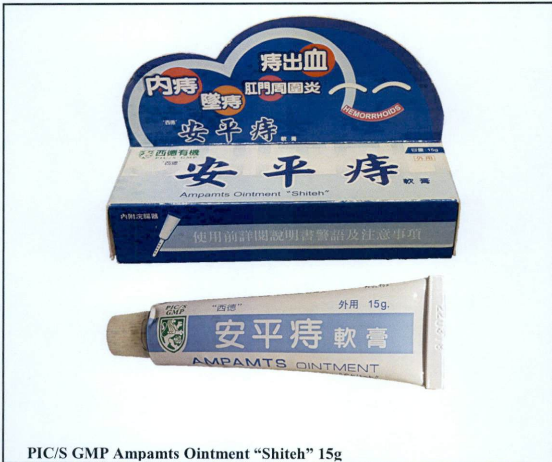
PIC/S GMP Ampamts Ointment "Shiteh" 15g

Pinapayuhan ng Food and Drug Administration (FDA) ang publiko laban sa pagbili at paggamit ng mga hindi rehistradong gamot na: