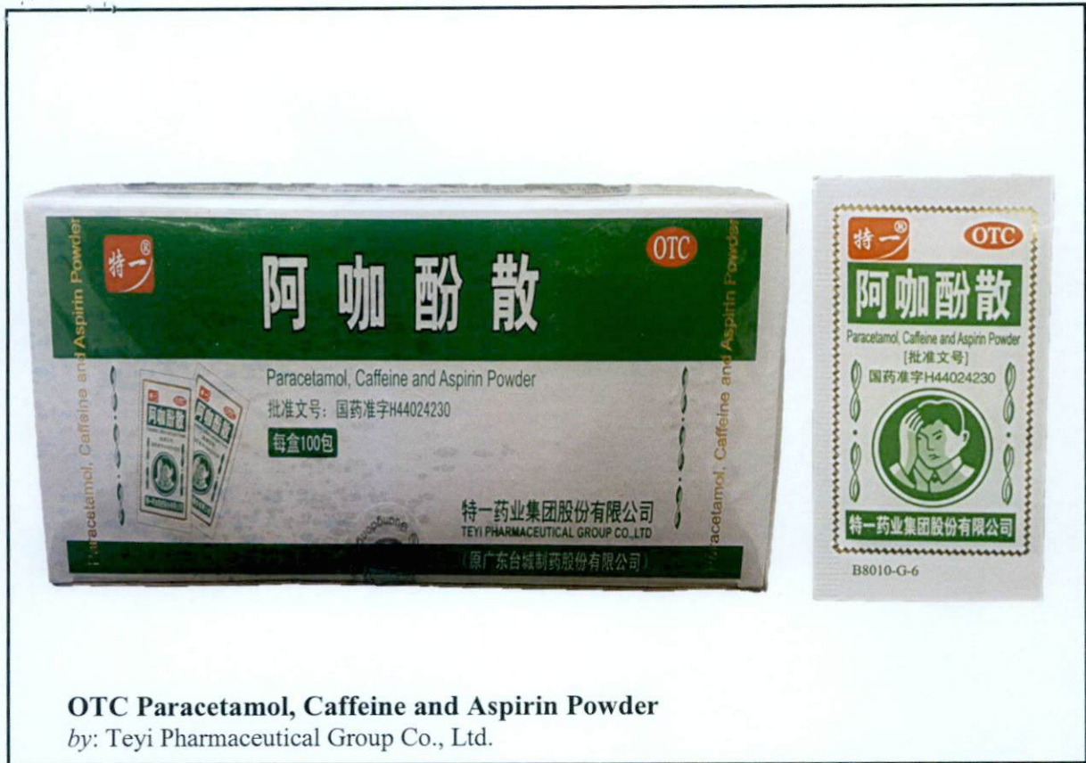
Larawan 2. Hindi rehistradong gamot