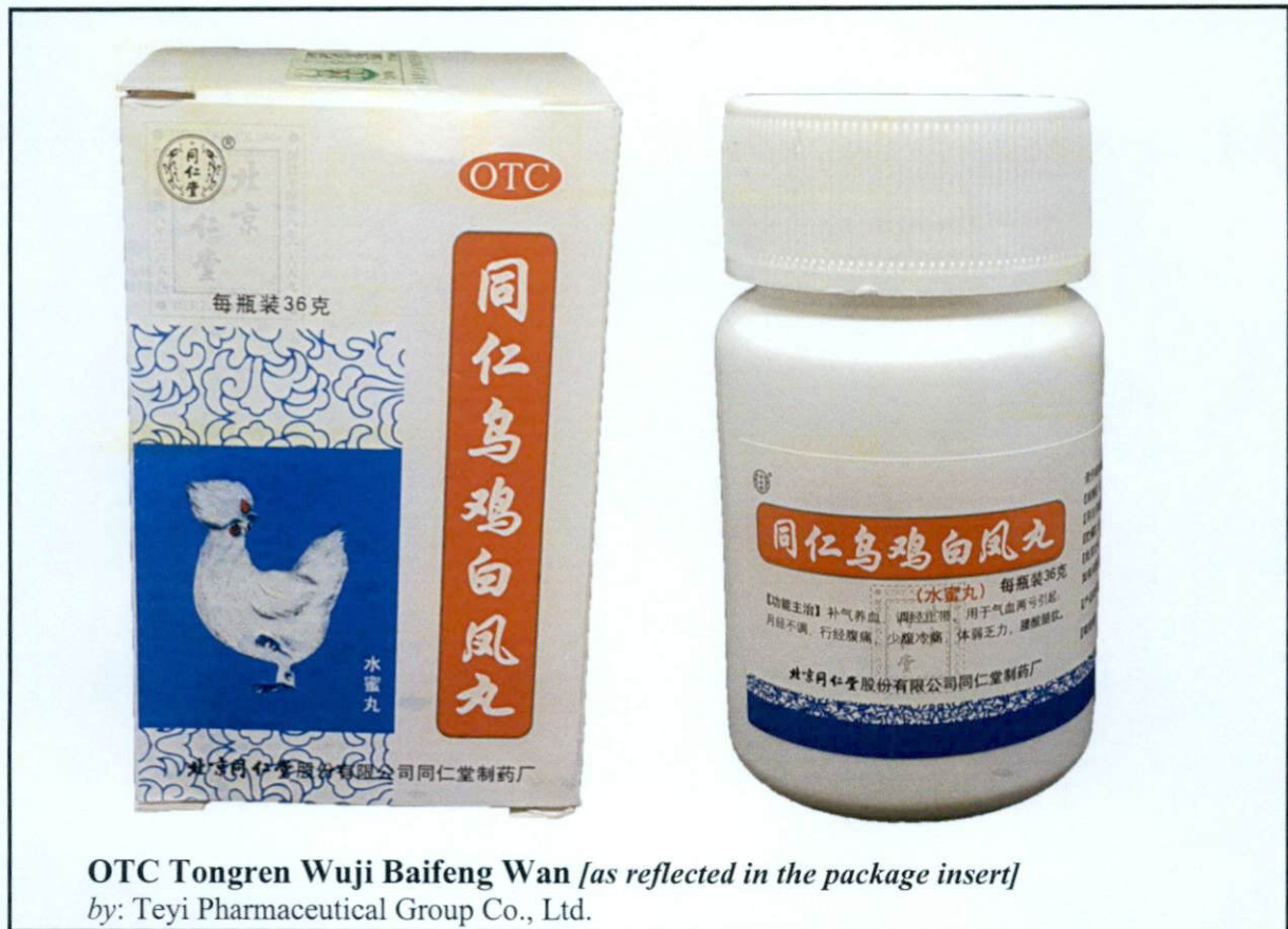
Larawan 3. Hindi rehistradong gamot