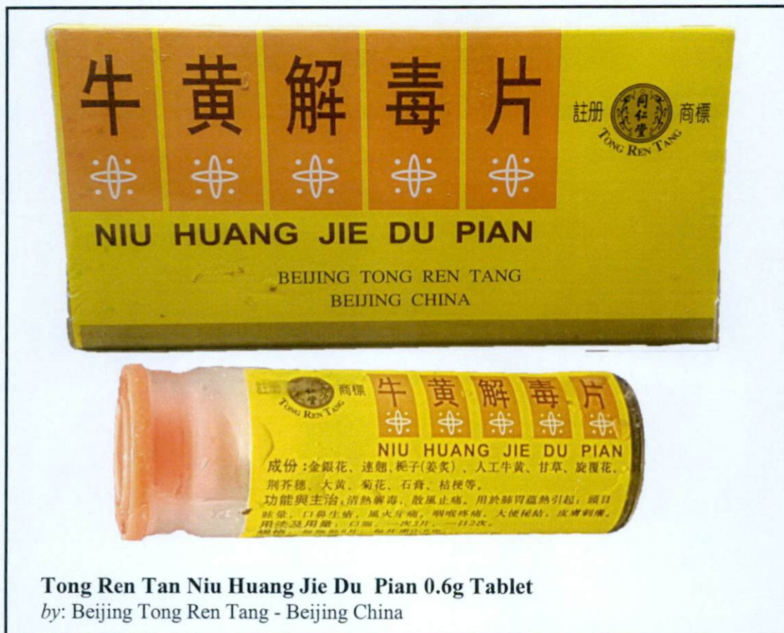
Tong Ren Tan Niu Huang Jie Du Pian 0.6g Tablet by: Beijing Tong Ren Tang - Beijing China

Pinapayuhan ng Food and Drug Administration (FDA) ang publiko laban sa pagbili at paggamit ng mga hindi rehistradong gamot na: