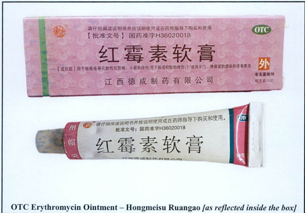
Larawan 4. Hindi rehistradong gamot