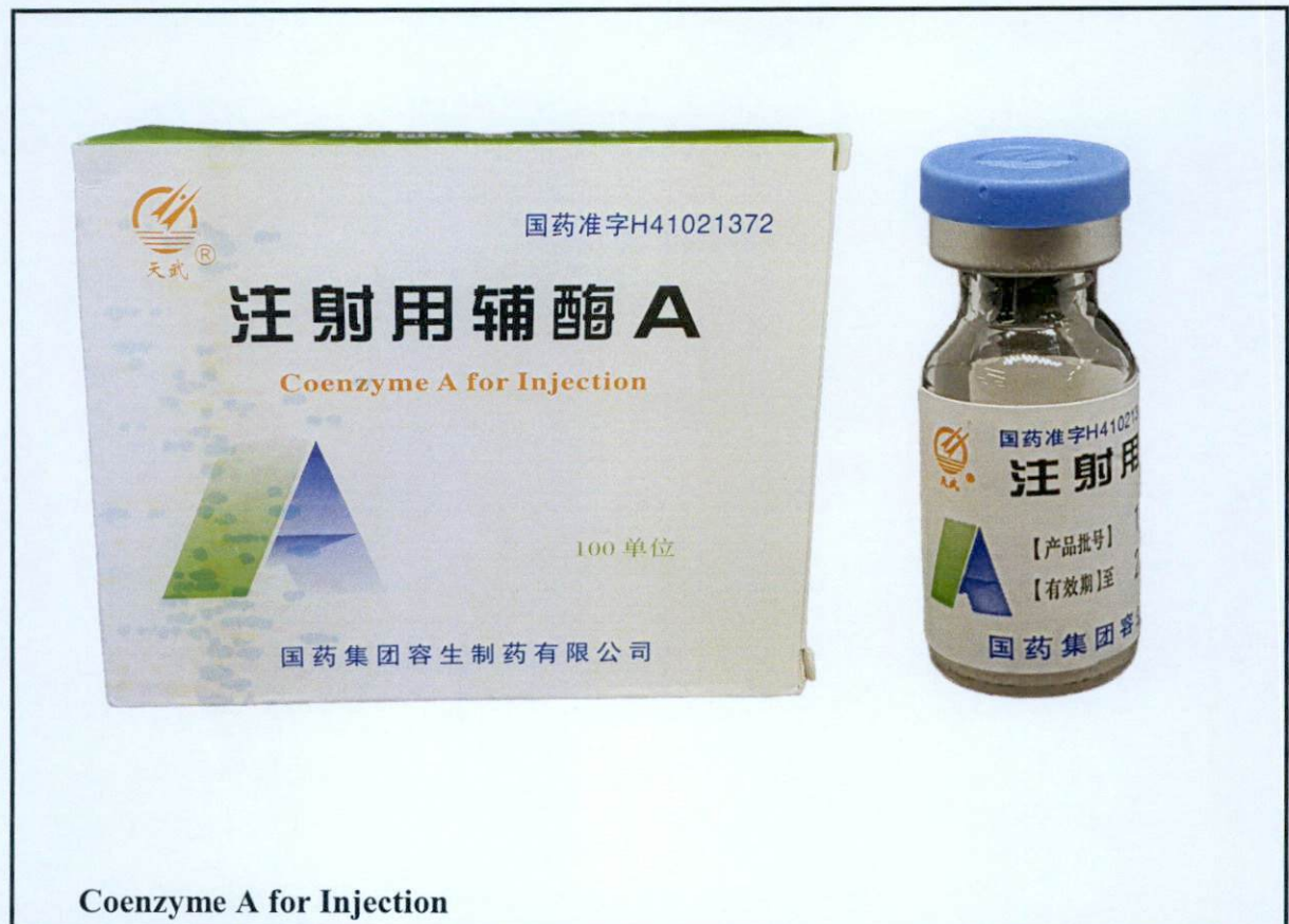
Larawan 3. Hindi rehistradong gamot