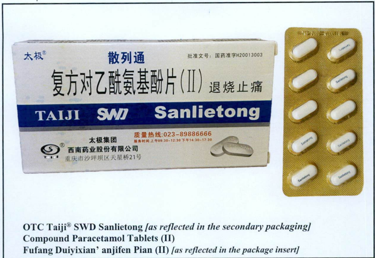
Larawan 2. Hindi rehistradong gamot