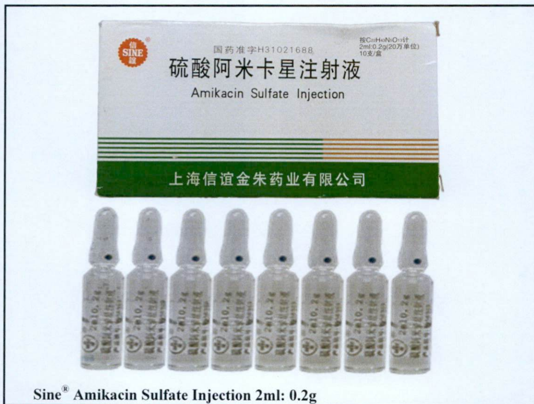
Sine ® Amikacin Sulfate Injection 2ml: 0.2g

Pinapayuhan ng Food and Drug Administration (FDA) ang publiko laban sa pagbili at paggamit ng mga hindi rehistradong gamot na: