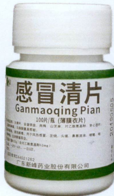
Xinfeng Yaoye® Ganmaoqing Pian