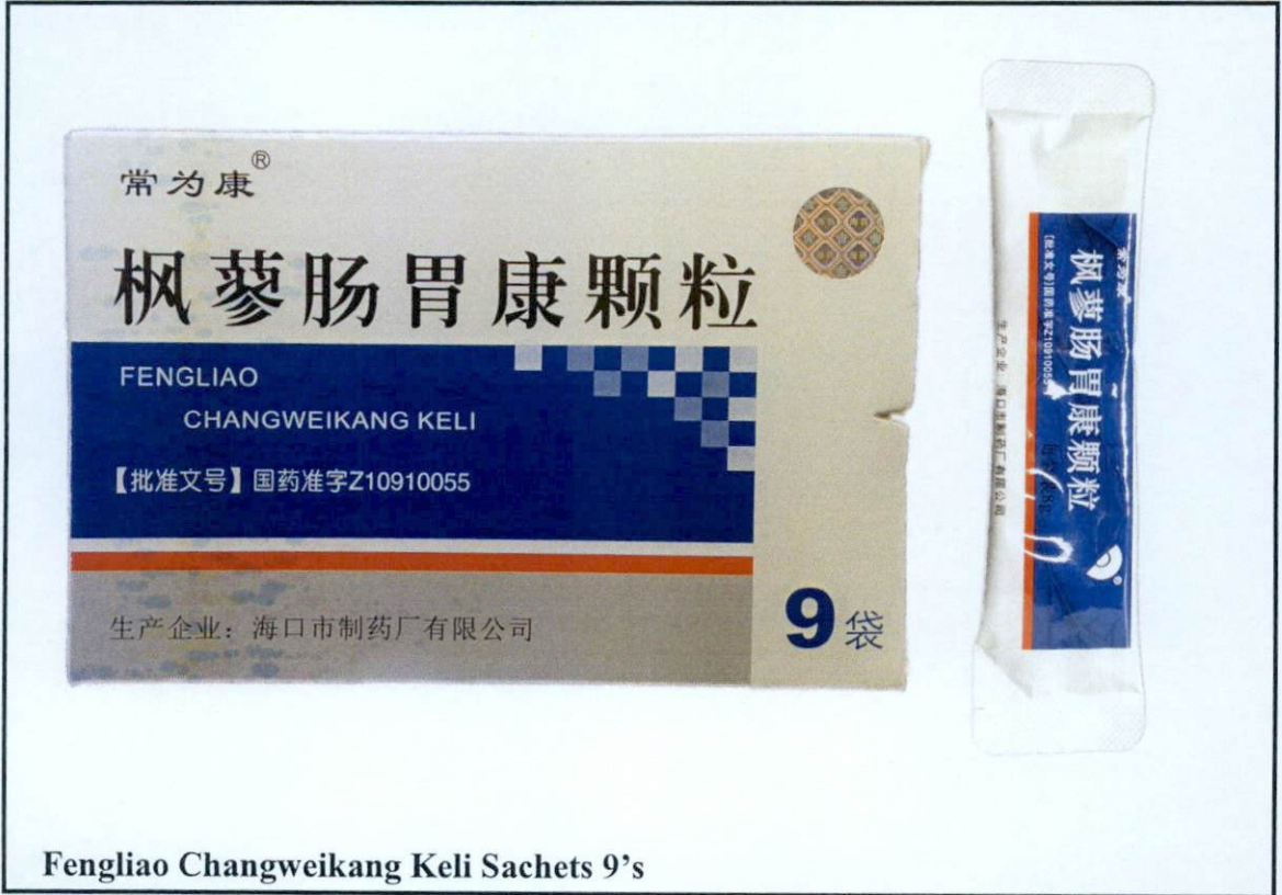
Larawan 5. Hindi rehistradong gamot