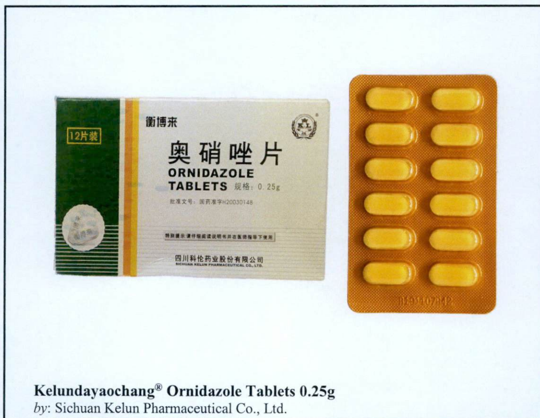
Kelundayaochang® Ornidazole Tablets 0.25g by: Sichuan Kelun Pharmaceutical Co., Ltd.

Pinapayuhan ng Food and Drug Administration (FDA) ang publiko laban sa pagbili at paggamit ng mga hindi rehistradong gamot na: