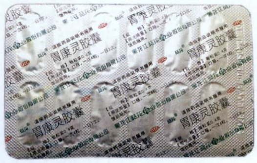
OTC Weikangling Jiaonang [as reflected in the package insert]