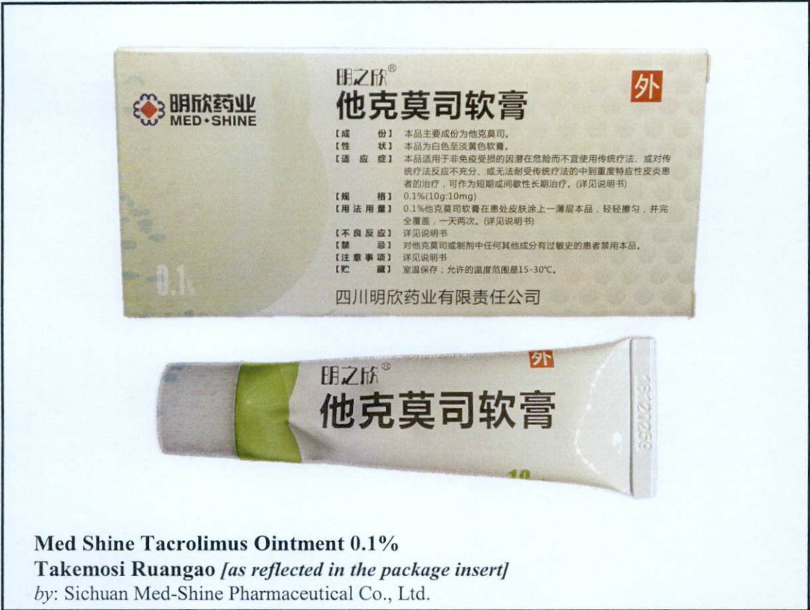
Larawan 4. Hindi rehistradong gamot