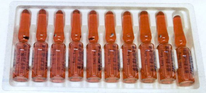
SY® Vitamin B12 Injection – Weishengsu B12 Zhusheye 1ml: 1mg