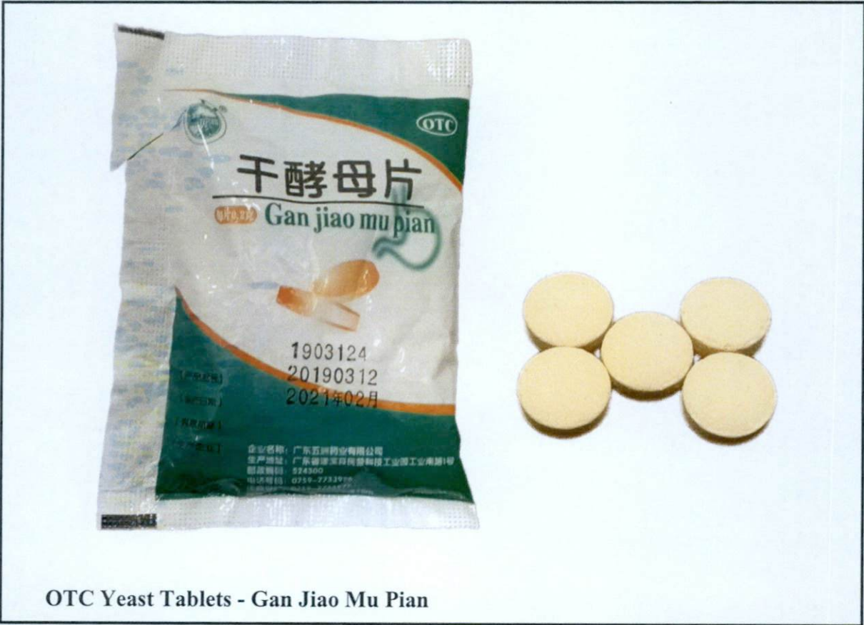
Larawan 3. Hindi rehistradong gamot