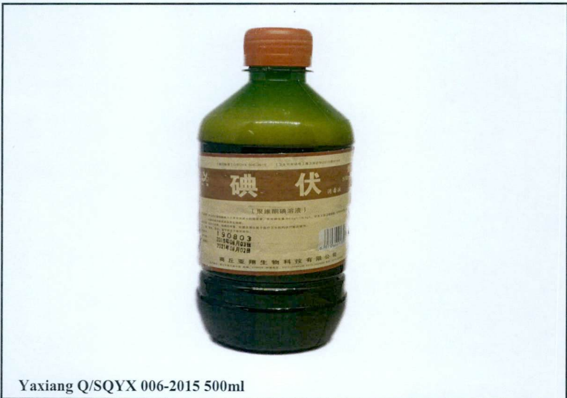
Yaxiang Q/SQYX 006-2015 500ml