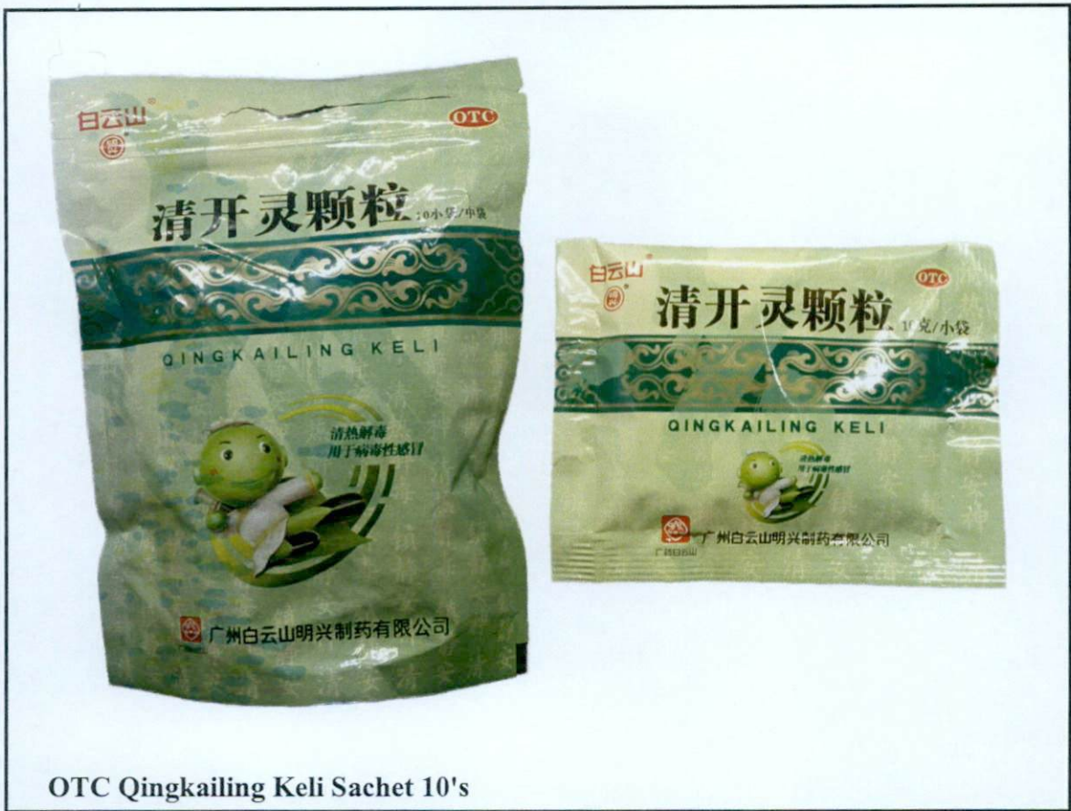
OTC Qingkailing Keli Sachet 10's