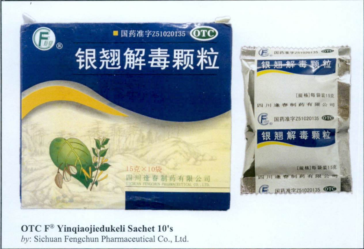
Larawan 2. Hindi rehistradong gamot