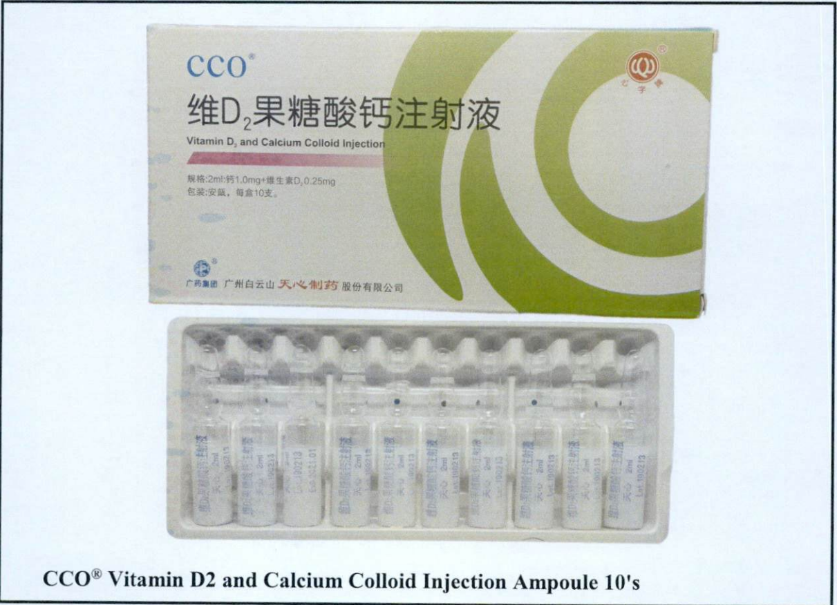
CCO® Vitamin D2 and Calcium Colloid Injection Ampoule 10's