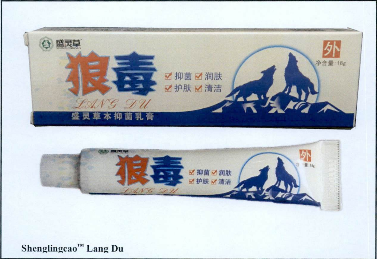
Shenglingcao™ Lang Du