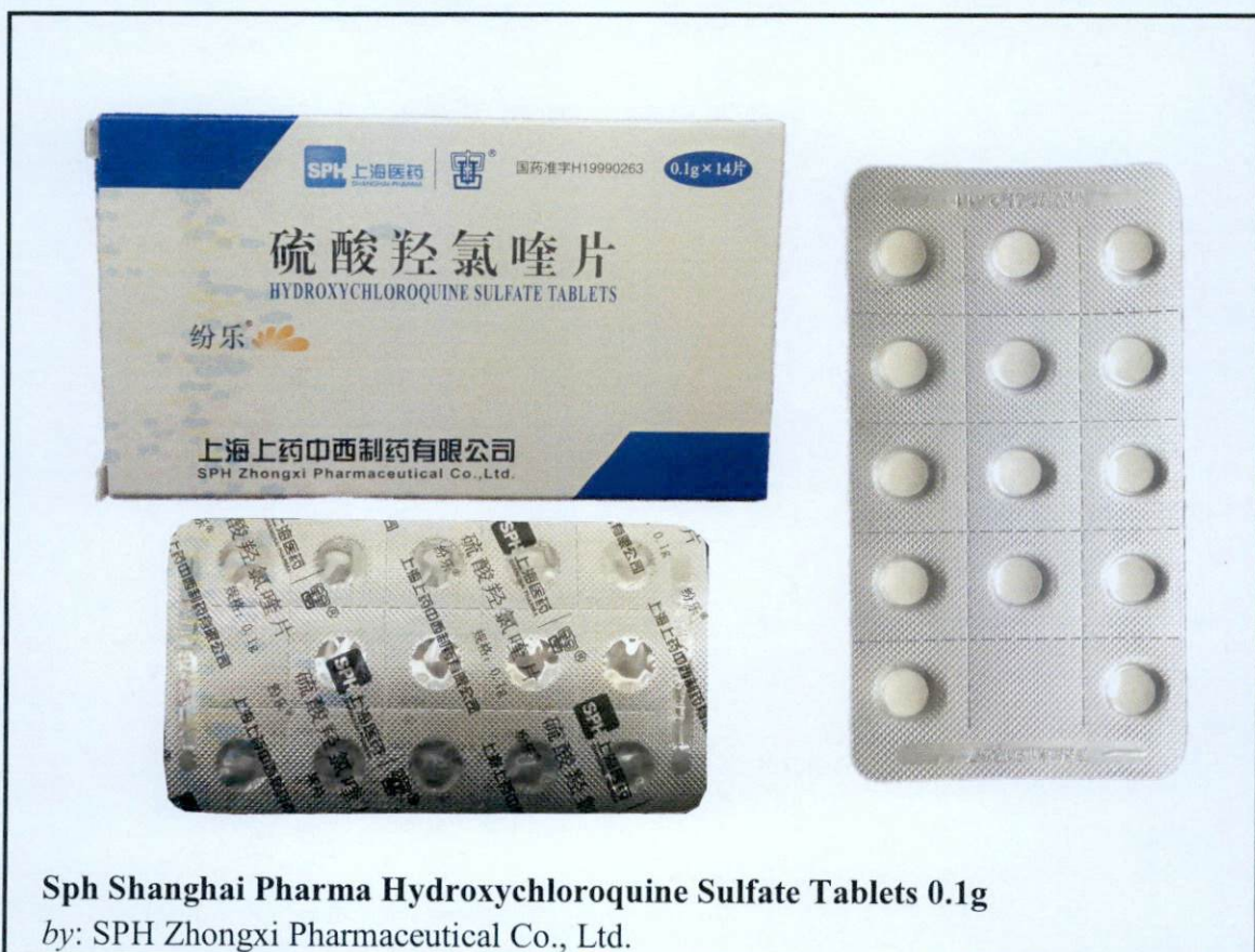
Sph Shanghai Pharma Hydroxychloroquine Sulfate Tablets 0.1g

by: SPH Zhongxi Pharmaceutical Co., Ltd.