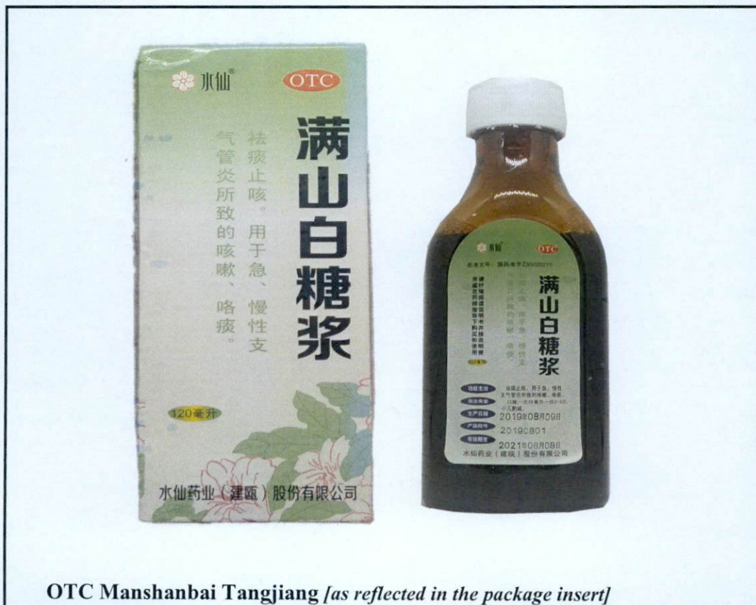
OTC Manshanbai Tangjiang [as reflected in the package insert]

Pinapayuhan ng Food and Drug Administration (FDA) ang publiko laban sa pagbili at paggamit ng mga hindi rehistradong gamot na: