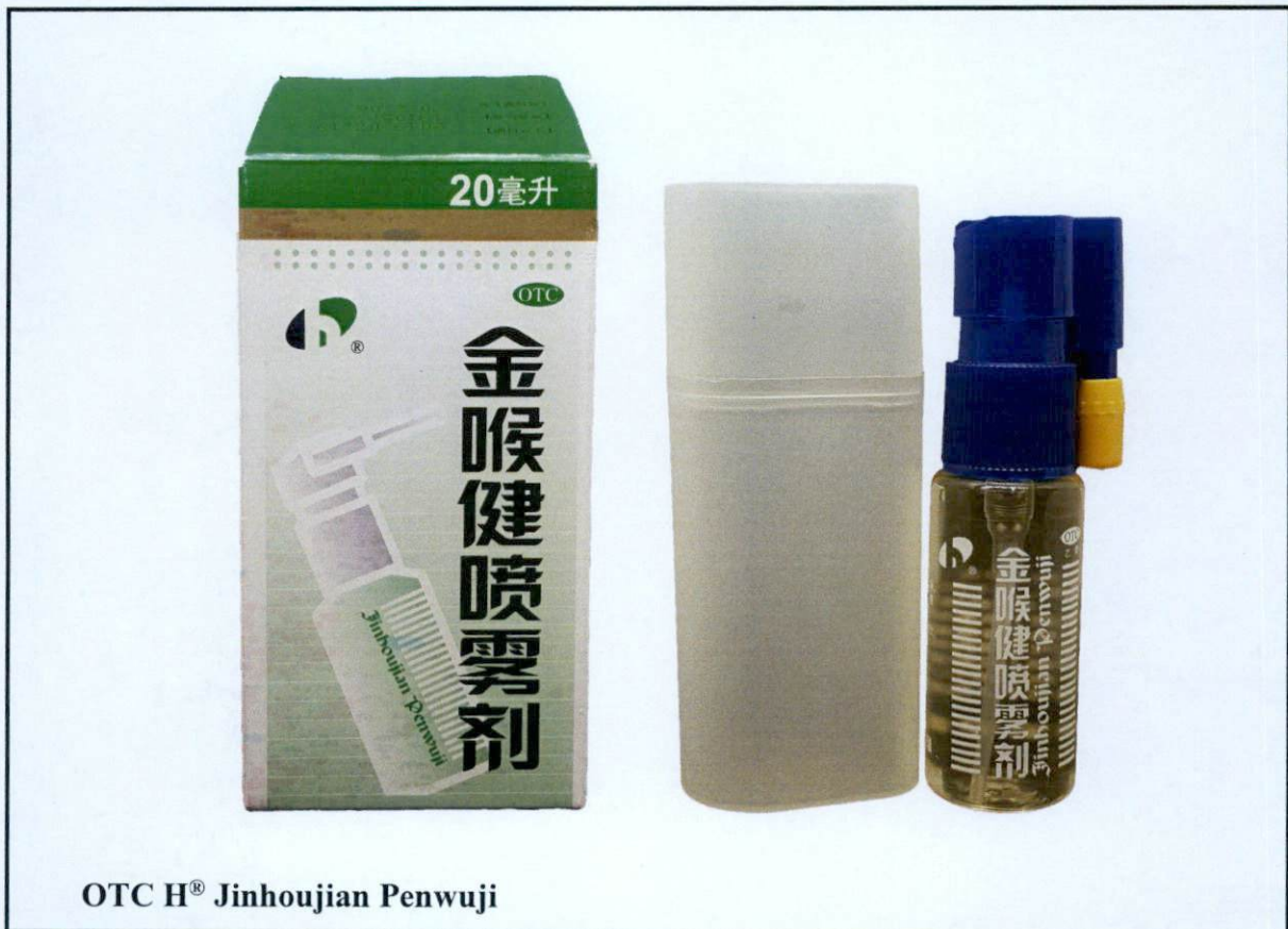
OTC H® Jinhoujian Penwuji