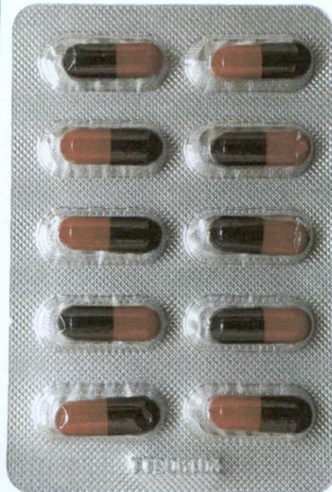
OTC Tongbianling Jiaonang