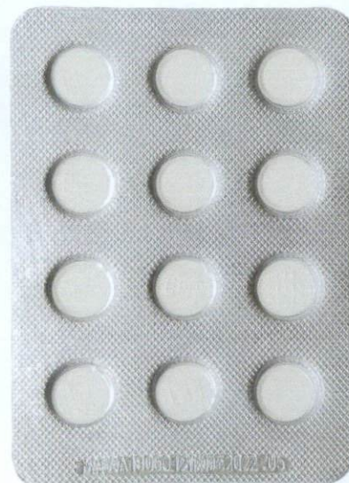
Erythromycin Ethylsuccinate Tablets 0.125g

by: Zhejiang Jingxin Pharmaceutical Co., Ltd.