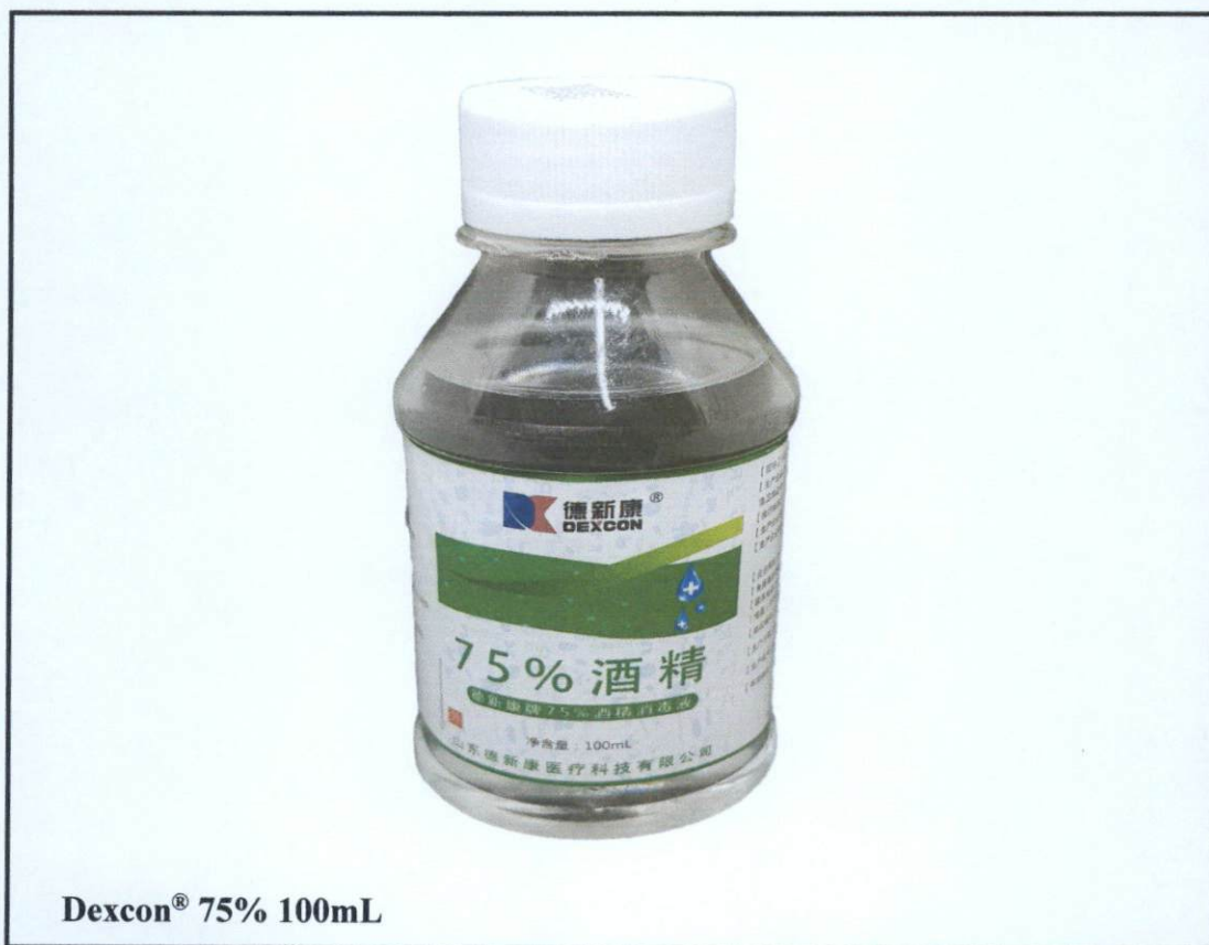
Dexcon® 75% 100mL

Pinapayuhan ng Food and Drug Administration (FDA) ang publiko laban sa pagbili at paggamit ng mga hindi rehistradong gamot na: