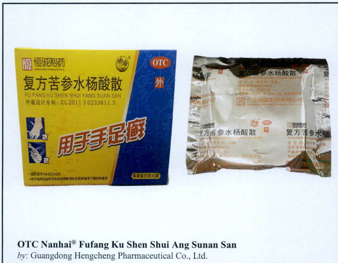
OTC Nanhai® Fufang Ku Shen Shui Ang Sunan San by: Guangdong Hengcheng Pharmaceutical Co., Ltd.

Pinapayuhan ng Food and Drug Administration (FDA) ang publiko laban sa pagbili at paggamit ng mga hindi rehistradong gamot na: