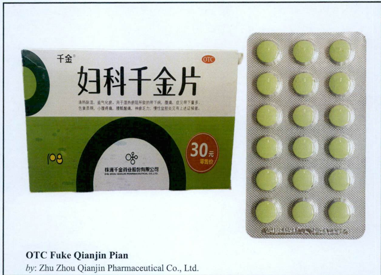
OTC Fuke Qianjin Pian

by: Zhu Zhou Qianjin Pharmaceutical Co., Ltd.