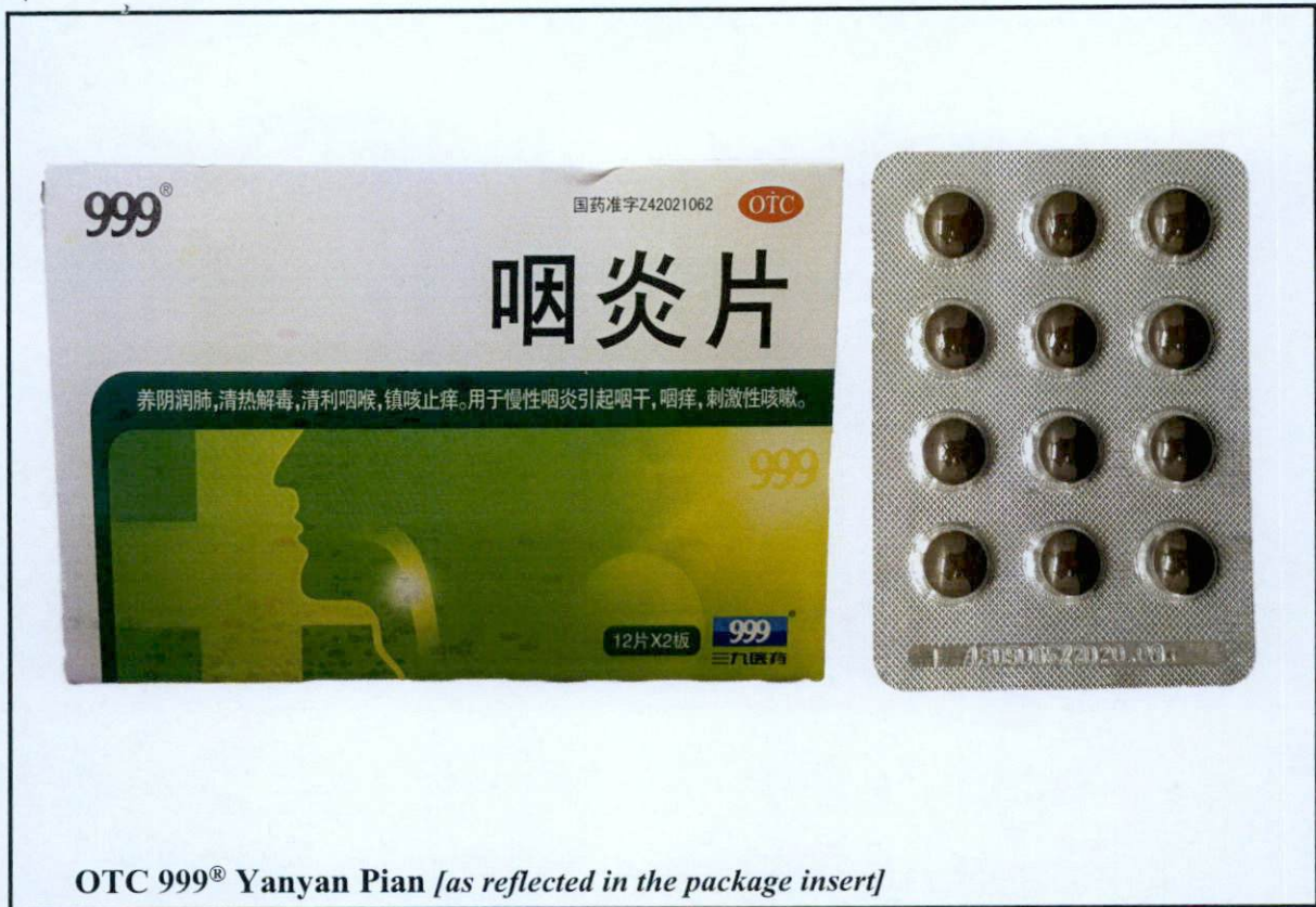
OTC 999 ® Yanyan Pian [as reflected in the package insert]