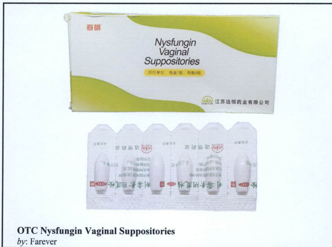
OTC Nysfungin Vaginal Suppositories by: Farever

Pinapayuhan ng Food and Drug Administration (FDA) ang publiko laban sa pagbili at paggamit ng mga hindi rehistradong gamot na: