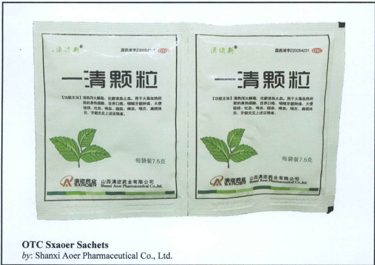
OTC Sxaoer Sachets by: Shanxi Aoer Pharmaceutical Co., Ltd.