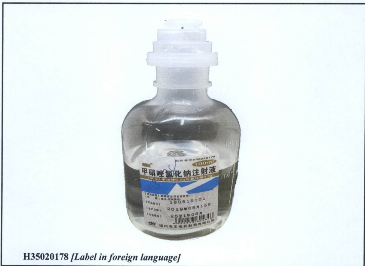
H35020178 [Label in foreign language]