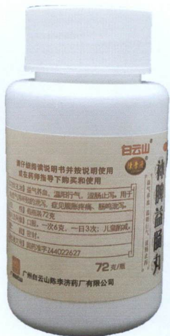
OTC Bupi Yichang Wan [as reflected in the package insert]