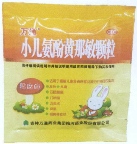
OTC WT® Pediatric Paracetamol, Artificial Cow-bezoar and Chlorphenamine Maleate Granules

Xiao'er Anfen Huang Namin Keli 6g [as reflected in the package insert]