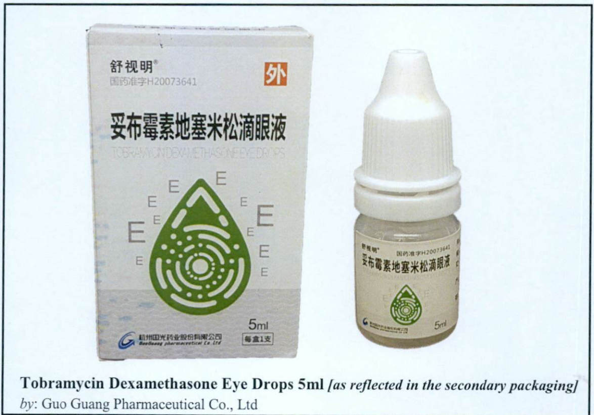
Larawan 5. Hindi rehistradong gamot