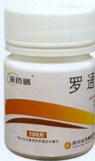
OTC Rotundine Tablets – Luotongding Pian [as reflected in the package insert] by: Sichuan King Apothecary Pharmaceutical Co., Ltd