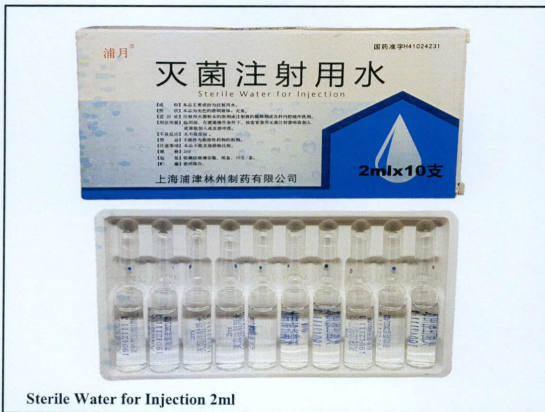
Sterile Water for Injection 2ml

Pinapayuhan ng Food and Drug Administration (FDA) ang publiko laban sa pagbili at paggamit ng mga hindi rehistradong gamot na: