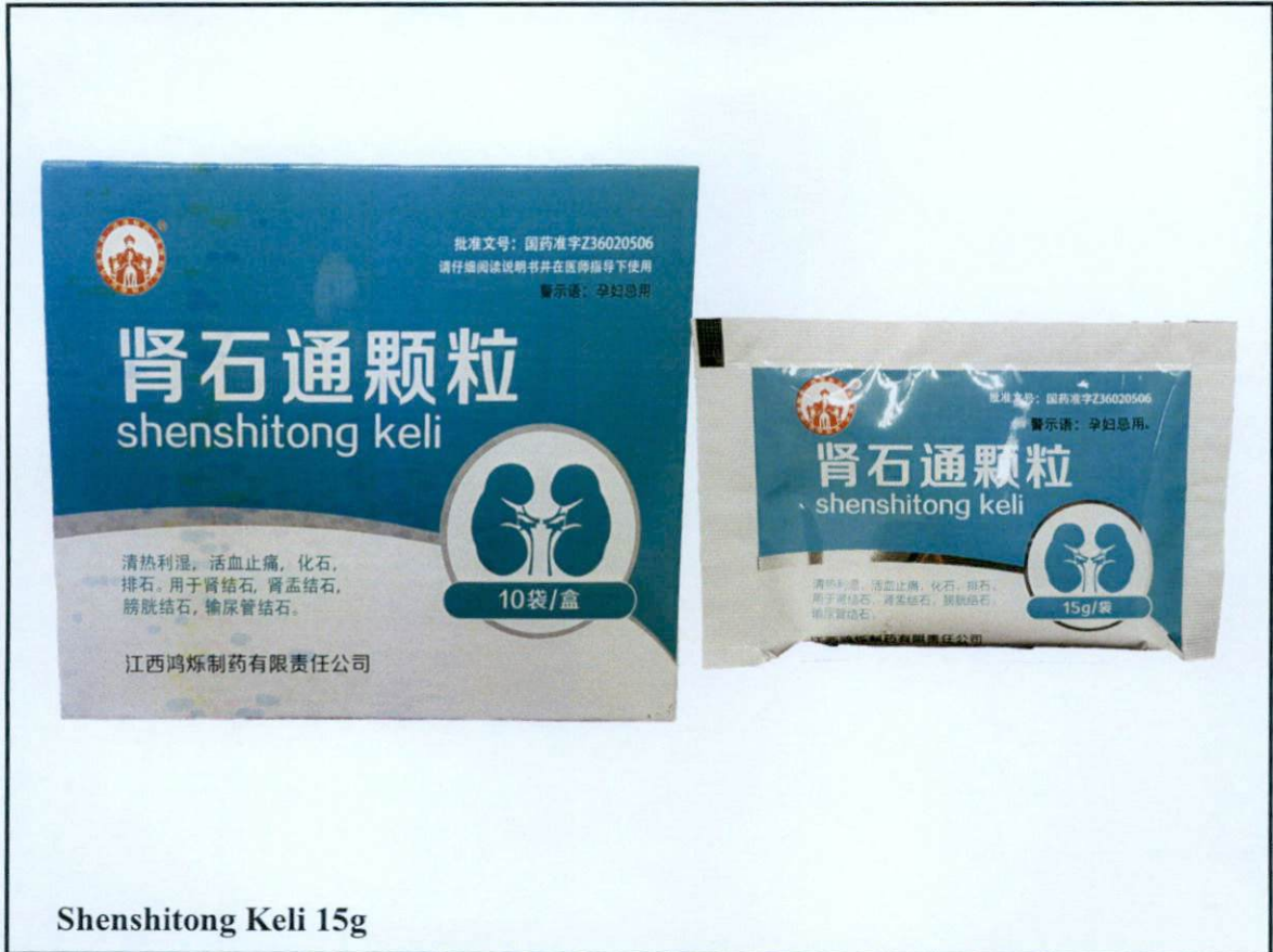
Larawan 4. Hindi rehistradong gamot